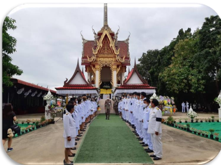
เจ้าหน้าที่ปฏิบัติงานพิธี ให้คำแนะนำการตั้งแถวรับกลองเพลิงพระราชทาน งานพระราชทานเพลิงศพ นายธง รักญาด วันที่ ๒๐ ตุลาคม ๒๕๖๓ ณ.วัดหัวทุ่ง จ.อ่างทอง