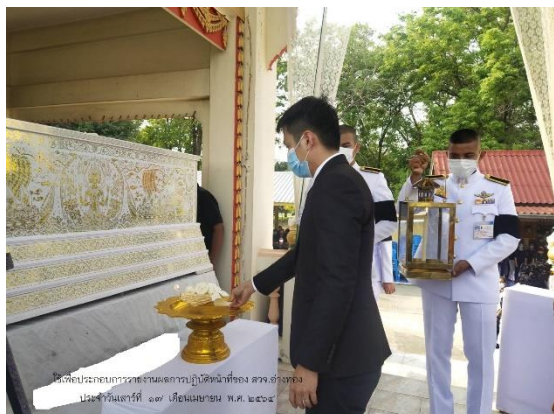
เจ้าหน้าที่ปฏิบัติงานพิธี แนะนำการรับกลองเพลิงพระราชทานพิธีพระราชทานเพลิงศพกรณีพิเศษและปฏิบัติหน้าที่เชิญดอกไม้จันทน์พระราชทานและไฟพระราชทานพิธีพระราชทานเพลิงศพกรณีพิเศษ