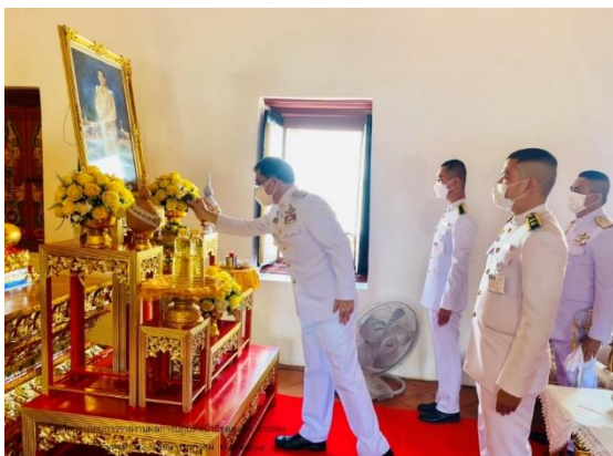
สนับสนุนงานศาสนพิธี ณ.วัดไชโยวรวิหาร อ.ไชโย จ.อ่างทอง และวัดป่าโมกวรวิหาร อ.ป่าโมก จ.อ่างทอง