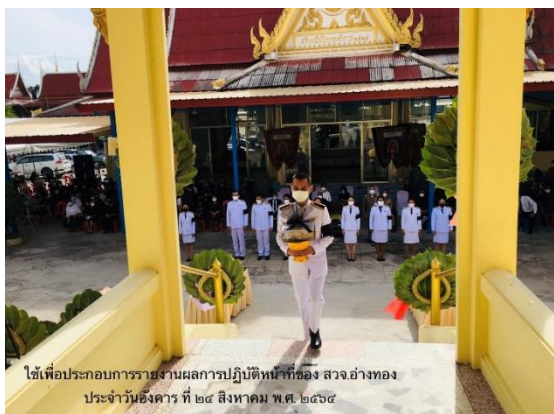
เจ้าหน้าที่ปฏิบัติงานพิธี ประสานงานประสานในพิธี ในการพระราชทานเพลิงศพ และปฏิบัติงานพิธีเชิญกลองเพลิงพระราชทาน ณ.วัดอ่างทองวรวิหาร อ.เมืองอ่างทอง จ.อ่างทอง