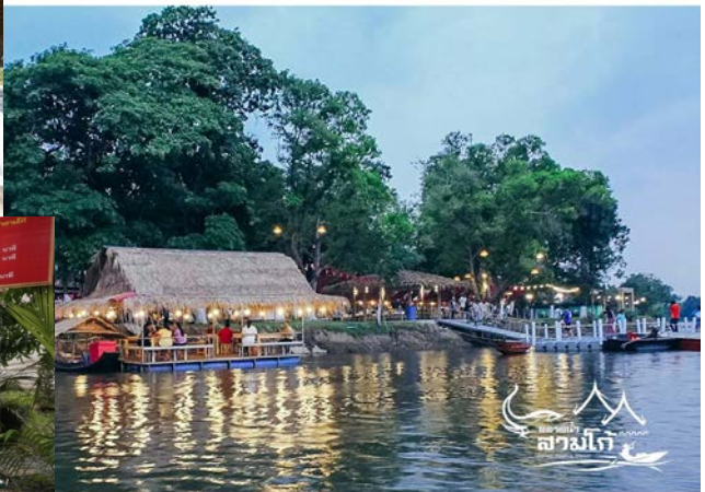
นั่งสูดพลังงาน สายลม แสงแดดวันสุดท้ายของวันที่ริมน้ำ ที่ไปจากที่ใดก็ตาม