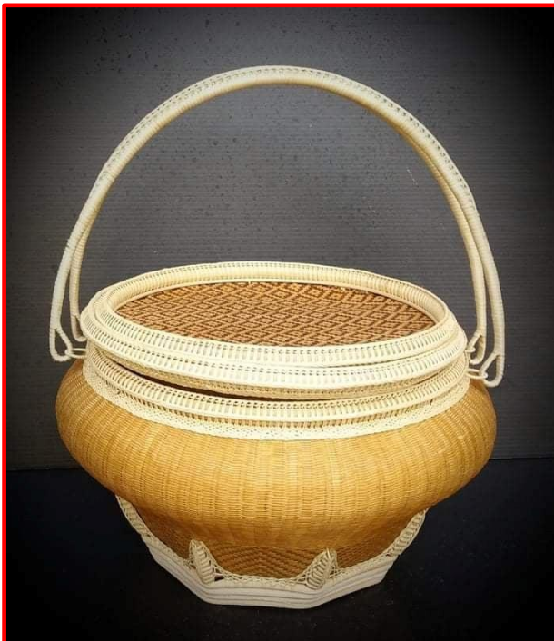
แบบหิ้วได้