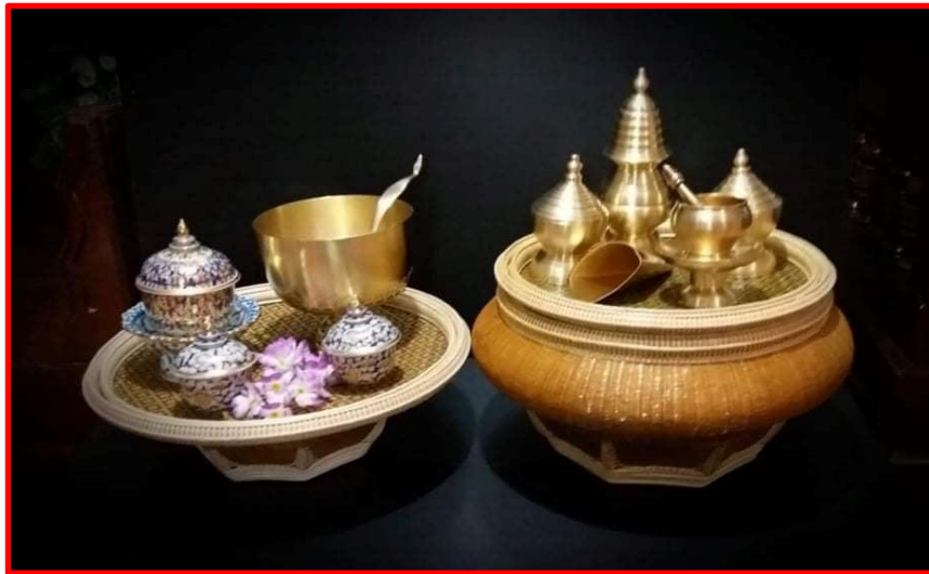
แบบวางโชว์