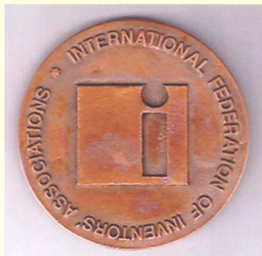
The Árpád Bogsch Memory Medal