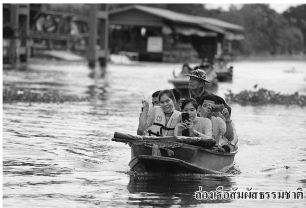
ล่องเรือสัมผัสธรรมชาติ

ดู วยมองเห็น ความสำคัญ เรื่องการปลูกฝัง เยาวชนคนรุ่นใหม่ให้ ซึมซับเรื่องเศรษฐกิจ พอเพียง หนึ่งใน ศาสตร์พระราชา บริษัท แอดวานซ์อิน โฟร์ เซอร์วิส จำกัด (มหาชน) จัด โครงการเอไอเอส ถอดรหัสนวัตกรรม