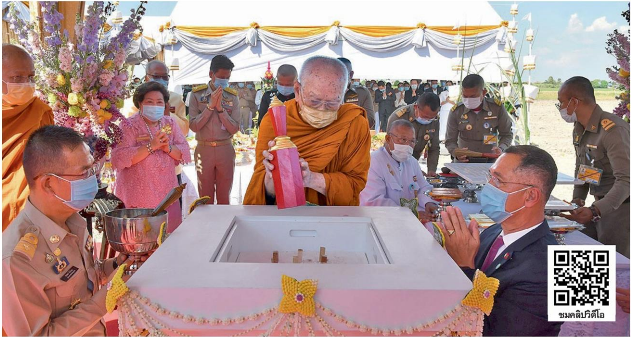
สมเด็จพระอริยวงศาคตญาณ สมเด็จพระสังฆราช สกลมหาสังฆปริณายก เสด็จไปทรงเป็นประธานในพิธีวางศิลาฤกษ์โครงการจัดสร้างสถานปฏิบัติธรรมสมเด็จพระสังฆราช (อมพรมหาเถร) ที่สถานปฏิบัติธรรมสมเด็จพระสังฆราช ต.ลำลูกกา อ.ลำลูกกา จ.ปทุมธานี เมื่อวันที่ 27 ธันวาคม

หัวข้อข่าว: วางศิลาฤกษ์ศูนย์ปฏิบัติธรรม 'พระสังฆราช'