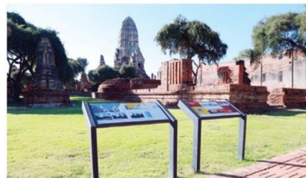
ป้ายโบราณสถานที่สำคัญ

สถาปัตยกรรมไทยในอดีตของโบราณสถานในยุคสมัยต่างๆ ทั้งๆ ที่ปัจจุบันจะเหลือเพียงแค่ฐานรากที่มีแต่เศษอิฐร่องรอยสถาปัตยกรรมและชิ้นงานด้านศิลปกรรมบางส่วน แต่โลกดิจิทัลก็สามารถนำภาพของความรุ่งเรืองแห่งยุคสมัยในอดีตกลับมาให้เห็น