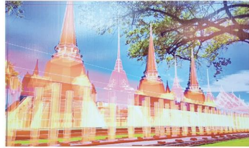
AR วัดพระศรีสรรเพชญ์