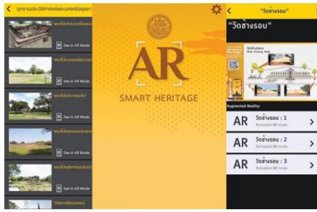
หน้าจอ AR SMART HERITAGE