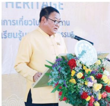
ประทีป เพ็งตะโก อธิบดีกรมศิลปากร