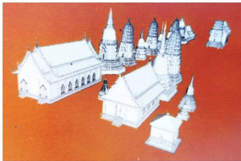
ภาพลัคนิฐานจากโบราณสถาน