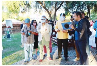
การชมด้วยระบบ VR