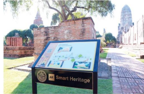
ป้าย AR SMART HERITAGE