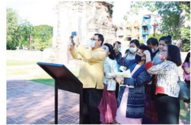
การชมจากโทรศัพท์มือถือ