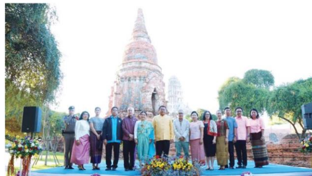
พิธีเปิด AR SMART HERITAGE

โบราณสถานจริง โดยผ่านเทคโนโลยี AR ทำให้ผู้เข้าชมสามารถจินตนาการเห็นถึงความรุ่งเรืองและยิ่งใหญ่ของเมืองมรดกโลก ปัจจุบันสามารถชมโบราณสถานภายในอุทยานประวัติศาสตร์พระนครศรีอยุธยา จำนวน ๑๑ แห่ง รวมถึงวัดราชบูรณะ และตามโบราณสถานในอุทยานประวัติศาสตร์ที่ได้รับการประกาศเป็นมรดกโลก ได้แก่ อุทยานประวัติศาสตร์สุโขทัย ๑๐ แห่ง อุทยานประวัติศาสตร์ศรีสัชนาลัย ๙ แห่ง และอุทยานประวัติศาสตร์กำแพงเพชร ๖ แห่ง ซึ่งทุกคนสามารถสแกนคิวอาร์โค้ดจากป้ายหน้าโบราณสถานแต่ละแห่ง และเปิดแอปฯ เพื่อซ้อนภาพกับสถานที่จริงได้ทันที