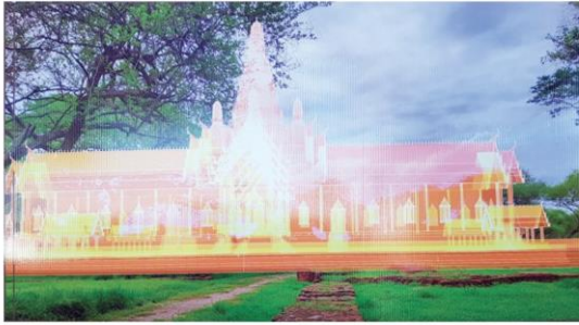
AR พระที่นั่งวิหารสมเด็จ

คอลัมน์: ภูมิบ้านภูมิเมือง: 'AR SMART HERITAGE' ภูมินวัตกรรมเรียนรู้โบราณสถาน