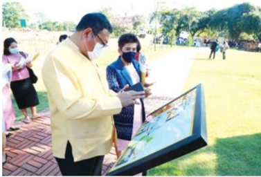
ถ่ายคิวอาร์โค้ดเพื่อชม

คอลัมน์: ภูมิบ้านภูมิเมือง: 'AR SMART HERITAGE' ภูมินวัตกรรมเรียนรู้โบราณสถาน