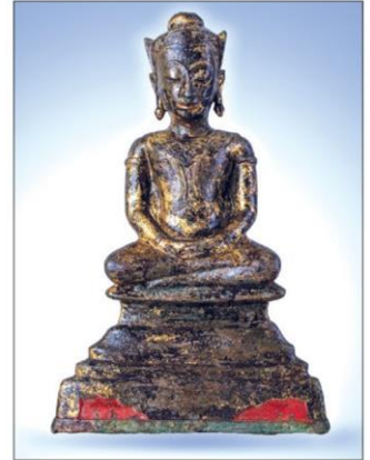
พระพุทธรูปทรงเครื่องสมาธิ