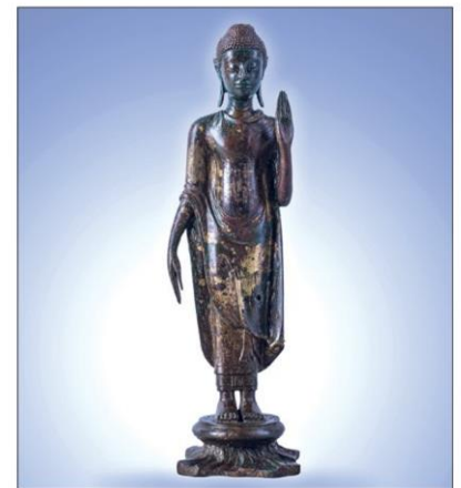
พระพุทธรูปห้ามแก่นจันทน์