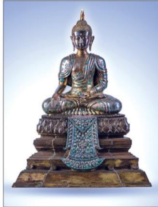
พระพุทธรูปฉันทสมอ