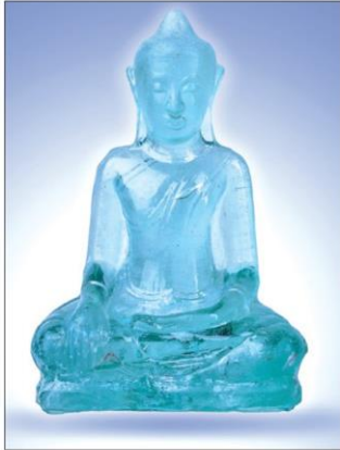
พระพุทธรูปแก้วมารวิชัย