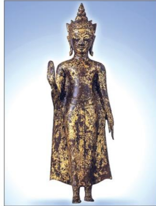
พระพุทธรูปทรงเครื่องประธานอภัย