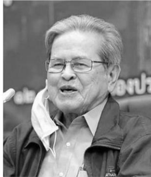
ศาสตราจารย์ นพ.ประเวศ วะสี