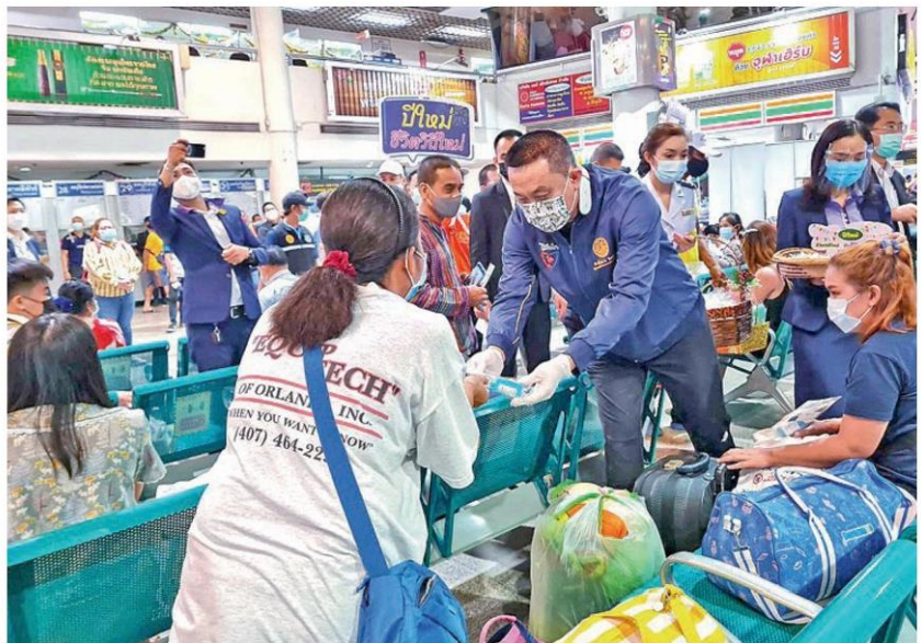
แจ็กเจล - นายศักดิ์สยาม ชิดชอบ รัฐมนตรีว่าการกระทรวงคมนาคม แจกเจลแอลกอฮอล์และหน้ากากอนามัยแก่ประชาชนผู้ใช้บริการรถ บขส.เดินทางกลับภูมิลำเนาและท่องเที่ยวช่วงเทศกาลปีใหม่ บริเวณอาคารผู้โดยสาร สถานีขนส่งหมอชิต เมื่อวันที่ 29 ธันวาคม

นอกจากนี้ บขส.ได้จัดเตรียมแอลกอฮอล์เจลล้างมือให้บริการแก่ผู้โดยสาร รวมทั้งเพิ่มความถี่ในการทำความสะอาดและฆ่าเชื้อโรค โดยใช้แอลกอฮอล์และน้ำยาฆ่าเชื้อโรคเช็ดทำความสะอาดพื้นอาคาร แก้วพักคอยผู้โดยสาร เคาน์เตอร์จำหน่ายตั๋ว บริเวณห้องโถงผู้โดยสาร ห้องสุขา รถ