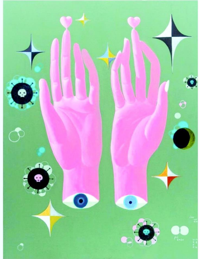
ผลงาน "Story of Life,Chapter 2: Covid-19" โดยเกรียงไกร กงกะนันทน์