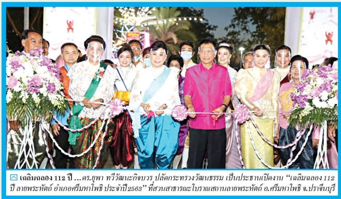
☑ เฉลิมฉลอง 112 ปี ...ดร.ยุพา ทวีวัฒนะกิจบวร ปลัดกระทรวงวัฒนธรรม เป็นประธานเปิดงาน “เฉลิมฉลอง 112 ปี ลายพระหัตถ์ อําเภอศรีมหาโพธิ ประจำปี 2563” ที่สวนสาธารณะโบราณสถานลายพระหัตถ์ อ.ศรีมหาโพธิ จ.ปราจีนบุรี