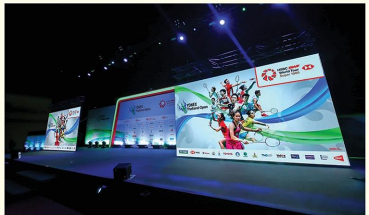
แบดมินตันเวิลด์ทัวร์ 3 รายการใหญ่ตลอดเดือนมกราคมนี้

อีกทีม ใช้จังหวะแห่งความเป็นไทยที่จะชูโรงให้กับการแข่งขันกีฬาแบดมินตัน ได้เป็นอย่างดี อีกทั้งยังมีท่วงทำนองบรรเลงอย่างยิ่งใหญ่ แสดงถึงช่วงเวลาแห่งชัยชนะในการแข่งขัน ที่จะถูกใช้ในช่องของการรับรางวัลในการแข่งขันทั้ง 3 รายการนี้