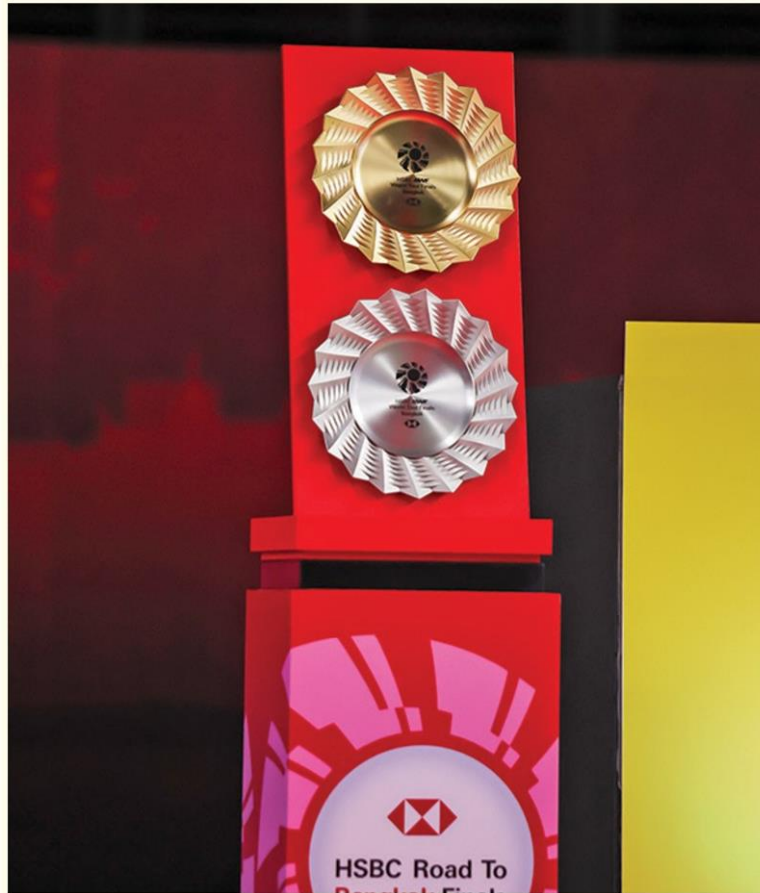
ถ้วยรางวัลต่างๆ

ขณะที่นักกีฬาต่างชาติ ก็แสดงความชื่นชมเป็นเสียงเดียวกัน ว่าไทย เป็นเจ้าภาพได้อย่างสมบูรณ์แบบ ทั้ง ระบบขนส่ง แบบนิวนอร์มอลของศบค. ในการรองรับนักกีฬา เจ้าหน้าที่ กว่า 800 คน ที่แต่ละชาติ จะมีรถบัสประจำ ชาตินั้น ๆ ในการเดินทางไปสนามซ้อม และสนามแข่งขัน นั่งห่างกัน มีพื้นที่ วางอุปกรณ์แข่งขันแยกเฉพาะ และมีการทำความสะอาดอยู่ตลอดเวลา รวมทั้งไทยยังได้ลงทุน เปิดห้องฟิตเนส ที่มีอุปกรณ์ในการออกกำลังกายระดับโลก ให้ถึง 3 ห้องตั้งอยู่ในอิมแพค อารีนา เมืองทองธานี เพื่อให้ นักกีฬาทุกคน ได้เตรียมความพร้อมของร่างกาย ก่อนเริ่มการแข่งขันในครั้งนี้ อีกด้วย โดยมีการทำความสะอาดห้องฟิตเนส อยู่อย่างต่อเนื่องเช่นเดียวกัน