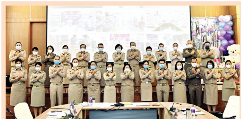
☑️ ตำนานทุจริต... นางยุพา ทวีวัฒนะกิจบวร ปลัดกระทรวงวัฒนธรรม (วธ.) นำผู้บริหารสำนักงานปลัดวธ.และวัฒนธรรมจังหวัด ร่วมประกาศเจตจำนงสุจริตและแสดงสัญลักษณ์ต่อต้านการทุจริตของกระทรวงวัฒนธรรมผ่านระบบวิดีโอคอนเฟอเรนซ์ไปยังสำนักงานวัฒนธรรมจังหวัดทั่วประเทศ ณ ห้องประชุม วธ. เมื่อเร็ว ๆ นี้