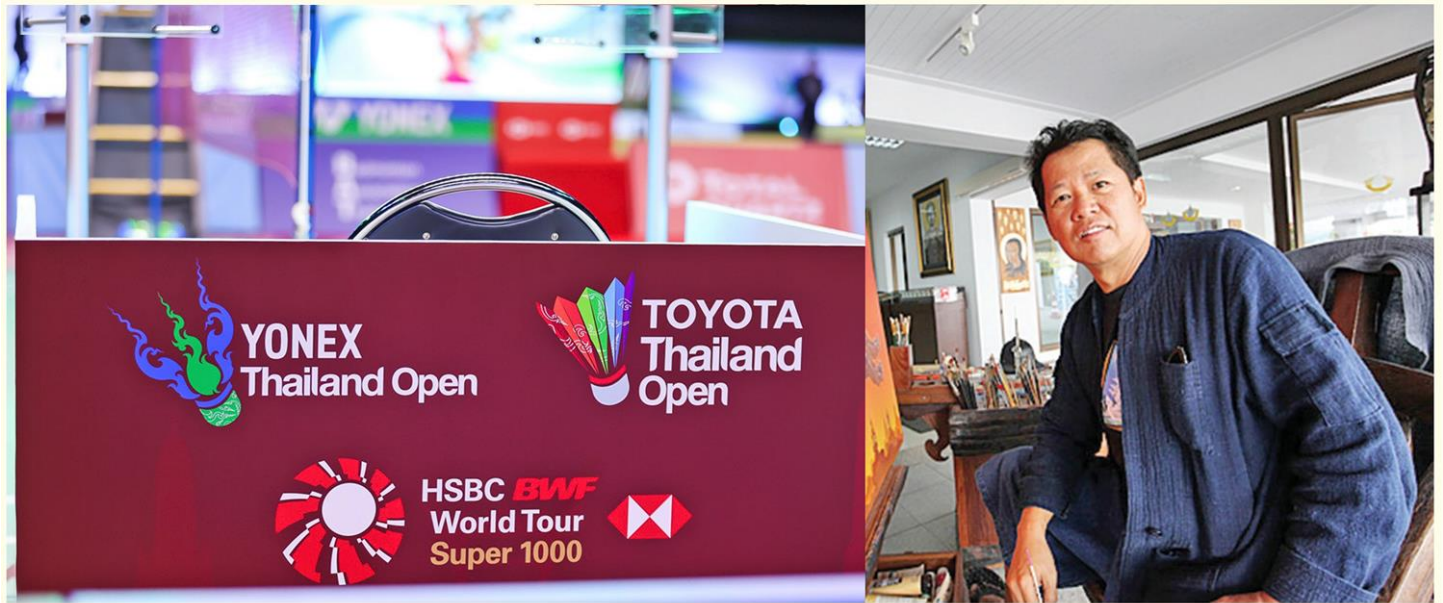
ออกแบบโลโก้เอกลักษณ์ความเป็นไทยชัดเจน