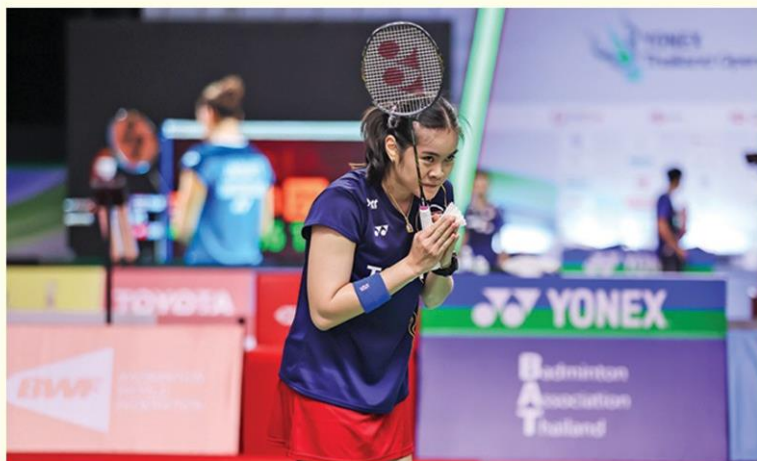
นักแบดมินตันไทยกับการแสดงออกด้วยการไหว้สวัสดีไปทั่วโลก

อื่นๆ ในช่วงสถานการณ์การแพร่ระบาดของไวรัสโควิด-19 นับจากนี้ นายกสมาคมกีฬาแบดมินตันฯ กล่าวต่อว่า ก่อนหน้านี้ สหพันธ์แบดมินตันโลก ประกาศปฏิทินการแข่งขันสำหรับครึ่งแรกของปี 2021 ไปแล้ว โดยทาง โธมัส ลุนด์ ระบุว่า เราได้เรียนรู้มากมายจากการแข่งขันเหล่านี้ เราจะนำสิ่งที่เรียนรู้ที่เป็นไปได้ทั้งหมดนี้ไปใช้กับการแข่งขันรายการอื่น ๆ ที่จะเกิดขึ้นต่อไป เพื่อให้รับมือจากผลกระทบของโควิด-19 ให้ได้