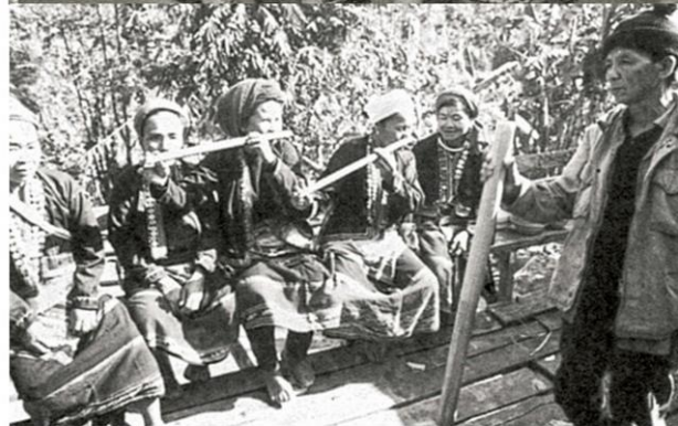
หญิงชาวขมุกำลังร้องรำทำเพลงในพิธีขึ้นบ้านใหม่ จ.น่าน

[ภาพและคำอธิบายจากหนังสือ เพศและวัฒนธรรม ของ ปราณี วงษ์เทศ สำนักพิมพ์นาตาเอก พิมพ์ครั้งที่สาม พ.ศ.2559]