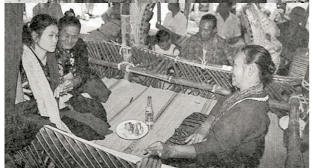
(บน) หญิงกะเหรี่ยงแม่ลูกอ่อนเพื่อแผ่แม่ให้แก่ลูกหมูพลัดแม่ อ.สังขละบุรี จากกาญจนบุรี (ล่าง) ชาวมอญนับถือผีเรือน มักจะทำพิธีรำผีเมื่อมีคนในบ้านป่วยหรือทำผิดซึ่งจะมีได้ (หรือหัวหน้าผู้ประกอบพิธี) เป็นผู้หญิง