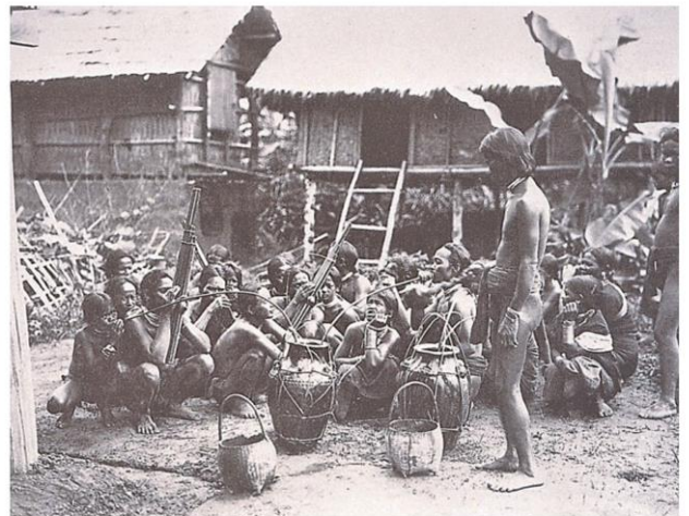
ชาติพันธุ์สองฝั่งโขง (ซ้าย) นั่งชันเข่าดูการละเล่น? (ขวา) ดูดุในพิธีเลี้ยงผี