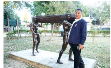
ประติมากรรมเพิงตะโก อธิบดีกรมศิลปากร

“คนแพร่นี้ใจงาม” สะท้อนถึงอัตลักษณ์เฉพาะของเมือง จนรู้กันทั่วไปว่าเมืองแพร่มีการสร้างบ้านหรือเรือนไม้สักกันมาก เรือนไม้สักแต่ละแห่งมีอายุกว่าร้อยปี และเป็นหลักฐานแสดงภูมิปัญญาสุดยอดเยี่ยมที่สร้างบ้านด้วยการเข้จรวงเข้าเตื่อยไม้