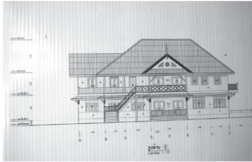
แบบอาคารเก่าไม้สัก