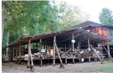
โรงเก็บไม้อาคารเก่า