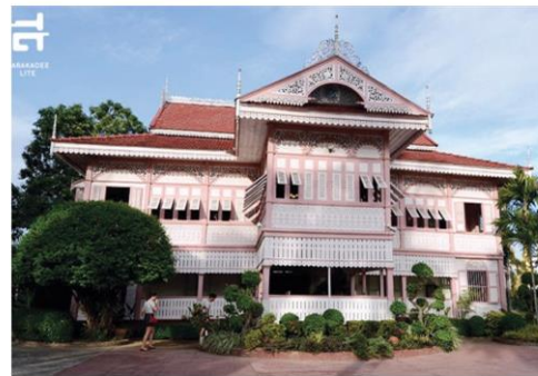
บ้านวงศ์บุรี

เพื่อช่วยทำไม้จนเป็นอุตสาหกรรมหลักของเมือง อีกทั้งเป็นจังหวัดที่บุกเบิกการสอนด้านการทำป่าไม้เริ่มจากโรงเรียนป่าไม้ ระดับประกาศนียบัตรในปี