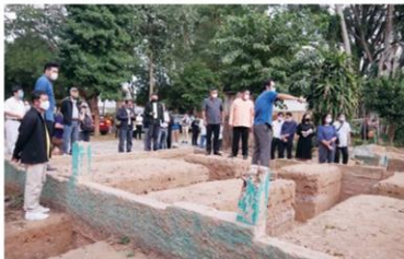
สำรวจสถานที่อาคารเก่า