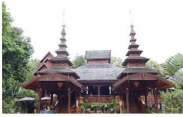
วัดจองสวรรค์

คอลัมน์: ภูมิบ้านภูมิเมือง: เรือนไม้สักเมืองแพร่-ภูมิอาคารไม้คลาสสิกในถิ่นเหนือ