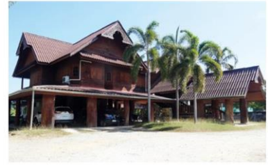
เรือนเก่าในแพร่