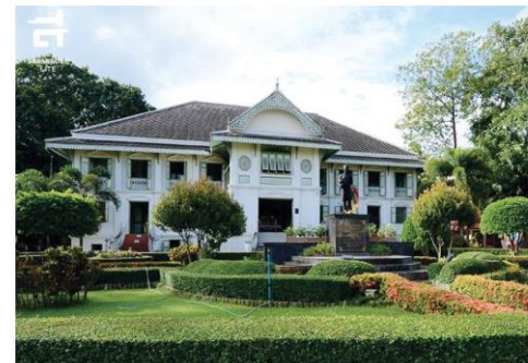
คุ้มเจ้าหลวง