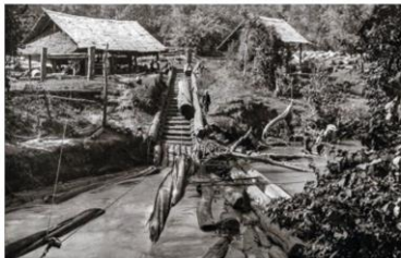
ปล่อยไม้ลงน้ำยม