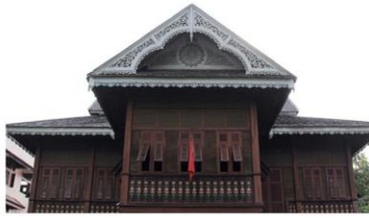
คุ้มวิชัยราชา