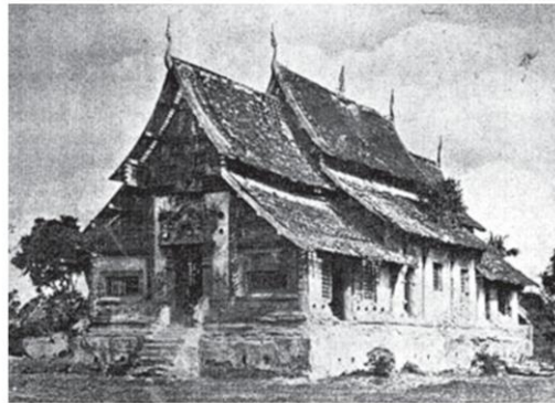
หอคำเชียงใหม่