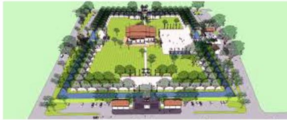
ผังการพัฒนาคุ้มหลวงเวียงแก้ว

คอลัมน์: ภูมิบ้านภูมิเมือง: 'เวียงหน้าคุ่มแก้ว' ภูมิสถานหอคาแห่งนครเชียงใหม่