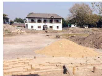
บริเวณการขุดตรวจ