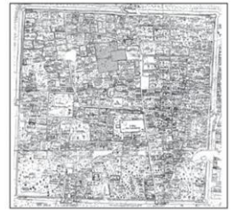
ผังเมืองเชียงใหม่ พ.ศ.๒๔๓๖

แนวกำแพงด้านใต้และด้านเหนือที่พบ จนทำให้ “เวียงแก้วหรือคุ้มหลวงเวียงแก้ว” นี้ ถูกกล่าวถึงมากขึ้นทันที ข้อมูลเมืองต้นบนดินนั้นประมาณเอาว่า เมื่อที่เจ้าหลวงอินทวิชยานนท์ขึ้นครองเมืองเชียงใหม่ใน พ.ศ.๒๔๑๔ แล้วได้มีการรื้อหอคาของเจ้าหลวงองค์ก่อนไปปลูกถวายวัดในเชียงใหม่ และย้ายไปประทับอยู่ยังวังแห่งใหม่ บริเวณโรงเรียนยุพราชในปัจจุบัน ตามแผนที่โบราณนครเชียงใหม่ พ.ศ.๒๔๓๖ ซึ่งชี้ให้เห็นว่าพื้นที่เวียงแก้วอาจมิได้ใช้งานเป็นวังมาตั้งแต่ พ.ศ.๒๔๑๔ หรือหลังจากนั้น แล้วพื้นที่เวียงแก้วก็ถูกกลับมาใช้งานอีกครั้งในสมัยเจ้าอินทวโรรส ยกให้ใช้เป็นเรือนจำมณฑลพายัพ ในราวปี พ.ศ.๒๔๕๑ ส่วนเรื่องไต่ดินนั้นยังรู้ไม่หมดต่ออาจอาศัยข้อมูลตรวจสอบกันเท่าที่มี เช่น พงศาวดารโยนก กล่าวว่า ท้าวพระยารามัญผู้รั้งเมืองนครเชียงใหม่ ได้กระทำการอุทกอาจมิได้อ่อนนุ่มต่อพระเจ้านครเชียงใหม่ขึ้นแล้ว ก็ชวนให้เชื่อว่า ท้าวพระยารามัญผู้รั้งเมืองนครเชียงใหม่ที่กระทำการอุทกอาจในคราวนั้นคงจะได้จัดค่ายซึ่งเป็นที่พำนักในบริเวณช่วงหลวงนั้นให้เป็นประตูกเมืองที่มีค่ายคู ประตูหอรบพร้อมสรรพ ชาวนครเชียงใหม่ในเวลานั้น จึงคงจะเรียกค่ายพำนักของท้าวพระยารามัญผู้รั้งเมืองนครเชียงใหม่ใหม่นี้ว่า “เวียงหน้าคุ่มแก้ว”