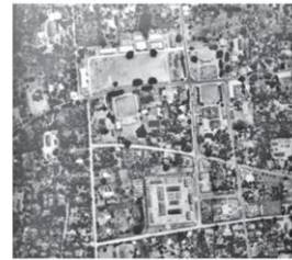
บริเวณคุ้มหลวงเวียงแก้ว