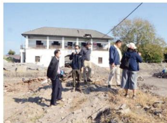
อธิบดีกรมศิลปากรตรวจพื้นที่