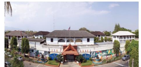
เรือนจำมณฑลพายัพในอดีต