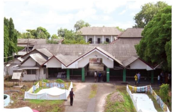
อาคารในเรือนจำ