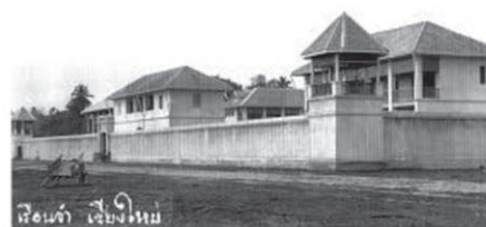
เรือนจำเชียงใหม่

พำนักอยู่ที่เวียงหน้าคุ่มแก้ว ซึ่งเป็นค่ายพักของพม่า ต่อมาตราบจนนางพญาวิสุทธิราชเทวีถึงพิราลัย ใน พ.ศ.๒๑๒๑ แล้ว เวียงหน้าคุ่มแก้วซึ่งปลูกสร้างด้วยไม้คงถูกปล่อยทิ้งและผุพังจนร้างรื้อถอนไป จากนั้นมาคำว่า “เวียงหน้าคุ่มแก้ว” คงเรียกกันเป็น “เวียงแก้ว” เมื่อพม่าครองเมืองนครเชียงใหม่ต่อมา จนถึงสมเด็จพระเจ้ากรุงธนบุรี ยกกองทัพมาตีเมืองเชียงใหม่ใน พ.ศ.๒๓๑๗ จนพม่าผู้รักษาเมืองนครเชียงใหม่แตกพ่ายหลบหนีออกจากเมืองทางประตูข้างเผือกและพากันล้มตายเป็นจำนวนมาก เสร็จศึกคราวนั้นแล้วเมืองเชียงใหม่ก็ถูกทิ้งร้างมาเป็นเวลาช้านานกว่า ๒๐ ปี จนถึง พ.ศ.๒๓๓๗ พระเจ้ากาวิละ ได้รับแต่งตั้งให้เป็นเจ้านครเชียงใหม่มาตั้งแต่ พ.ศ.๒๓๒๕ จึงได้คุมไพร่พลจากเวียงป่าซางมาฟื้นฟูเมืองเชียงใหม่ แต่ในระหว่างนั้นคงจะได้สร้างบ้านแปลงเมืองพร้อมทั้งสร้างหอคำขึ้นประดับเกียรติยศไว้เป็นที่พำนักภายในพื้นที่ตอนเหนือของเวียงแก้วก่อน ครั้นวันพฤหัสบดี เดือน ๖ (เหนือ) ขึ้น ๑๒ ค่ำ ตรงกับวันที่ ๙ มีนาคม พ.ศ.๒๓๓๙ พระเจ้ากาวิละจึงพร้อมด้วยญาติพี่น้องบุตรหลานแสนท้าวพระยาทั้งปวง พากันยกครัวเรือนจากเวียงป่าซางเข้ามาถึงเมืองนครเชียงใหม่...กระทำประทักษิณรอบนครแล้ว เวลาจวนเที่ยงก็เข้าประตูข้างเผือกอันเป็นประตูด้านทิศอุดร ไปพักพล ณ วัดเชียงมั่นอันเป็นที่ชัยภูมิแห่งนคร แรมในที่นั้นราตรีหนึ่ง รุ่งขึ้น ณ วันศุกร์ เดือน ๖