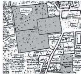
ผังคุ้มหลวงเวียงแก้ว