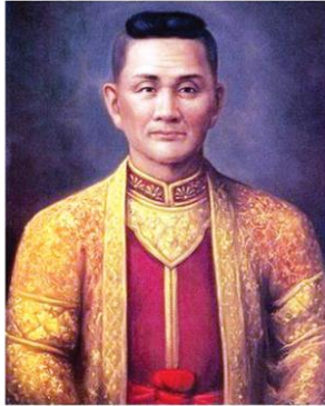
เจ้ากาวิละ