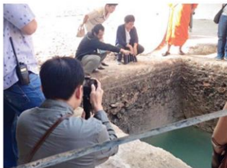
ชุดตรวจร่องรอยเวียงแก้ว