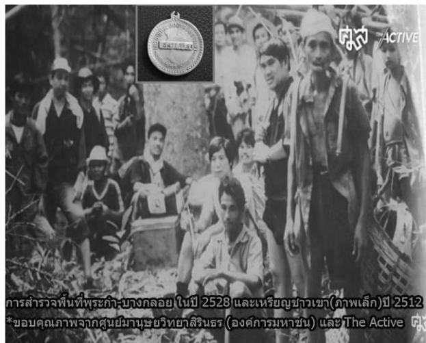
การสำรวจพื้นที่พระภิกษุบางกลอย ในปี 2528 และเหรียญขาวเขา(ภาพเล็ก)ปี 2512

ซึ่งในช่วงปี 2553-2554 นี้เองที่มี “ปฏิบัติการ ตะนาวศรี” ไล้เรือและเผาทำลายบ้านเรือนชาวบ้านในพื้นที่