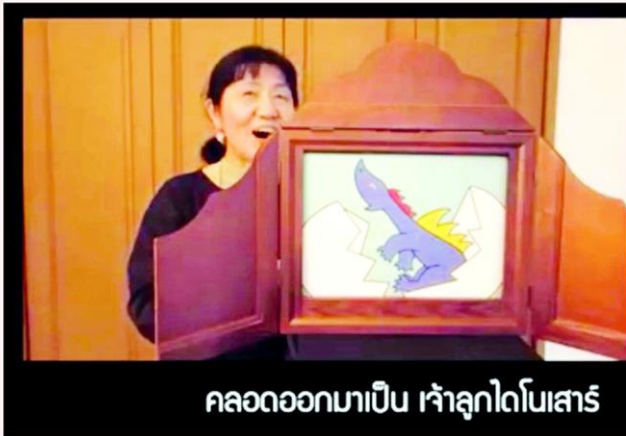
คลอดออกมาเป็น เจ้าลูกไดโบลาร์