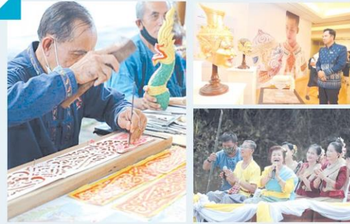
ตามรอยศาสตร์พระราชาสืบสาน รักษา ต่อยอด