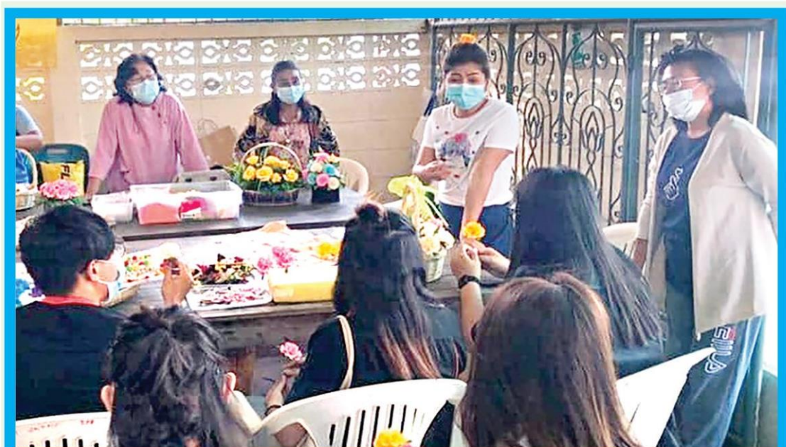
☑ อบรมปักสไบมอญ...ชุมชนคุณธรรมวัดบางเดื่อ ร่วมกับมหาวิทยาลัยเทคโนโลยีราชมงคลธัญบุรี และสำนักงานวัฒนธรรมจังหวัดปทุมธานี จัดอบรมการปักสไบมอญ ส่งต่อความรู้ให้แก่เด็ก เยาวชน ผู้สูงอายุในชุมชนให้สามารถสร้างรายได้ ที่กลุ่มพัฒนาอาชีพวัดบางเดื่อ อ.เมืองปทุมธานี จ.ปทุมธานี