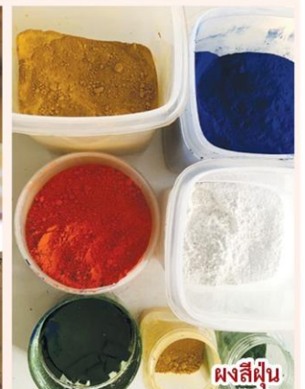
ผงสีฝุ่น

สีบางสีที่ผสมแล้วลอยก็จะมีเทคนิค มีวิธีการสร้างสรรค์ การใช้สี ผศ.เด่น ให้ความรู้ดีกว่า สีฝุ่น ในงานจิตรกรรมไทย แรกเริ่มมีสีเล็กน้อย ที่มีความหลากหลายมากขึ้นมาจากการติดต่อดำขายกับประเทศจีน อย่างที่ พระที่นั่งพุทไธสวรรย์ งานจิตรกรรมฝาผนังจะมีหลายสี มีสีแดง สีเขียว ฯลฯ ซึ่งแต่เดิมงานจิตรกรรมไทยสมัยอยุธยาที่สืบต่อจากสุโขทัยจะมีสีไม่มาก มีสีน้ำตาลอ่อน แดงดำ ที่ขยับมามีสีส้มเริ่มปรับเปลี่ยนเห็นได้ช่วงกลางและปลายสมัยอยุธยา