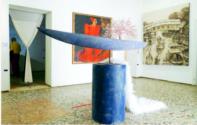
เปิดพื้นที่ส่งเสริมศิลปินไทย