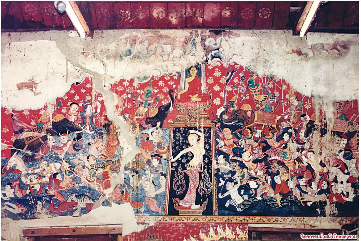
จิตรกรรมฝาผนังวัดคงคาราม