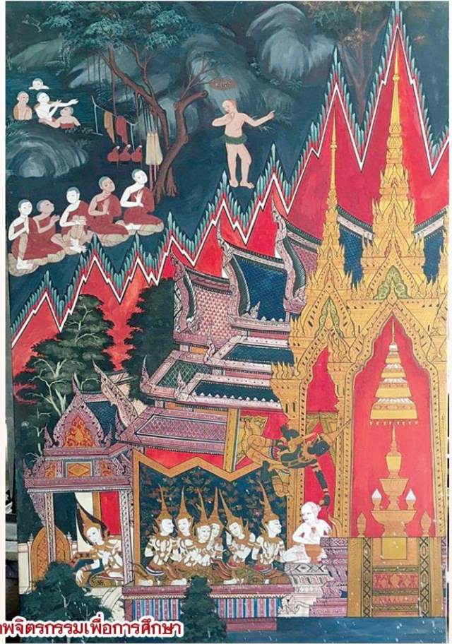
ผลงานนักศึกษาคัดลอกภาพจิตรกรรมเพื่อการศึกษา