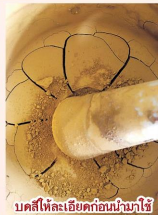
บดสีให้ละเอียดก่อนนำมาใช้