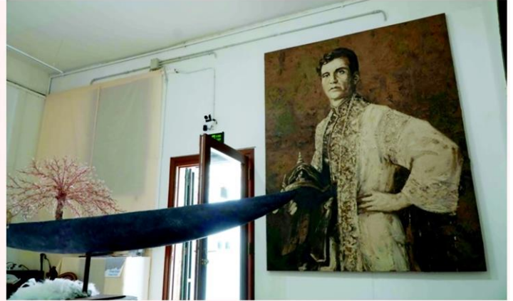
สงขลา พาวิลเลียน ศาลาไทย หนึ่งในโครงการศิลปะที่ สวธ.ส่งเสริม