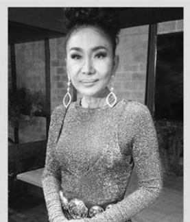
เงินเงิน บุญสูงเนิน