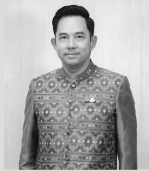
อิทธิพล คุณปลื้ม