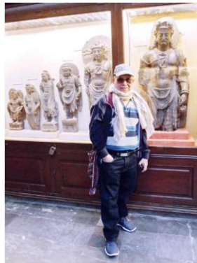
พระพุทธรูปศิลปะคันธาระ

คอลัมน์: ภูมิบ้าน ภูมิเมือง: 'ศิลปะคันธาระ' ต้นแบบพระพุทธรูปจากแม่น้ำสินธุ