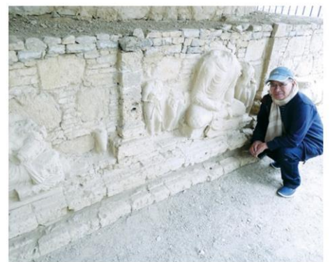
ผนังมีร่องรอยพระพุทธรูป