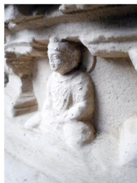
พระพุทธรูปตามสลูปลเจดีย์