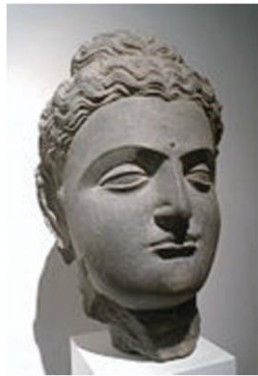
เศียรพระศิลปะคันธาระ