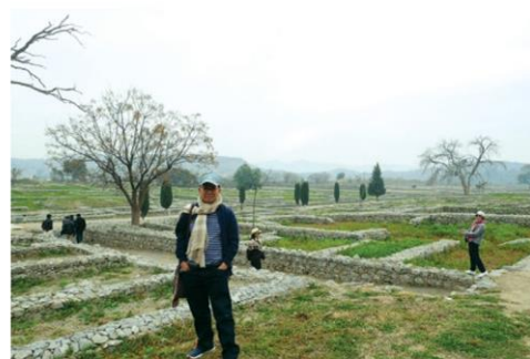
แหล่งโบราณคดีสิริกับ