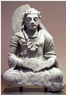
พระพุทธรูปคันธาระ