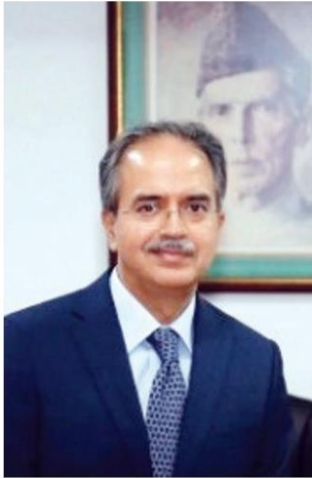
อะคิม อีพิตีร์ อะห์มัด เอกอัครราชทูต

คอลัมน์: ภูมิบ้าน ภูมิเมือง: 'ศิลปะคันธาระ' ต้นแบบพระพุทธรูปจากแม่น้ำลพบุรี