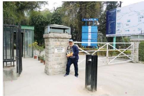
พิพิธภัณฑ์ตักศิลา

ระหว่างเทือกเขาสุโลมานติดพรมแดนของ อัฟกานิสถานและมีแม่น้ำสินธุไหลขนานข้าง เป็นดินแดนที่รับวัฒนธรรมอินเดียและผสม กับวัฒนธรรมกรีกไซเธียน ปาร์เธียน และ ภาษานะ ที่อยู่รอบคันธาระ ที่เป็นต้นเหตุให้เกิด ศิลปะแบบคันธาระ และภาษาคันธารี ถือเป็น ศูนย์กลางการศึกษาพระพุทธรูปศาสนาสมัย โบราณ ซึ่งมีการค้นพบธรรมบทภาษา คันธารีอยู่หลายแห่ง เช่น พบในเมืองไซ