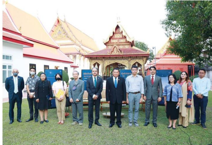
อธิบดีกรมศิลปากรกับวิทยากรร่วมเสวนา

รอยพระบาท-ธรรมจักร มาเป็นพระพุทธรูปนั้น ได้มีการสร้าง พระพุทธรูป ศิลปะคันธาระ และ พระพุทธรูปผอม หรือ พระพุทธเจ้าปาง บำเพ็ญทุกกรียา ซึ่งส่งผลให้ได้รับอิทธิพล และมีการจำลองแบบสร้างขึ้นอยู่หลายแห่งในไทย อันทำให้เกิดความสนใจใคร่รู้และหาโอกาสเดินทางไปชมแหล่งโบราณคดีสำคัญในปากีสถาน คือ แคว้นคันธาระ ตั้งอยู่ในหุบเขาเปศวาร์ ซึ่งอยู่