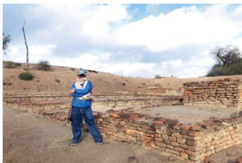
แหล่งโบราณคดีตักศิลา

อีกแห่ง คือ เมืองตักศิลา ตั้งอยู่ ทางตะวันตกเฉียงเหนือของรัฐปัญจาบ เป็น มหาวิทยาลัยและศูนย์กลางของศิลปะวิชาการ