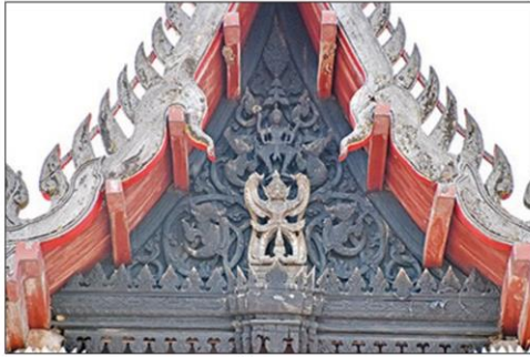
หน้าบันมีการจำหลักลายไม้อันงดงาม