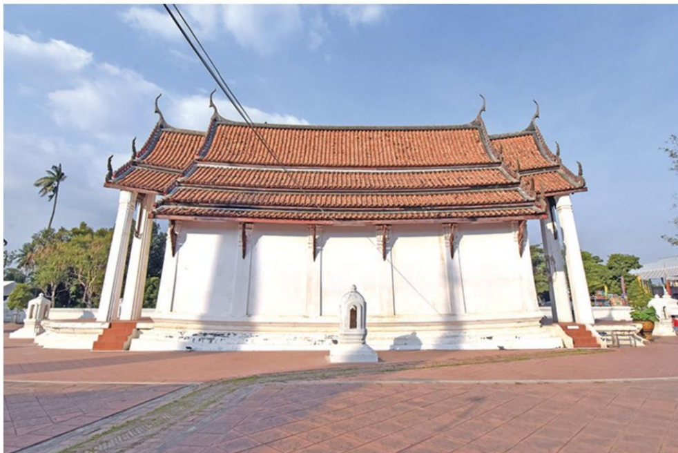
อุโบสถลักษณะคล้ายท้องเรือสำเภา

พยุหยาตราทางสถลมารค ยานมาศ ทั้งสี่ประดับ เสาตั้ง เครื่องประดับสถาปัตยกรรม และการแต่งกายต่างๆ