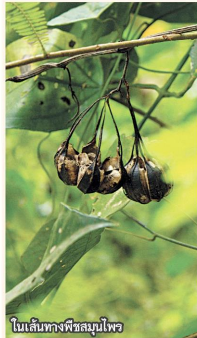
ใบเส้นทางพืชสมุนไพร

วัดเจดีย์เจ็ดแถว หนึ่งในโบราณสถานในเขตกำแพงเมือง จากข้อมูลเป็นวัดขนาดใหญ่ ภายในวัดมีเจดีย์ทรงต่าง ๆ มากมายวางตัวอย่างเป็นระเบียบแบบแผนตามคติจักรวาล จากความงามและความหลากหลาย รูปแบบของเจดีย์ในวัด สามารถแบ่งเป็นเจดีย์ทรงดอกบัวตูม โดยเจดีย์รูปแบบนี้เป็นเอกลักษณ์ของศิลปะสุโขทัย เจดีย์ทรงปราสาท เจดีย์ที่มีเรือนชั้นหรือมีชั้นหลังคาซ้อนลดหลั่นกัน มีลักษณะรูปทรงเป็นแท่งสี่เหลี่ยม มักมีการเพิ่มมุมและยกเก็จ โดยเจดีย์ทรงปราสาทที่มีรูปทรงที่หลากหลายตามแรงบันดาลใจทาง