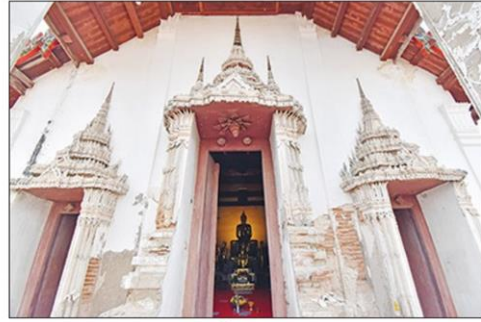
บริเวณด้านหน้าทางเข้าโบสถ์