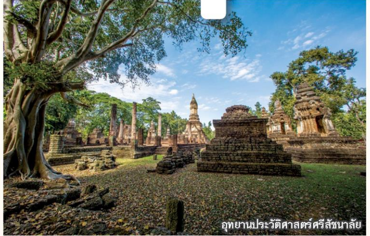
อุทยานประวัติศาสตร์ศรีสัชนาลัย

เป็นเจดีย์ที่มีอิทธิพลของศิลปะศรีวิชัย ล้านนา ส่วนเจดีย์ที่อยู่กึ่งกลางของด้านทั้ง สี่เป็นเจดีย์ทรงปราสาทแบบสุโขทัย มี ลวดลายปูนปั้นแบบอิทธิพลศิลปะลังกา บริเวณฐานโดยรอบเจดีย์ประธาน มีปูนปั้น รูปพระสาวกในท่าอัญชลีเดินประทักษิณ โดยรอบ