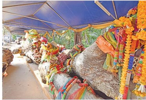
ต้นตะเคียนยักษ์อายุกว่า 1,000 ปี

เจ้าตำรับวิชาโบราณ กระสุนคต วัดถุมงคลของท่านเป็นที่ชื่อเสียงในการอยู่ยงคงกระพันพันแทงไม่เข้า มหาอุดเป็นที่ต้องการของลูกศิษย์ทั่วทั้งจังหวัดนนทบุรีและทั่วประเทศ