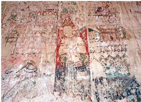
ภาพจิตรกรรมลบลือนไปมาก