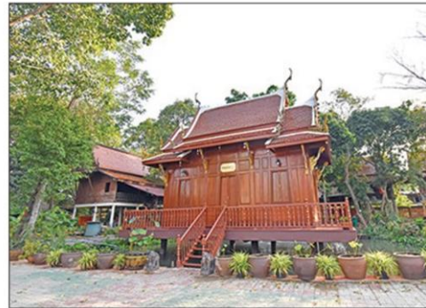
หอพระไตรปิฎกกลางน้ำ