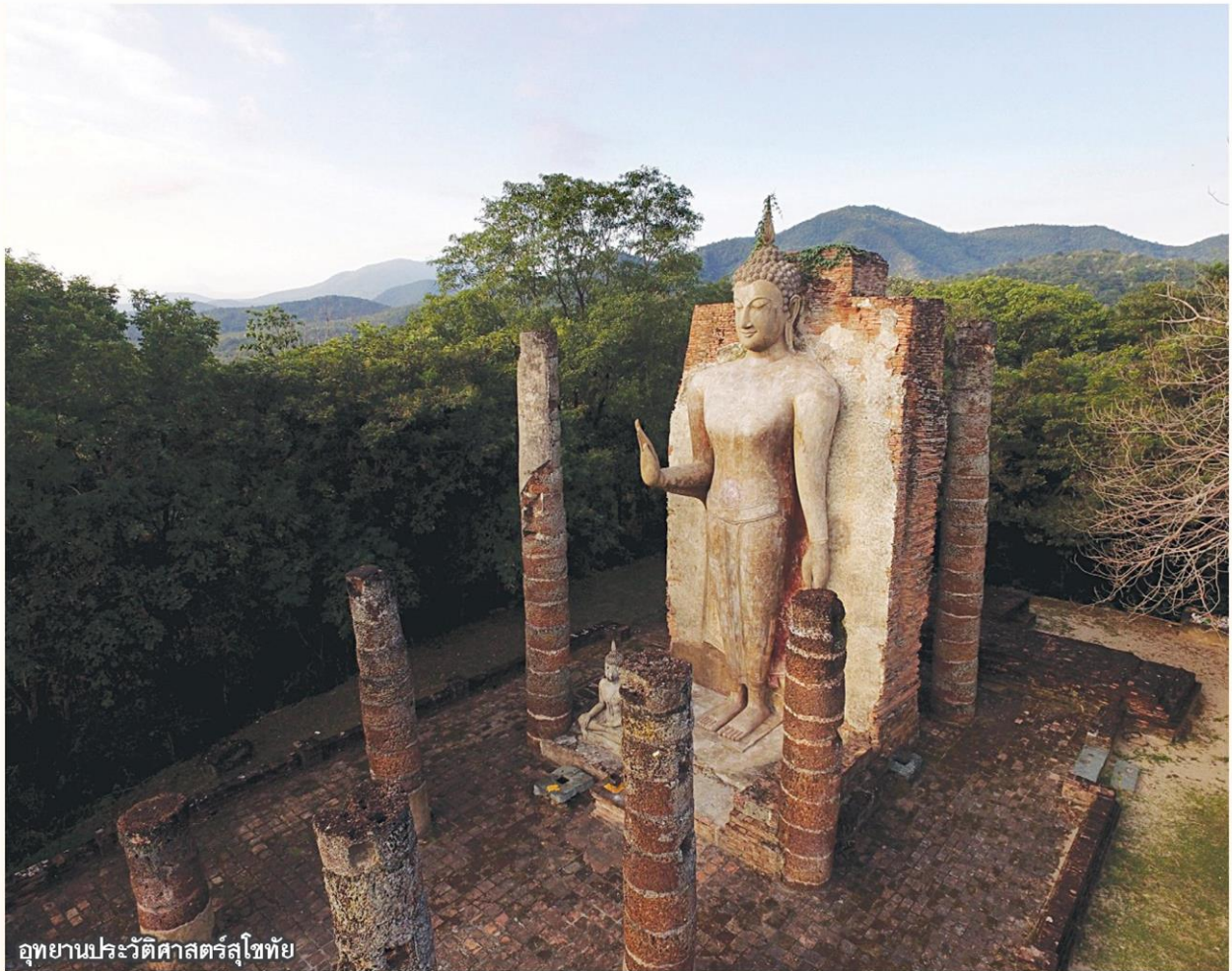
อุทยานประวัติศาสตร์สุโขทัย

ศิลปกรรมที่ได้รับจากชุมชนภายนอก ส่วน เจดีย์ทรงระฆัง มักมีวงแหวนหรือลวดบัวประดับอยู่ใต้องค์ระฆัง ส่วนยอดเป็นก้านฉัตร และปล้องโฉนทรงกรวย เป็นต้น