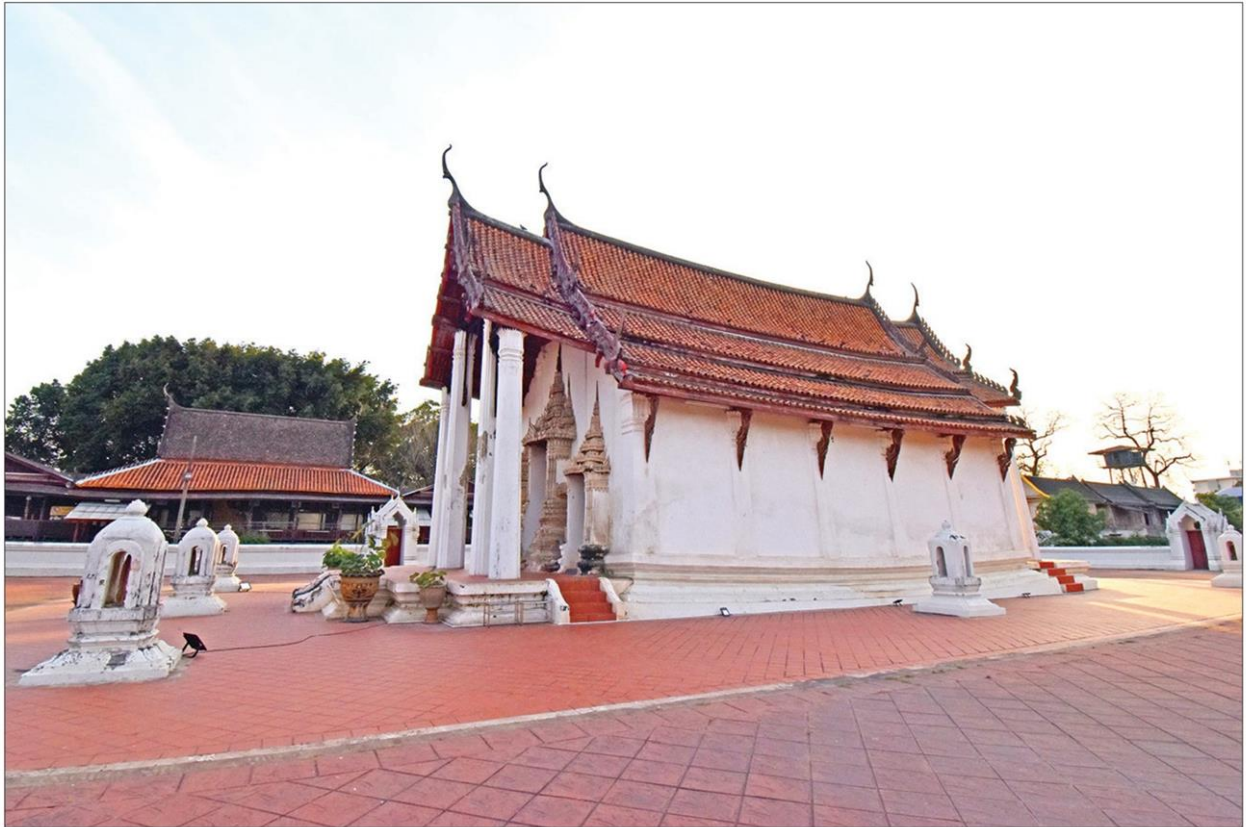
วัดปราสาท เป็นอีกหนึ่งวัดโบราณของจังหวัดนนทบุรี

หัวข้อข่าว: เทียววัดเก่าเมืองนนท์ 'วัดปราสาท' ยลโบสถ์มหาอุดอันงดงามสมัยอยุธยา