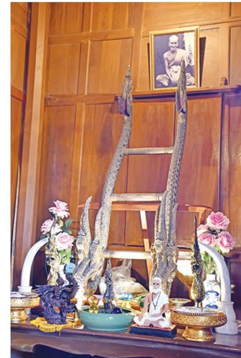
บันไดพญานาคเก่าแก่หลายร้อยปี

สำหรับภาพจิตรกรรมฝาผนัง ภายในอุโบสถมีภาพจิตรกรรมฝาผนังตอนบนสุดเขียนภาพอดีตพุทธะ ถัดลงมาเป็นวิษายาธาประนมหัตถ์ถือดอกบัว อยู่เหนือภาพเขียนเรื่องทศชาติชาดก ค้นด้วยเทวดายืนประคองอัญชลีหันหน้าเข้าหาพระประธาน ปัจจุบันตัวภาพจิตรกรรมลบลือนไปมาก แต่ยังคงเห็นเค้าภาพสะท้อนถึงวัฒนธรรม สถาปัตยกรรม อาคารบ้านเรือน รวมถึงราชประเพณีในสมัยกรุงศรีอยุธยาเป็นราชธานี อาทิ ตีราภรณ์ประดับศีรษะบุคคลสูงศักดิ์ กระบวน