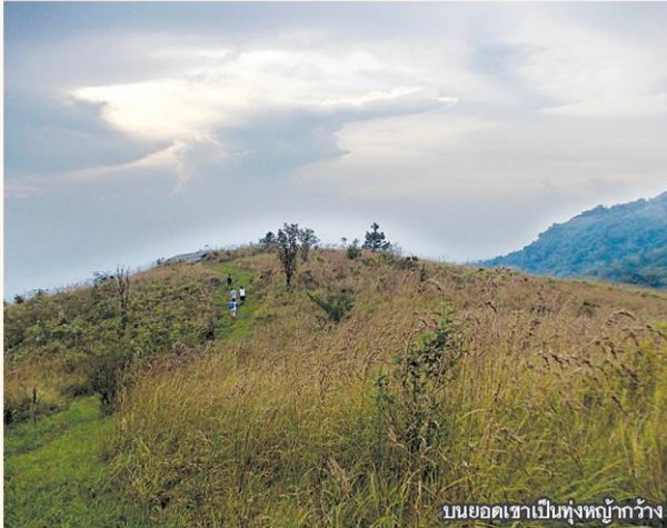
บนยอดเขาเป็นทุ่งหญ้ากว้าง