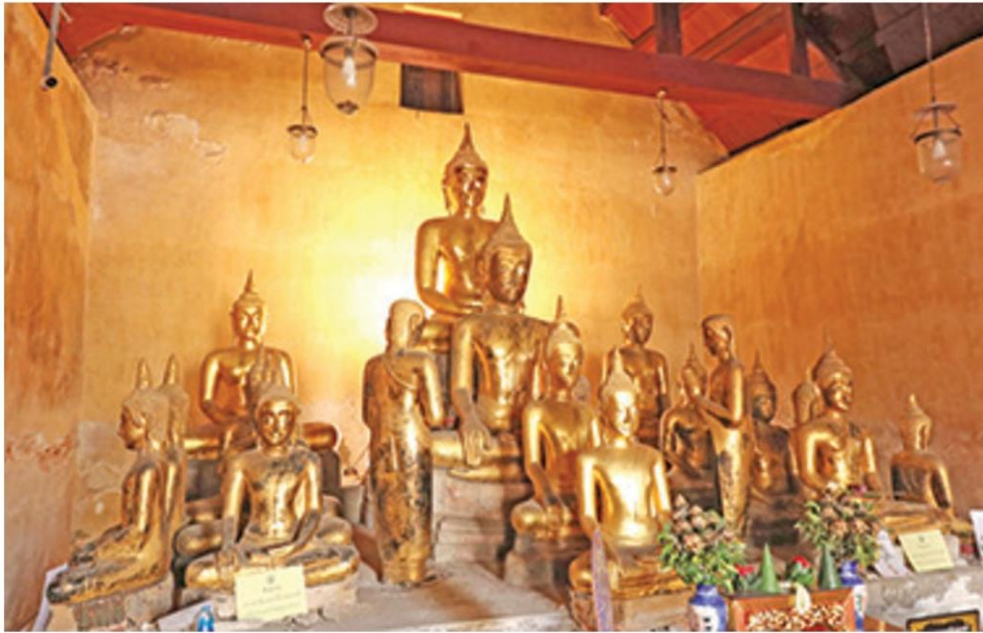
พระประธานและพระพุทธรูปจัดเป็นหมู่

หัวข้อข่าว: เทียววัดเก่าเมืองนนท์ 'วัดปราสาท' ยลโบสถ์มหาอุดอันงดงามสมัยอยุธยา