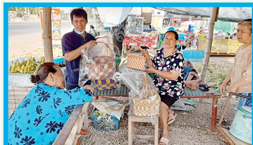
☑️ สำรวจผลิตภัณฑ์วัฒนธรรมชุมชน...เจ้าหน้าที่สำนักงานวัฒนธรรมจังหวัดกำแพงเพชรลงพื้นที่ชุมชนคุณธรรมวัดคลองพิไกร ต.คลองพิไกร และชุมชนคุณธรรมบ้านลานไผ่ ต.ห้วยซึ้ง เพื่อสำรวจและจัดทำข้อมูลผลิตภัณฑ์วัฒนธรรมชุมชนไทย (Community Cultural Product of Thailand: CC POT)