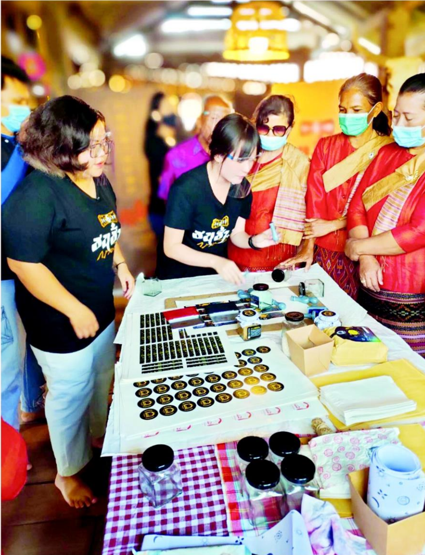
เยาวชนคนรุ่นใหม่เรียนรู้เอกลักษณ์ชุมชนสู่การออกแบบร่วมสมัย