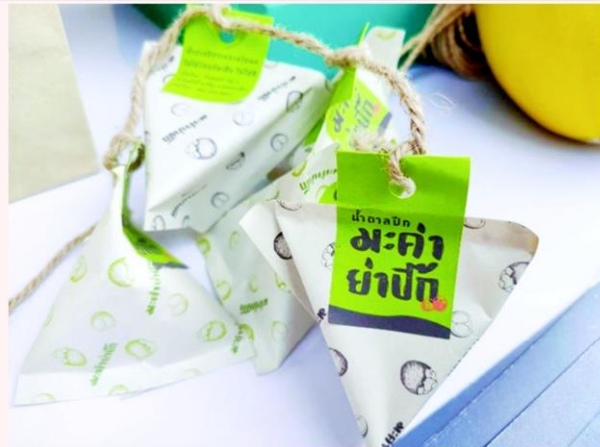
ทีมจีโป๋รูนิ จาก มทร.อีสาน ดีไซน์บรรจุภัณฑ์น้ำตาลบิกให้กับชุมชนบ้านมะค่า

“ทีมซุบเป็งทอด” จากมหาวิทยาลัยอัสสัมชัญ พัฒนาการออกแบบให้กับชุมชนบ้านโพนสูง, “ทีมจีโป๋รูนิ” จากมหาวิทยาลัยเทคโนโลยีราชมงคลธัญบุรี พัฒนาการออกแบบให้กับชุมชนท่องเที่ยว OTOP นวัตวิถีบ้านมะค่า, “ทีมแอปป์ฟัพ” จากมหาวิทยาลัยราชภัฏสงขลา พัฒนาการออกแบบให้กับชุมชนคุณธรรมบวร Ontour บ้านปังกองชัย และ “ทีมขอกจ๊กโบก” จากมหาวิทยาลัยเทคโนโลยีราชมงคลธัญบุรี พัฒนา