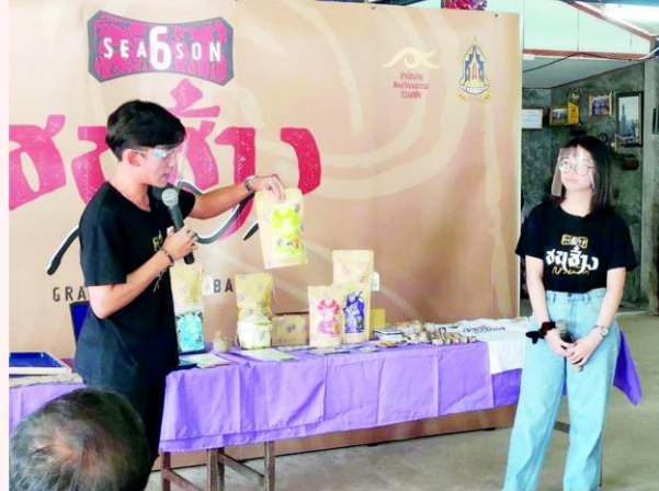
1 ใน 5 ทีมนักออกแบบรุ่นใหม่นำเสนอผลงานนำเสนอ

ม าถึงโค้งสุดท้ายของรอบตัดสิน ในโครงการพัฒนาศักยภาพนักออกแบบรุ่นใหม่ ในเวที “ชนช่างกราฟฟิกซีซั่น 6” หลังผ่านการเลือกเฟ้นอย่างเข้มข้น ปรากฏว่ามี 5 ทีมเยาวชนนักออกแบบรุ่นใหม่ผ่านเข้ารอบ