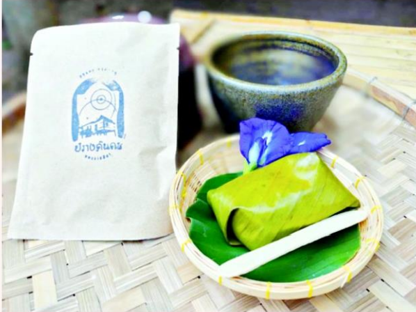
ทีม Double D ออกแบบส่งเสริมอัตลักษณ์ชุมชนบ้านปรางค์นคร