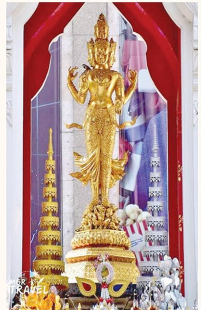
พระสทาศิวะ เซ็นทรัลเวิลด์ หรือที่คนส่วนใหญ่ นับถือเป็นพระตรีมูรติ