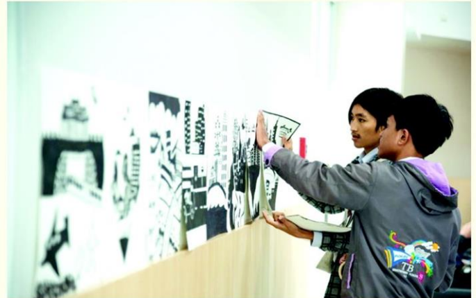
เมืองย่าโมคึกคัก จัดอบรมศิลปะให้เยาวชนคนรุ่นใหม่