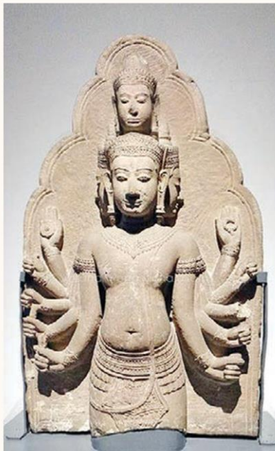
พระสทาศิวะ วัดหน้าพระเมรุ

ผมก็อยากจะมาช่วยยืนยันอีกเสียว่า โดยประวัติมานวิทยา (วิชาว่าด้วยลักษณะ ของ