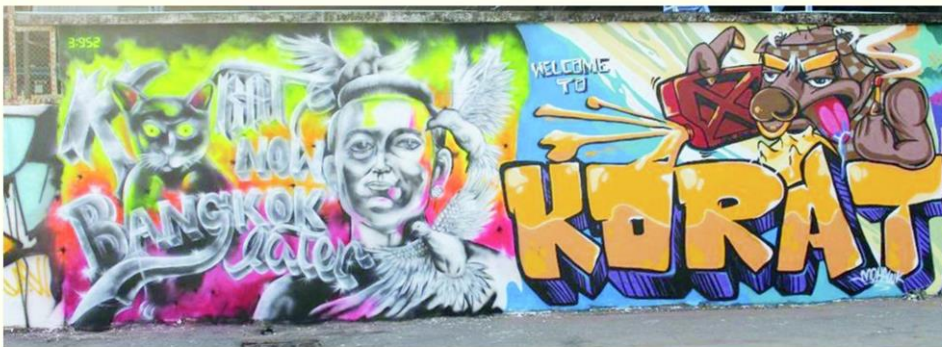
สตรีทอาร์ตในพื้นที่สาธารณะ เพิ่มความสนุกให้กับเมืองโคราช

กันเที่ยวโคราช จับจ่ายใช้สอย หรือแนะนำผู้คน มาท่องเที่ยวเทศกาลศิลปะครั้งใหญ่นี้ โคราชจะได้ก้าวสู่เมืองศิลปะและเมืองเศรษฐกิจสร้างสรรค์จริงๆ สำหรับนครราชสีมาเป็นเมืองที่ครบถ้วน ทั้งคนโคราชที่มีอัตลักษณ์ ศิลปวัฒนธรรมจำนวนมาก รวมถึงทรัพยากรธรรมชาติสมบูรณ์ ที่จะสร้างความประทับใจผู้คน