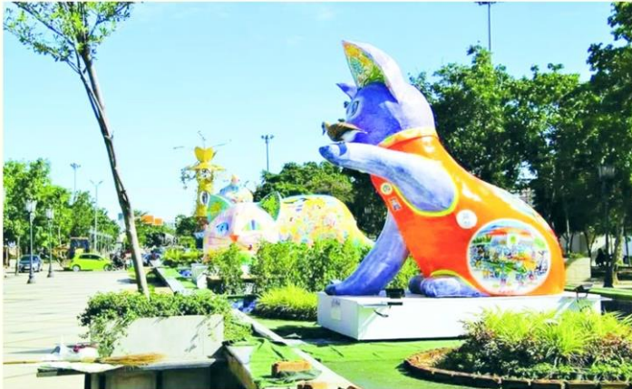
ศิลปิน "แมวมงคล" ศิลปะจัดวางเฉพาะพื้นที่ ชวนเช็กอิน