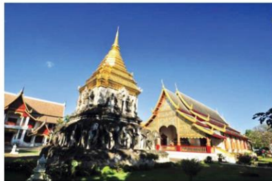
วัดเชียงมั่นในปัจจุบัน