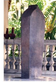
หลักจารึกหน้าโบสถ์เก่า