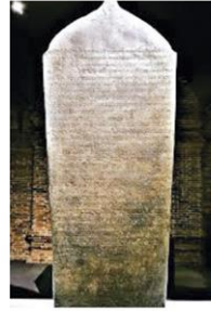
จารึกวัดเชียงมั่น