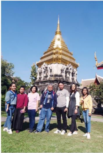
คณะเผยแผ่พรำ กรมคิลปากร

คอลัมน์: ภูมิบ้านภูมิเมือง: 'วัดเชียงใหม่' ภูมิเมืองแห่งแรกของพญามังราย