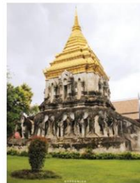
เจดีย์วัดเชียงมั่น