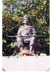
พญามังราย