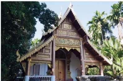
พระอุโบสถ์หลังเดิม