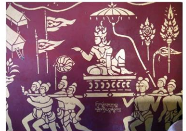
ภาพพญามังรายในวิหาร