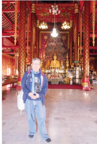
ในพระวิหารหลวง

พระองค์ ขนานนามวัดนี้ว่า วัดเชียงใหม่ ซึ่งในบริเวณ วัดนี้มีวิหาร พระอุโบสถซึ่งภายในมีพระพุทธรูป ประดิษฐานอยู่หลายองค์ สิ่งสำคัญของสถานที่นี้ คือ ศิลาจารึก ที่เรียกกันว่า “จารึกวัดเชียงใหม่” จารึกนี้ได้กล่าวถึง พญามังราย ทรงโปรดให้สร้าง เจดีย์ขึ้นในที่ประทับและสถาปนาเป็นวัด เรียกว่า วัดเชียงใหม่ ต่อมาในสมัยพญาติโลกราช ทรงโปรด ให้สร้างเจดีย์ขึ้นใหม่ เมื่อปี พ.ศ.๒๐๑๔ ความ ในพงศาวดารโยนกได้กล่าวถึงพญามังรายได้ เสด็จจากเวียงเชียงใหม่ หรือเวียงเหล็กเข้าไป ประทับในพระราชวัง ที่สร้างขึ้นใหม่ และในตำนาน พื้นเมืองเชียงใหม่ กล่าวว่า พญามังรายได้ตั้งเวียง ในชัยภูมิที่ เรียกว่า เชียงใหม่ จากหลักฐานศิลา จารึกที่ ๗๖ ศิลาจารึก วัดเชียงใหม่ พ.ศ.๑๗๗๙ ได้กล่าวถึงวัดเชียงใหม่ ว่า พญามังรายได้ทรงสร้าง ที่ประทับชั่วคราวเพื่อควบคุมการสร้างเมือง เมื่อแล้วเสร็จได้ทรงโปรดให้ก่อเจดีย์ตรง ที่หอนอนบ้านเชียงใหม่ ให้ชื่อว่าวัดเชียงใหม่ นับเป็นพระอารามหลวงแห่งแรกของเมืองเชียงใหม่ ต่อมา พ.ศ.๒๐๑๔ ในรัชสมัยพญาโลกติการาช ทรงโปรดให้สร้างเจดีย์ด้วยศิลาแลง