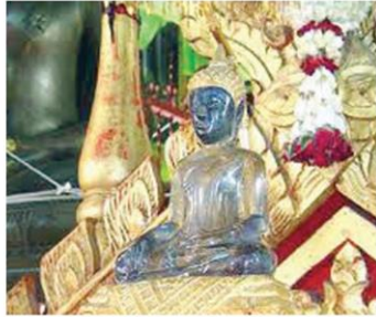
พระแก้วขาว