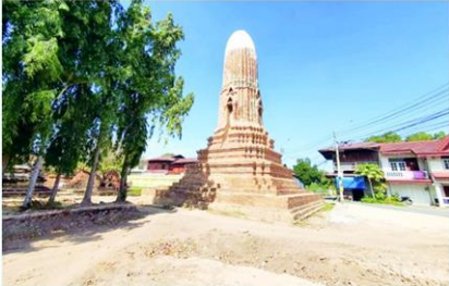
เจดีย์ทรงปราสาทยอดกลีบมะเฟือง สิ่งก่อสร้างสำคัญวัดมหาธาตุ