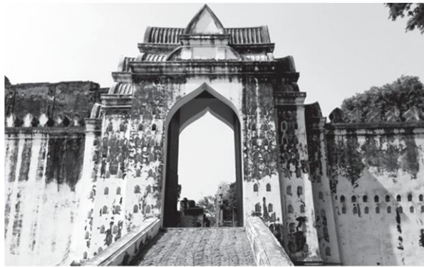
สถาปัตยกรรมประติมากรรมของโค้งแหลม สำหรับวางตะเกียงเพื่อสร้างความสว่างไสวให้แก่พระราชวังในยามค่ำคืน