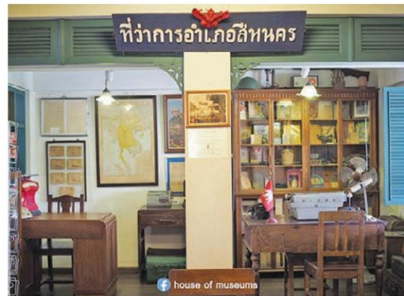
ที่ว่าการอำเภอสีหหนครยกมาไว้ที่นี่