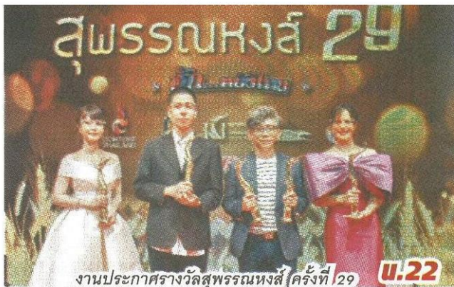
งานประกาศรางวัลสุพรรณหงส์ ครั้งที่ 29