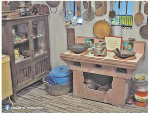
มุมครัวในอดีต