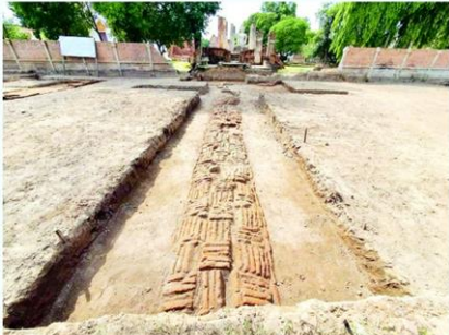
บูรณะวัดมหาธาตุสู่แหล่งท่องเที่ยววัฒนธรรมที่มีศักยภาพ