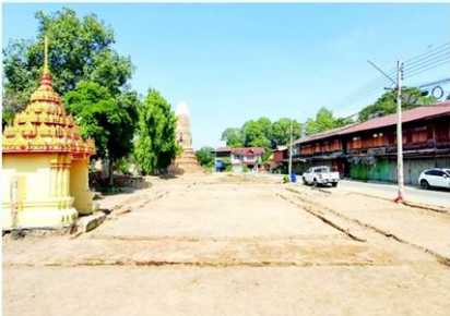
ปรับปรุงภูมิทัศน์วัดมหาธาตุตามแผนงานพัฒนา 3 ปี