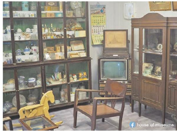
จำลองบรรยากาศบ้านเก่า

บ้านพิพิธภัณฑ์เป็นแหล่งท่องเที่ยวและศึกษาเรียนรู้วิถีชีวิตในอดีต เปิดให้บริการมากกว่า 20 ปี ผ่านร้อนผ่าน