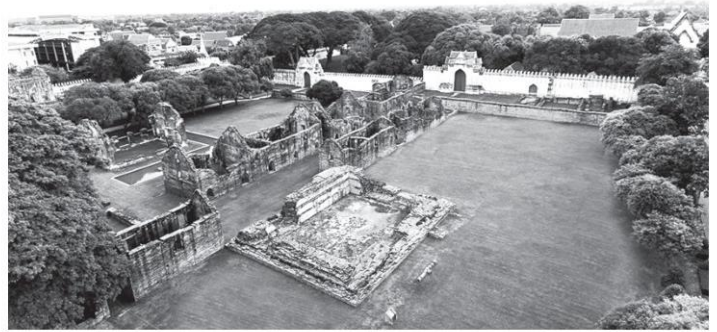
ภูมิทัศน์ พระนารายณ์ราชินีเวศน์