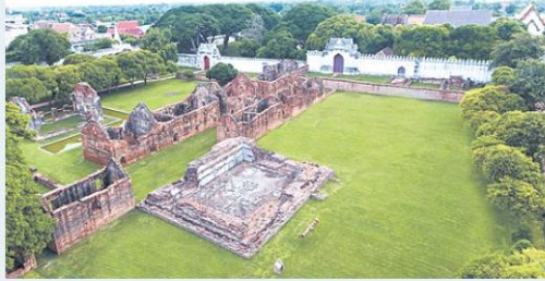
อนุรักษ์ พัฒนา พระที่นั่งสุทไธสวรรย์ วังพระนารายณ์ราชินีเวศน์ ลพบุรี >8