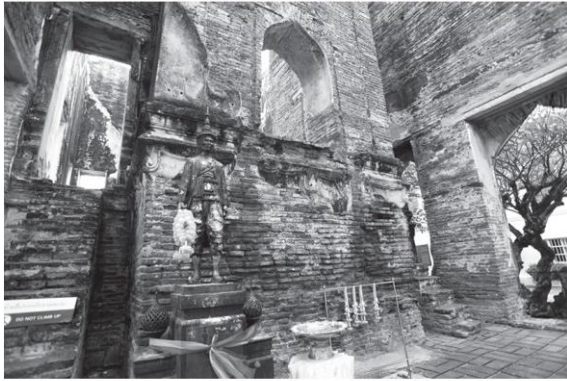
พระที่นั่งดุสิตสวรรค์ธัญญมหาปราสาท