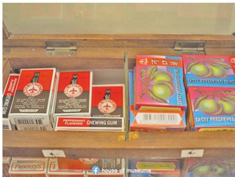
ขนมยอดฮิตในวัยเด็ก

หนาว ผ่านเหตุการณ์น้ำท่วมใหญ่ปี 2554 ที่สร้างความเสียหายแก่พิพิธภัณฑ์เป็นอย่างมากเพราะน้ำท่วมมิดหัว แม้จะมีการเตรียมพร้อมอพยพขนย้ายแต่เนิ่นๆ แต่ก็มีข้าวของเสียหายไปเป็นจำนวนมากไม่น้อย จนต้องปิดให้บริการไปเป็นปี ก่อนที่จะปรับปรุงเสร็จและเปิดให้เข้าชมได้ และต่อมาช่วงต้นปี 2563 ก็ต้องปิดชั่วคราวอีกครั้งเมื่อเจอพิษโควิด-19 และกลับมาเปิดให้บริการในวันเสาร์-อาทิตย์ ตามปกติอีกครั้งในปัจจุบัน บ้านพิพิธภัณฑ์แห่งนี้มี 3 ชั้น การจัดแสดงแบ่งออกเป็นโซนๆ จำลองรูปแบบร้านรวงตลาดเก่า ทำเป็นสไตล์ห้องแถวร้านค้าประเภทต่างๆ มีของเก่าที่เกี่ยวข้องวางอยู่ในร้าน ทำให้คนมาชมรู้สึกเหมือนได้อยู่ในบรรยากาศจริงเมื่อราวปี 2500 ไม่ว่าจะเป็นร้านของชำจันทน์ ร้านจิมินขายยา ร้านหนังสือลิขสิทธิ์ ร้านตัดผม ร้านถ่ายรูป ที่เปิดโอกาสให้ผู้เข้าชมได้สนทนากับการถ่ายรูปในบรรยากาศจริง พร้อมกับรับรู้เรื่องราวในอดีตไปพร้อมๆ กัน