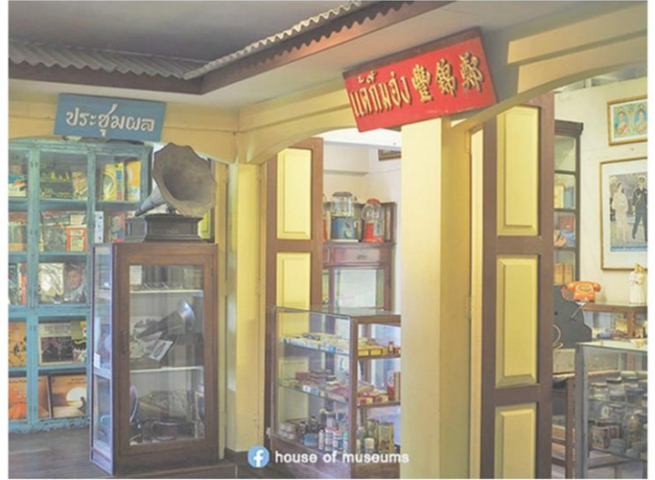
การจัดแสดงจำลองรูปแบบร้านรวงตลาดเก่า

พิพิธภัณฑ์ทั่วไป เพื่อให้มีแหล่งรับบริจาคและเก็บของ เอนก เคยโพสต์ข้อความในเฟซบุ๊กส่วนตัว ระบุถึงอดีตเมื่อครั้งยังเก็บสะสมข้าวของ และยังมิได้เปิดเป็นบ้านพิพิธภัณฑ์ว่า