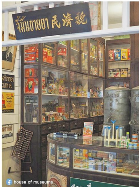
ร้านขายยาในอดีต