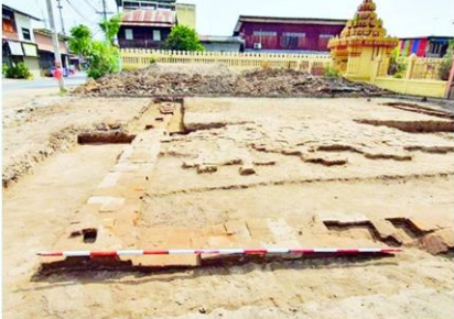
กรมศิลปากรบูรณะโบราณสถานภายในวัดมหาธาตุ