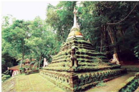
พระบรมธาตุเจดีย์