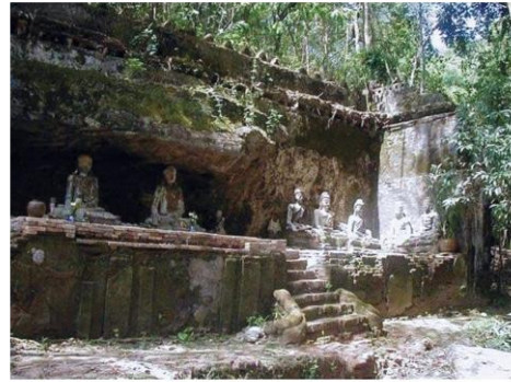
อาคารสภาพก่อนบูรณะ