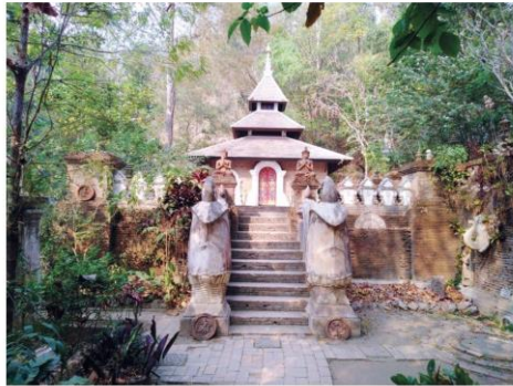
วิหารวัดผาลาด

คอลัมน์: ภูมิบ้านภูมิเมือง: 'วัดผาลาด' เส้นทางพระบรมสารีริกธาตุขึ้นดอยสุเทพ