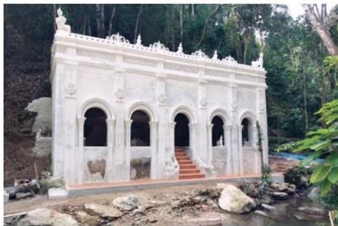
อาคารบูรณะใหม่ตามภาพเก่า