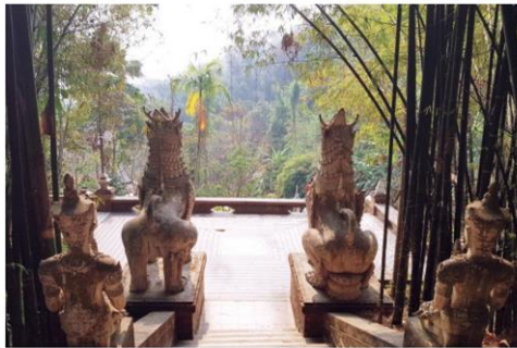
ทิวทัศน์จากบันได