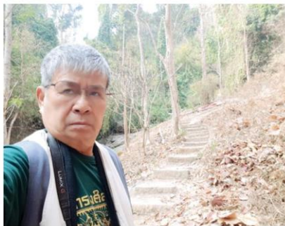
เส้นทางเก่าขึ้นดอยสุเทพ