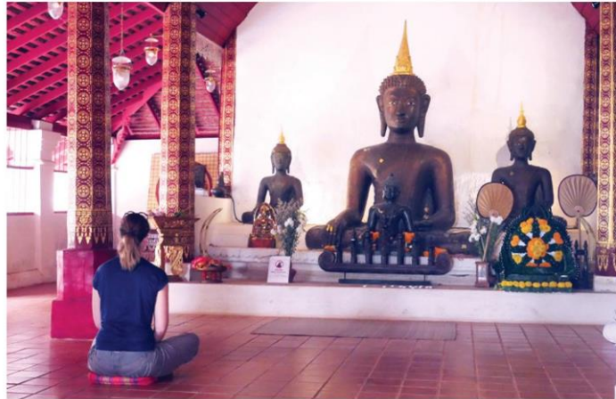
ศาลาพระเจ้ากือนาธรรมิกราช

คอลัมน์: ภูมิบ้านภูมิเมือง: 'วัดผาลาด' เส้นทางพระบรมสารีริกธาตุขึ้นดอยสุเทพ