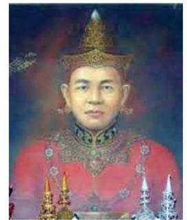
พระยาภิอนาธรรมิกราช