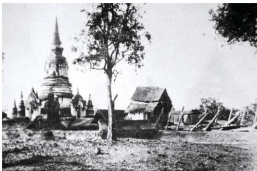
วัดสวนดอก