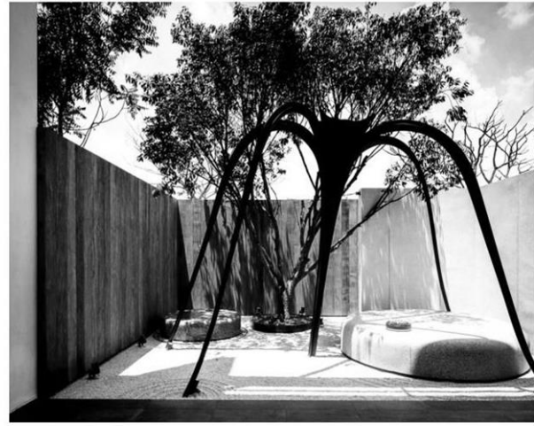
สกุล อินทกุล และผลงาน

อาหารคนแก่พืชผักในแปลง ด้านการ ออกแบบและเลือกใช้พรรณไม้ผู้ออกแบบ เน้นการปลูกแบบผสมผสาน มีทั้งไม้ยืนต้น ไม้พุ่ม ไม้ล้มลุก ไม้คลุมดิน ไม้หัว และ ไม้เลื้อย โดยไล่ระดับความสูง-ต่ำสลับกัน ถึง 6 ระดับ ตามความเหมาะสมของพื้นที่ เพื่อจำลองบรรยากาศให้เหมือนระบบ นิเวศในธรรมชาติที่อยู่ร่วมกันอย่างพึ่งพา อาศัย ที่สำคัญการปลูกต้นไม้ หลากๆ ระดับ ยังช่วยกรองอุณหภูมิความร้อนไม่ให้เข้าสู่ ตัวบ้านโดยตรงเกิดสภาวะน่าสบาย ร่มรื่น ไปด้วยแมกไม้ให้ความรู้สึกเป็นหนึ่งเดียวกับ