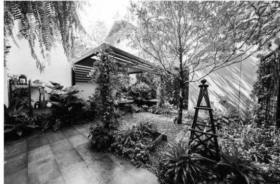
เจรมัย พิทักษ์วงศ์ กับผลงาน