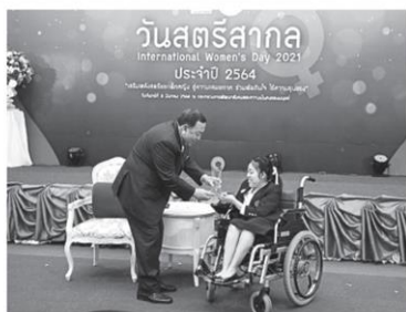
วันสตรีสากล International Women's Day 2021 ประจำปี 2564

กระทรวงการพัฒนาสังคมและความมั่นคงของมนุษย์ (พม.) โดย กรมกิจการสตรีและสถาบันครอบครัว (สค.) ได้จัดงานวันสตรีสากลเป็นประจำทุกปีเพื่อสร้างพลังใจให้กับสตรีในการร่วมพัฒนาสังคมให้เข้มแข็งอย่างยั่งยืน สำหรับปี 2564 สค. ได้ร่วมกับภาคีเครือข่ายจัดงานภายใต้แนวคิด "เสริมพลังสตรีและเด็กหญิง สู่ความเสมอภาค ร่วมตัดสินใจ ไร้ความรุนแรง" โดยสอดคล้องกับหัวข้อหลักในการประชุมของคณะกรรมการว่าด้วยสถานภาพสตรีสมัยที่ 65 รวมทั้งสอดคล้องกับเป้าหมายการพัฒนาที่ยั่งยืนเป้าหมายที่ 5 เพื่อ