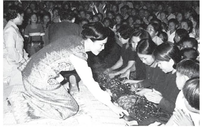
เสด็จฯ ไปทรงเยี่ยมช่างทอผ้าที่บ้านเขาเต่า อำเภอหัวหิน จังหวัดประจวบคีรีขันธ์