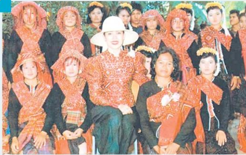
พื้นที่คนชีวิต 'ผ้าทอถิ่น' ชชาติพันธุ์ สร้างช่างทอประดุกศิลป์ของชาติ >8