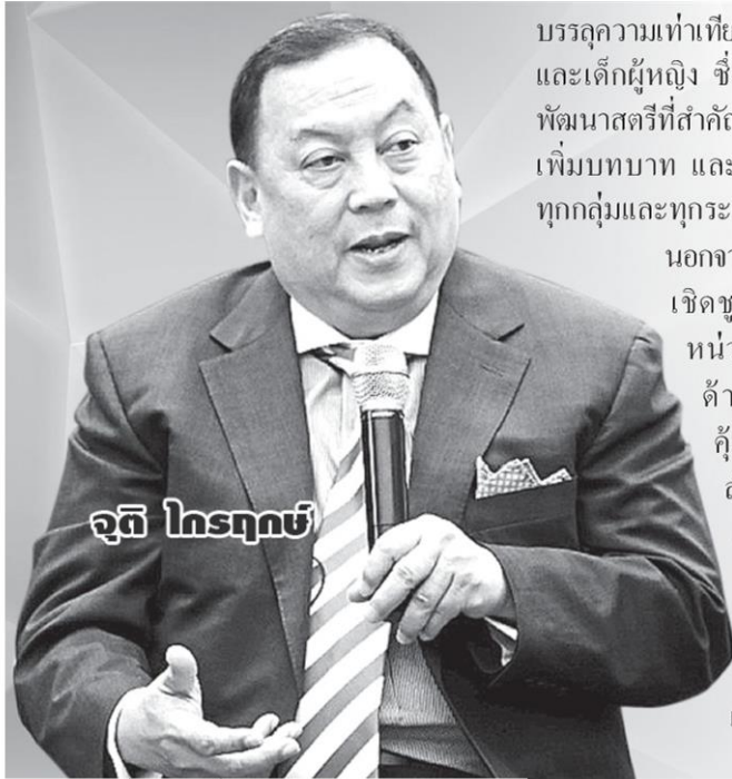
จติ โกรฤกษ์

องค์การสหประชาชาติ ประกาศให้ทุกวันที่ 8 มีนาคมของทุกปีเป็น "วันสตรีสากล"