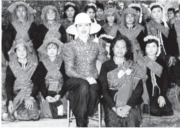
ฉลองพระองค์แพรวา ทรงฉายร่วมกับชาวภูไท บ้านโพน จังหวัดกาฬสินธุ์