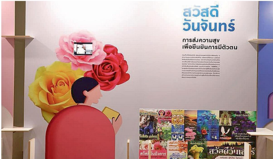
นิทรรศการที่ศูนย์มานุษยวิทยาสิรินธรฯ เมื่อปี 2562