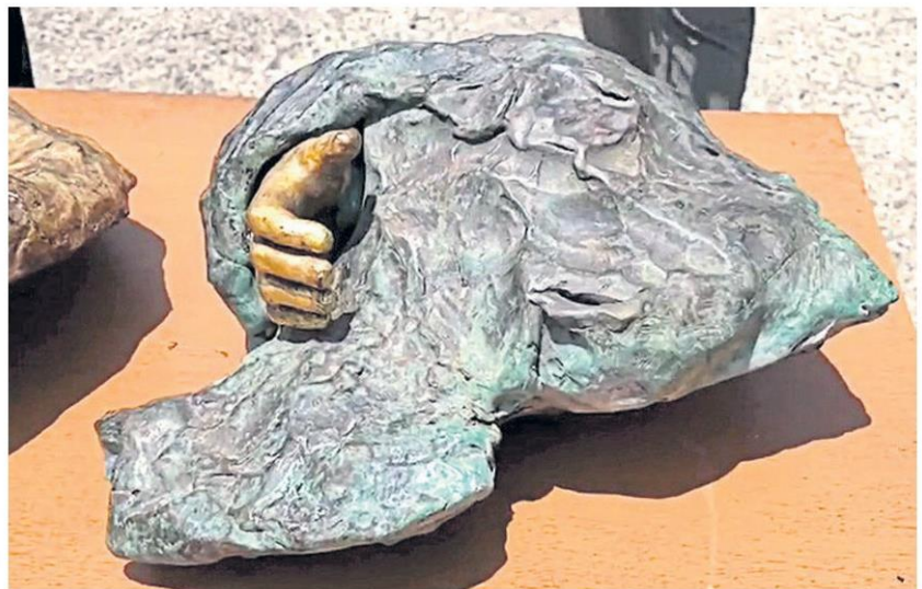
Two sculptures made by the late French artist, Louise Bourgeois, are seen at a police station in Krabi. The sculptures are part of 'Hold Me Close', an art installation displayed at Noppharat Thara Beach in tambon Ao Nang to commemorate the 2004 tsunami.

near Noppharat Thara Beach in tambon Ao Nang of Muang district to commemorate the tragedy and quickly became a tourist attraction. It was moved to the Bangkok Art and Culture Centre in 2010 amid criticism by Krabi locals, who did not want to see it go, and after its transfer to Krabi station for