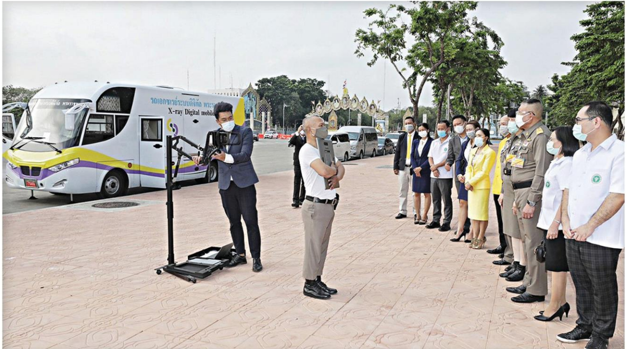
▲ พระราชทาน... จนท.สำนักพระราชวังตรวจรับรถเอกซเรย์ดิจิทัลคันแรกในประเทศไทยที่มีระบบปัญญาประดิษฐ์ (เอไอ) ทันสมัยที่สุด โดยทรงพระกรุณาโปรดเกล้าฯให้จัดสร้างขึ้นเพื่อพระราชทานใช้สนับสนุนบุคลากรทางการแพทย์ สธ. รับมือโควิด-19 ที่พระลานพระราชวังดุสิต

เป็นผู้ติดเชื้อในประเทศ 96 คน จากต่างประเทศ 4 คน รวมผู้ป่วยสะสม 27,594 ราย รักษาหายอีก 73 คน รวมรักษาหายแล้ว 26,450 ราย ยังรักษาอยู่ 1,054 คน และมีผู้เสียชีวิตเพิ่ม 1 ราย รวมเป็น 90 ศพ สำหรับสถานการณ์ทั่วโลกมีผู้ป่วยรวม 122,366,215 ราย เสียชีวิต 2,703,176 ศพ สหรัฐติดเชื้อสูงสุด 30,358,880 กรณีผู้เสียชีวิตรายที่ 90 เป็นหญิงไทยอายุ 53 ปี อาชีพพนักงานบริษัทอาศัยอยู่ท.จ.สมุทรสาคร มีโรคประจำตัวคือเบาหวาน กล้ามเนื้อหัวใจตาย ปอดอักเสบ