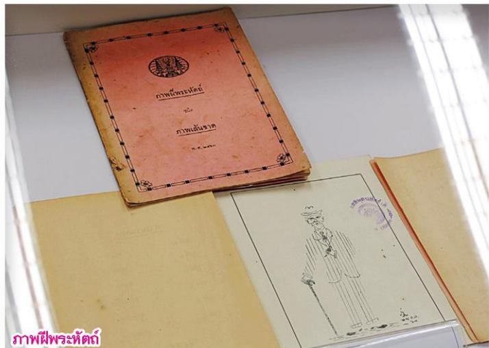
ภาพฝีพระหัตถ์

ภาพฝีพระหัตถ์ส่วนมากนำลงตีพิมพ์ใน หนังสือพิมพ์ดุสิตสมิต และจากการที่พระองค์ทรงโปรดการวาดภาพจึงทรงส่งเสริมการวาดภาพล้อเลียนอย่างจริงจัง ทำให้การภาพวาดล้อเลียนเป็นที่นิยมแพร่หลายกันอย่างกว้างขวาง หนังสือพิมพ์ในสมัยรัชกาลพระบาทสมเด็จพระมงกุฎเกล้าเจ้าอยู่หัวเริ่ม