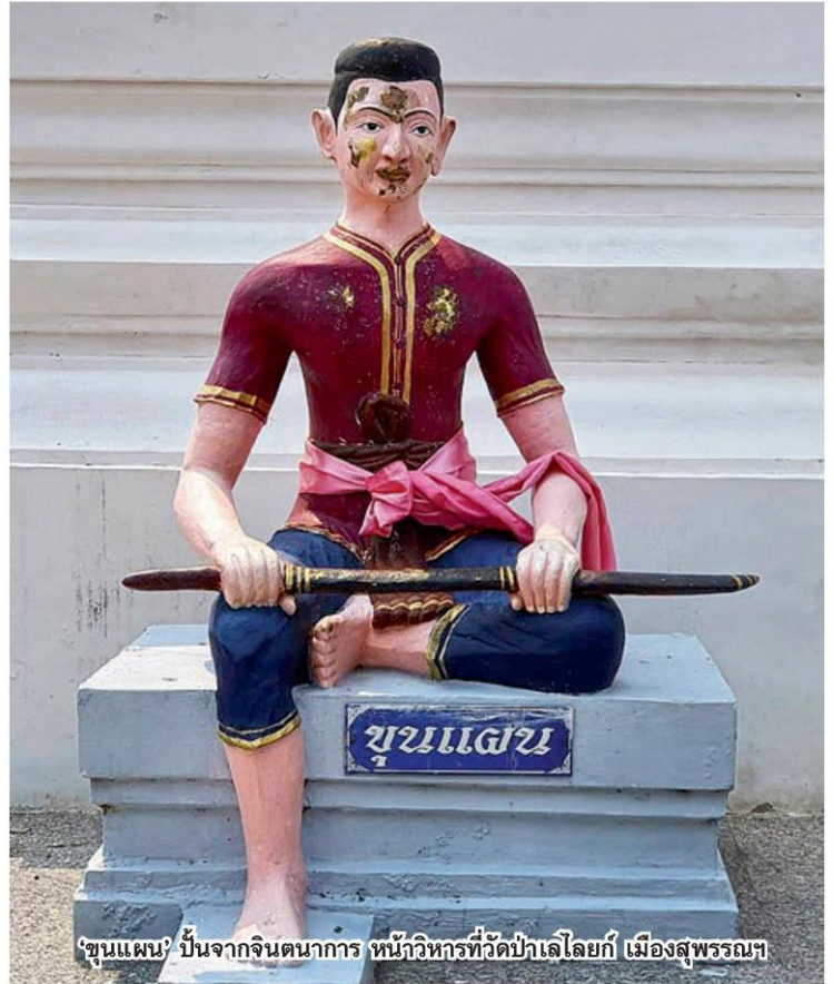
'ขุนแผน' ป็นจากจินตนาการ หน้าวิหารที่วัดป่าเลไลยก์ เมืองสุพรรณฯ