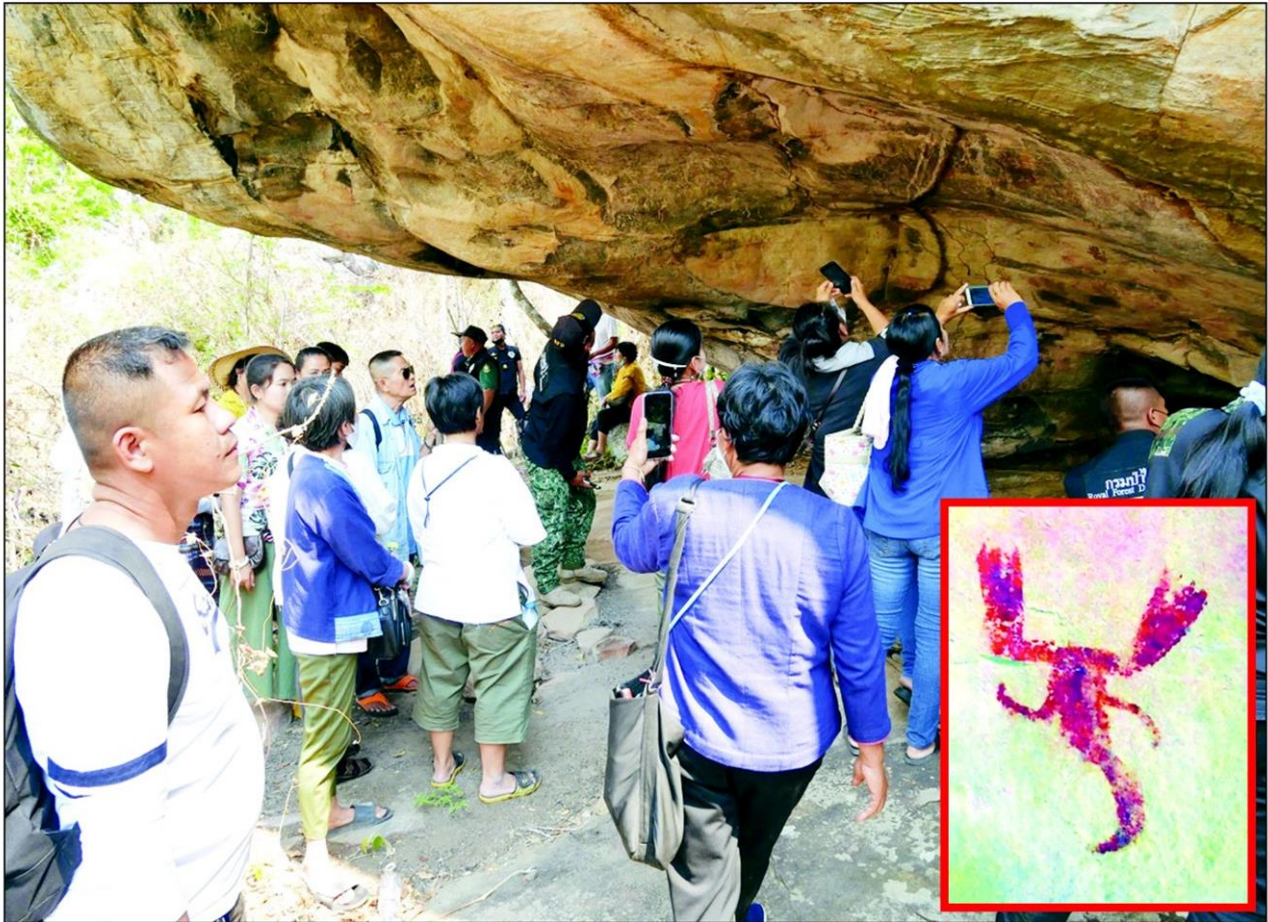
สำนักศิลปากรที่ 8 ขอนแก่น สำรวจศิลปะถ้ำในพื้นที่ภูเก้า ภูพานคำ และภูเวียง พบแหล่งภาพเขียนสีโบราณ 25 แห่งใหม่ ประชาชนสนใจ