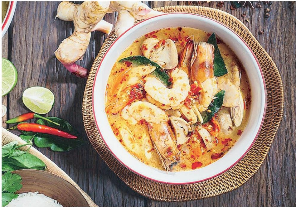
▲ มรดกวัฒนธรรม คณะกรรมการส่งเสริมและรักษามรดกภูมิปัญญาทางวัฒนธรรม กรมส่งเสริมวัฒนธรรมเตรียมเสนออาหารไทย “ต้มยำกุ้ง” ต่อยูเนสโกพิจารณาขึ้นทะเบียนตัวแทนมรดกวัฒนธรรมที่จับต้องไม่ได้ของมนุษยชาติ ปี 64.

ดังนั้น กุ้งแม่น้ำซึ่งมีอย่างอุดมสมบูรณ์และลอยขึ้นมาให้จับง่ายในบางฤดูกาล จึงเหมาะใช้ทำอาหาร นอกจากนี้ ยังสะท้อนเรื่องวัฒนธรรมการบริโภค คนในครอบครัวไทยจะล้อมวงรับประทานอาหารพร้อมหน้าแสดงถึงความผูกพันใกล้ชิดกันในครอบครัว 3. ความรู้และการปฏิบัติเกี่ยวกับธรรมชาติและจักรวาล ต้มยำกุ้งถือเป็นอาหารเพื่อสุขภาพ เพราะมีไขมันต่ำ และมีสรรพคุณจากเครื่องสมุนไพรช่วยบำรุงร่างกาย ปรับธาตุให้สมดุล โดยเฉพาะอย่างยิ่งในช่วงเปลี่ยนฤดูกาล (ปลายฝนต้นหนาว) จะช่วยป้องกันและบรรเทาอาการหวัดได้อีกทั้งในช่วงเวลาดังกล่าว ยังเป็นช่วงฤดูที่กุ้งมีชุกชุมในธรรมชาติ จึงสะท้อนถึงภูมิปัญญาของคนสมัยก่อนเรื่องการรับประทานอาหารตามฤดูกาลและเรื่องวงจรชีวิตของกุ้งแม่น้ำด้วย