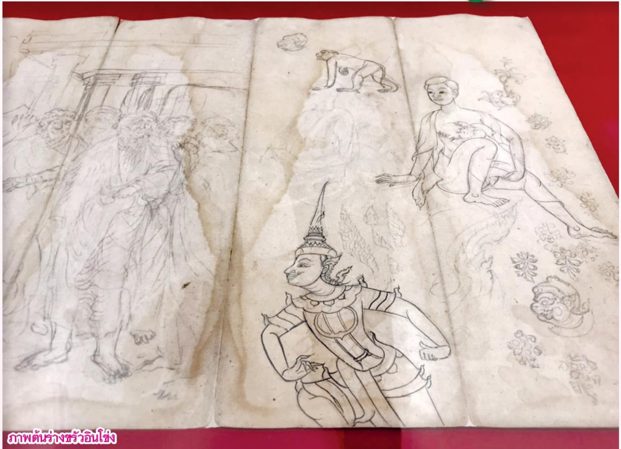
ภาพต้นร่างชรัวอินโข่ง

แบบในการวาดภาพ ในช่วงนี้รูปแบบจิตรกรรมไทยมีลักษณะแบบราบเปลี่ยนไปเป็นภาพที่มีมิติและแสงเงาจนเป็นที่ยกย่องว่า ชรัวอินโข่งเป็นจิตรกรล้ำสมัย