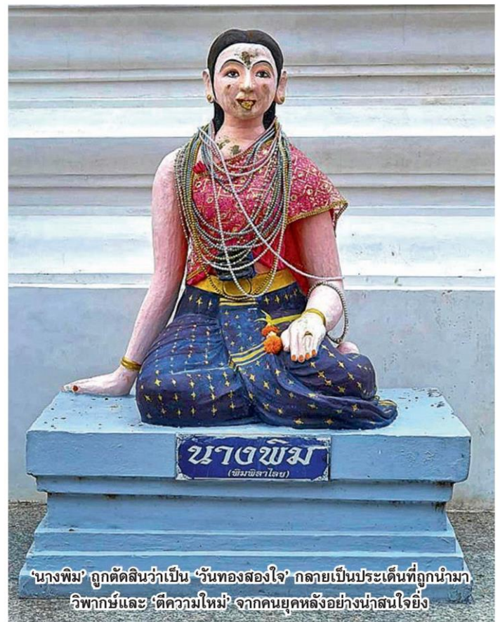
'นางพิม' ถูกตัดสินว่าเป็น 'วันทองสองใจ' กลายเป็นประเด็นที่ถูกนำมาวิพากษ์และ 'ตีความใหม่' จากคนยุคหลังอย่างน่าสนใจ