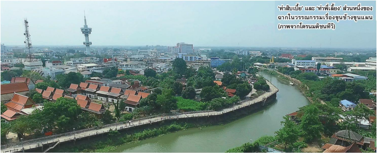
‘ทำลิบเบี่ย’ และ ‘ทำพีเลียง’ ส่วนหนึ่งของฉากในวรรณกรรมเรื่องขุนช้างขุนแผน

หัวข้อข่าว: ขุนช้าง ขุนแผนพญาแถน และผีบรรพชน