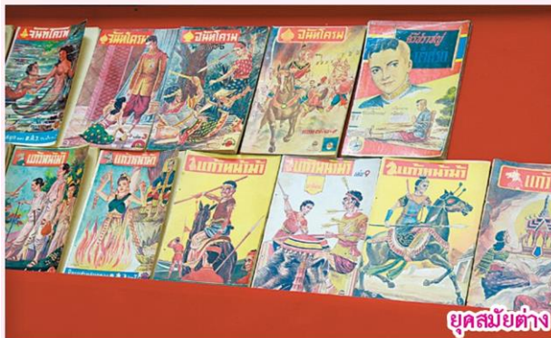
ยุคสมัยต่าง ๆ ของการ์ตูน