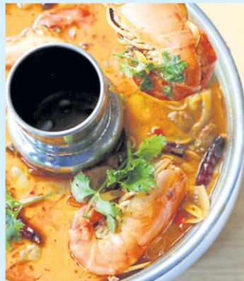
A fire pot of Thailand's most famous soup, tom yum kung. M2F