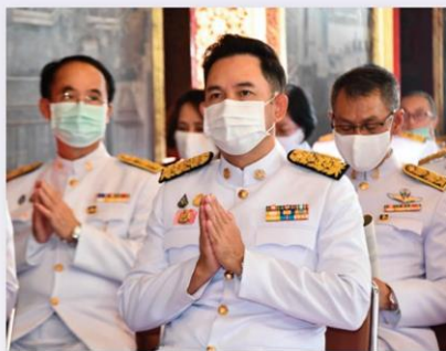
นายอิทธิพล คุณปลื้ม รัฐมนตรีว่าการกระทรวงวัฒนธรรม

เนื่องในโอกาสวันคล้ายวันพระราชสมภพ ๒ เมษายน ๒๕๖๔ นับเป็นโอกาสอันดียิ่ง ที่พสกนิกรชาวไทยทุกหมู่เหล่า จะได้ แสดงออกถึงความจงรักภักดี ด้วยการ บำเพ็ญคุณงามความดีถวายพระราชกุศล แด่สมเด็จพระกนิษฐาธิราชเจ้า กรมสมเด็จพระเทพรัตนราชสุดาฯ สยามบรมราชกุมารี ที่ทรงสร้างคุณประโยชน์แก่ประเทศชาติ อย่างอเนกอนันต์ ในการนี้ กรมการศาสนา กระทรวงวัฒนธรรม ในฐานะหน่วยงานของ