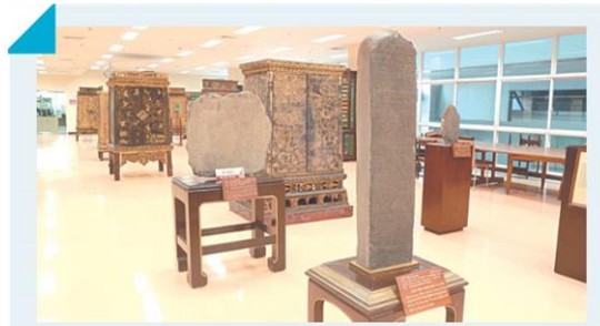
'กรมสมเด็จพระเทพรัตนราชสุดาฯ' พระมหากษัตริย์คุณ ต่อกิจการหอสมุดแห่งชาติ ▶8