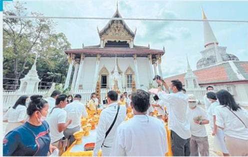
บูรณะพระวิหารหลวง วัดพระมหาธาตุวรมหาวิหาร ▶8