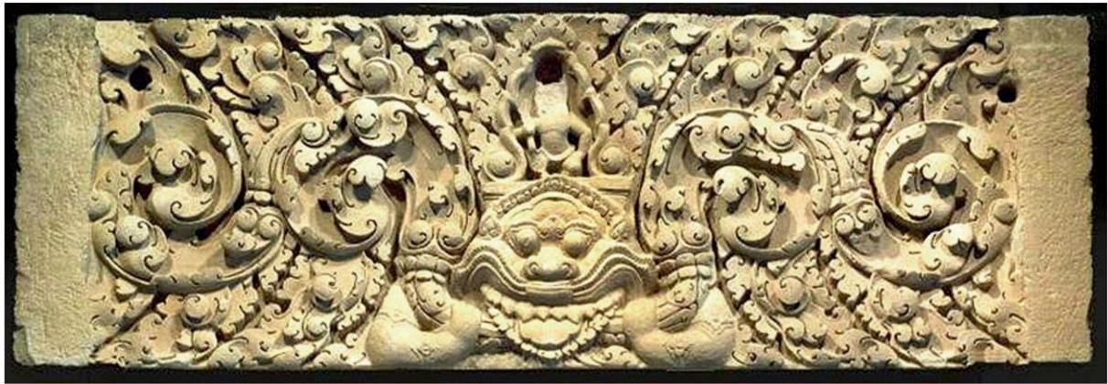
ภาพถ่ายทับหลังปราสาทเขาโล้นในเว็บไซต์ พิพิธภัณฑ์ของ มุน ลี สหรัฐ ที่ภาคประชาชนค้นเจอ นำไปสู่การทวงคืน

หัวข้อข่าว: ทับหลัง'หนองหงส์'-เขาโล้น'ได้กลับไทย ต้องให้เครดิต'ภาคประชาชน'