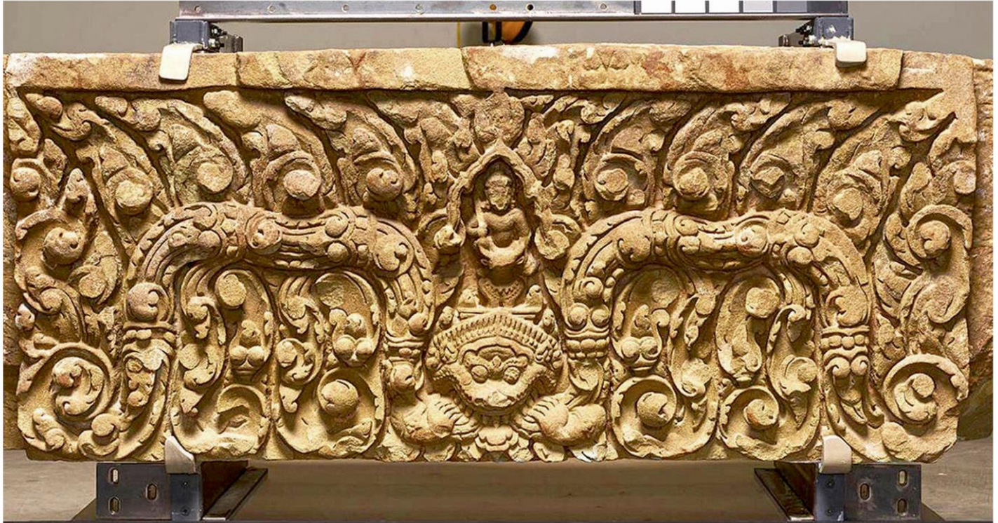
ทับหลังปราสาทหนองหงส์ อ.โนนดินแดง จ.บุรีรัมย์ ในสหรัฐ เตรียมตัวกลับไทยต้นเดือนพฤษภาคมนี้