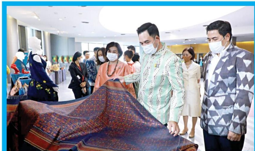
☑ ผ้าไทยสวมใส่ได้จริง...อิทธิพล คุณปลื้ม รมว.วัฒนธรรม เป็นประธานแถลงข่าว โครงการผ้าไทยสวมใส่ได้จริง “พลิ้ว” พร้อมเยี่ยมชมบูธสินค้าผลิตภัณฑ์ CPOT โดยมี ยูพา ทวีวัฒนะกิจบวร ปลัดกระทรวงวัฒนธรรม ร่วมงาน ที่สตูดิโอ 5 สถานีโทรทัศน์ช่อง 9 MCOT HD