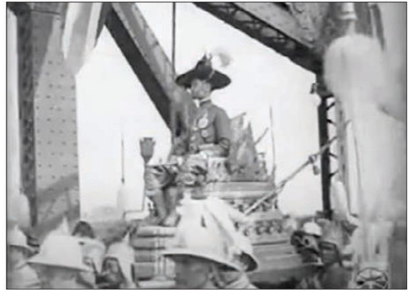
พระบาทสมเด็จพระปกเกล้าฯทรงพระที่นั่งทอดานทองเสด็จข้ามสะพานพุทธฯ

อัญมณีเหล่านี้ ประเทศในเอเชียต่างนับถือตรงกันมาแต่ครั้งบูรพกาลว่าเป็นอัญมณีแห่งสิริมงคล นอกจากใช้ประดับตกแต่งกายแล้ว ยังเชื่อว่าเป็นเครื่องรางของขลังด้วย และมีคุณสมบัตินทางมงคลแตกต่างกันไปดังนี้