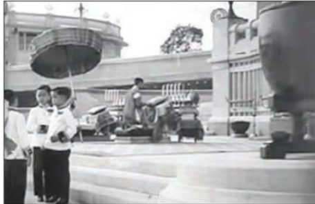
ขณะ ร. ๗ ถวายบังคมพระบรมรูป ร.๑ ร.๘ และ ร. ๙ พระชนม์ ๗ และ ๕ ชันษา ประทับอยู่ที่มุมภาพด้านซ้าย