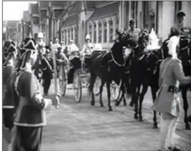
พระบาทสมเด็จพระปกเกล้าเจ้าอยู่หัวเสด็จโดยขบวนรถม้าไปประกอบพระราชพิธีที่ห้องสนามหลวง