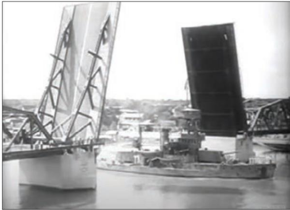
เปิดสะพานพุทธฯให้ขบวนเรือรบบผ่านตัดสายลิวจัน