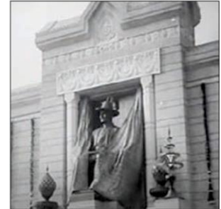
วินาทีแรกที่พระวิสุตรคดมพระบรมรูป ร.๑ เปิดดอก ในพิธีเฉลิมฉลองกรุงเทพมหานคร ๑๕๐ ปี