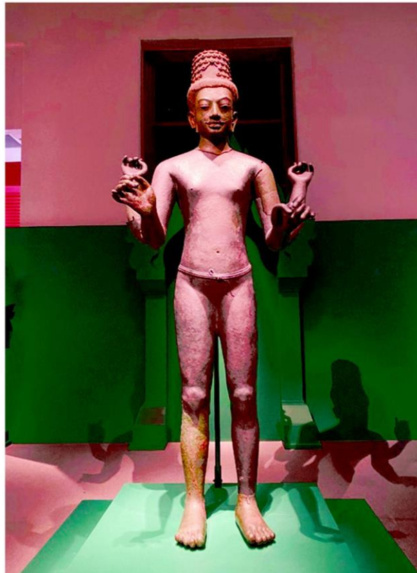
พระโพธิสัตว์สำริดจากบ้านโตนด อ.โนนสูง จ.นครราชสีมา อายุราว พ.ศ.1200-1350 ที่กรมศิลปากรนำชิ้นส่วนต่างๆ ที่พบมาเชื่อมต่อแล้วจัดแสดงเป็นครั้งแรกในนิทรรศการอารยธรรมวิวัฒน์ ลพบุรี-ศรีรามเทพนคร

อ ย่างไรก็ตาม สิ่งที่นิทรรศการนำมาจัดแสดง นั้น กลับไม่ได้ช่วยให้ผู้ชมสามารถได้รับความรู้เรื่องเกี่ยวกับ “ศรีรามเทพนคร” ซึ่งดูจะเป็นประเด็นสำคัญของการจัดแสดงนิทรรศการมากเท่าที่ควรจะเป็น