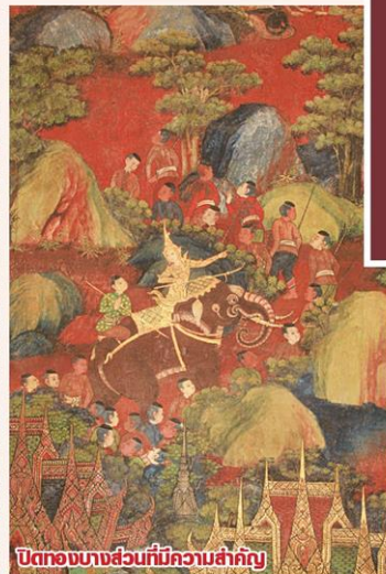
บิตของบางส่วนที่มีความสำคัญ