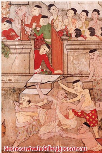
จิตรกรรมฝาผนังวัดใหญ่สุวรรณาราม