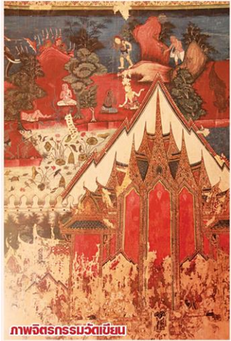
ภาพจิตรกรรมวัดเขียน