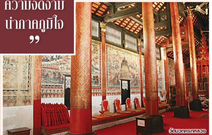
วัดบวรนิเวศราชวรวิหาร

กับภาคใต้ มีหลายสถานที่สำคัญ โดยที่ถูก หยิบนำมาศึกษาคือ จิตรกรรมฝาผนังที่ วัด มัชฌิมาวาส จังหวัดสงขลา