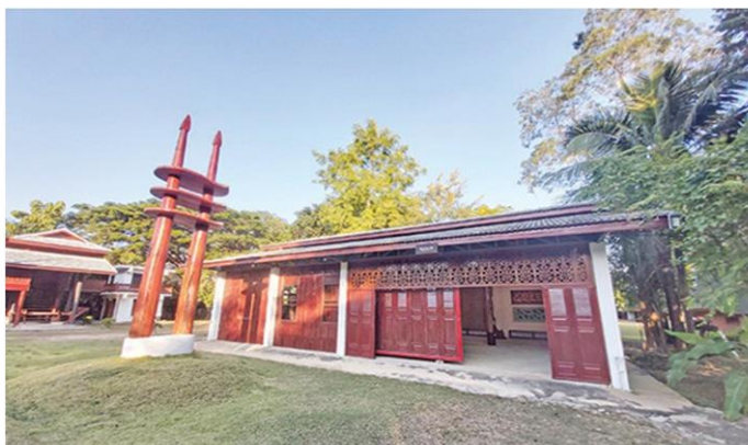
อาคารจัดแสดงผลงานศิลปะ