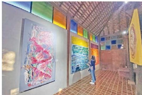
ผลงานจิตรกรรม