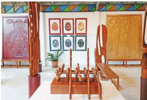
ผลงานแกะสลักไม้และงานภาพพิมพ์