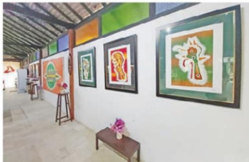
จิบกาแฟพร้อมชมผลงานชิ้นเยี่ยม

รูปแบบของหอศิลป์ อุทยานธรรมะนี้ สร้างเป็นอาคารหลายหลังกระจายกันอยู่ในพื้นที่ อาคารแต่ละหลังเก็บผลงานเป็นหมวดหมู่ ไม่ว่าจะเป็นด้านประติมากรรม ภาพพิมพ์ วาดเส้น จิตรกรรม อาทิ บ้านป่าไช้ บ้านไม้สักเก่าแก่ที่รื้อย้ายมาจากในเมือง เป็นหลังที่มีผลงานชิ้นโดดเด่นมากมาย ไม่ว่าจะเป็นงานชิ้น