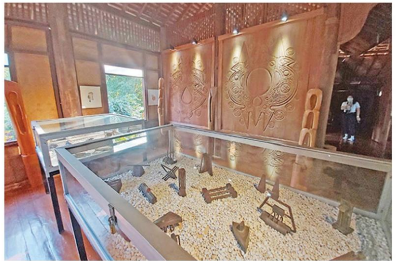
ภายใน "บ้านบัวโฮ" ที่เก็บผลงานประติมากรรมต่างๆ ไว้