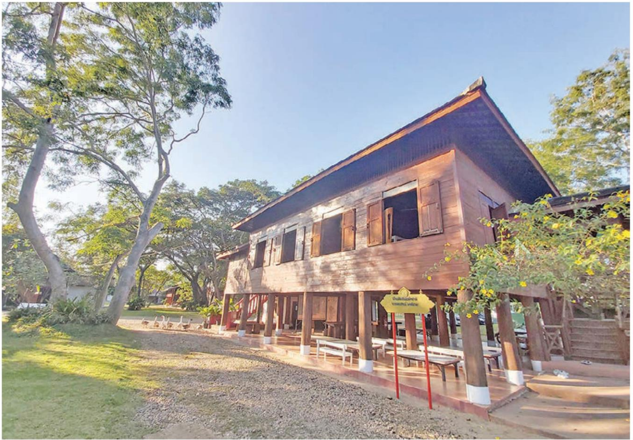
หอศิลป์ อุทยานธรรมชาติ ของศิลปินแห่งชาติ อินสนธิ วงศ์สาม

หากเพียงรายชื่อ “บ้านดำ” เป็นแหล่งท่องเที่ยว และชมงานศิลป์ของศิลปินแห่งชาติรุ่นใหญ่อย่างถวัลย์ ดัชนี ผู้ล่วงลับ