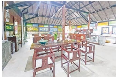
ร้านกาแฟในบรรยากาศที่รายล้อมด้วยงานศิลป์