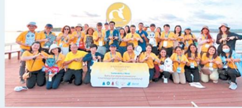
CEO ตามรอยพระราชาร่วมสืบสาน รักษา ต่อยอด สู่การพัฒนาที่ยั่งยืน