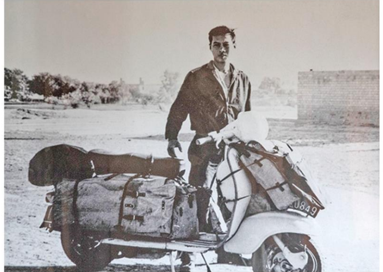
ภาพเมื่อครั้งเดินทางข้ามโลกด้วยมอเตอร์ไซค์สกูตเตอร์ Lambretta

จะเล่าเรื่องราวเกี่ยวกับมลพิษในทะเลของนิวยอร์ก รวมถึงสร้างเป็นแนวปะการังเทียมเพื่อฟื้นฟูทะเล แต่โครงการดังกล่าวไม่ได้รับการสนับสนุนทุนให้ทำต่อ เขารู้สึกผิดหวังและเครียด และทำให้ตัดสินใจกลับบ้านเกิด จบการเดินทางอันยาวนานในต่างแดน