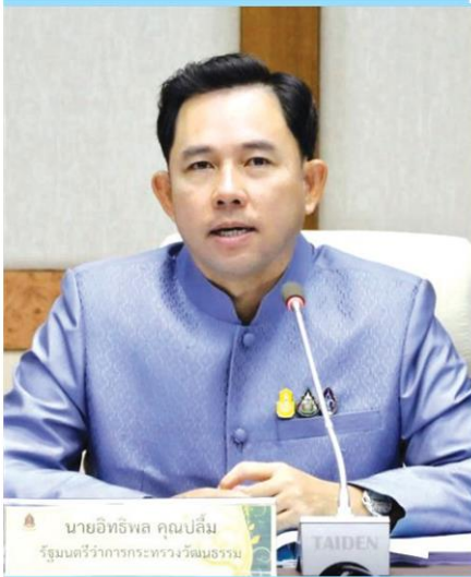
> อิทธิพล คุณปลื้ม

นายอิทธิพล คุณปลื้ม รัฐมนตรีว่าการกระทรวงวัฒนธรรม (รมว.วธ.) เปิดเผยว่า ตามที่มีข่าวว่า มีบุคลากรในวงการภาพยนตร์และโทรทัศน์ในประเทศไทยติดเชื้อไวรัสโคโรนา 2019 (โควิด-19) อย่างต่อเนื่องในการระบาดของโควิด-19