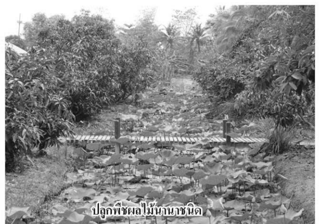
ปลูกพืชผลไม้มานานชนิด