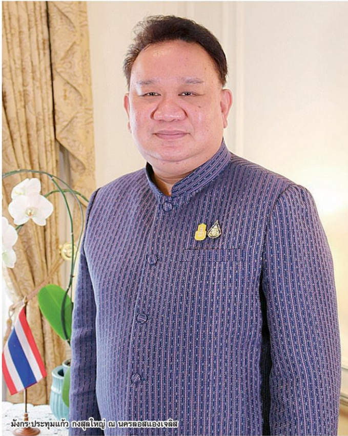
มังกร ประทุมแก้ว กงสุลใหญ่ ณ นครลอสแอนเจลิส

หัวข้อข่าว: แกระรอยภารกิจติดตามสมบัติแห่งชาติ...เส้นทางจากอเมริกาคลับสู่มาตุภูมิ