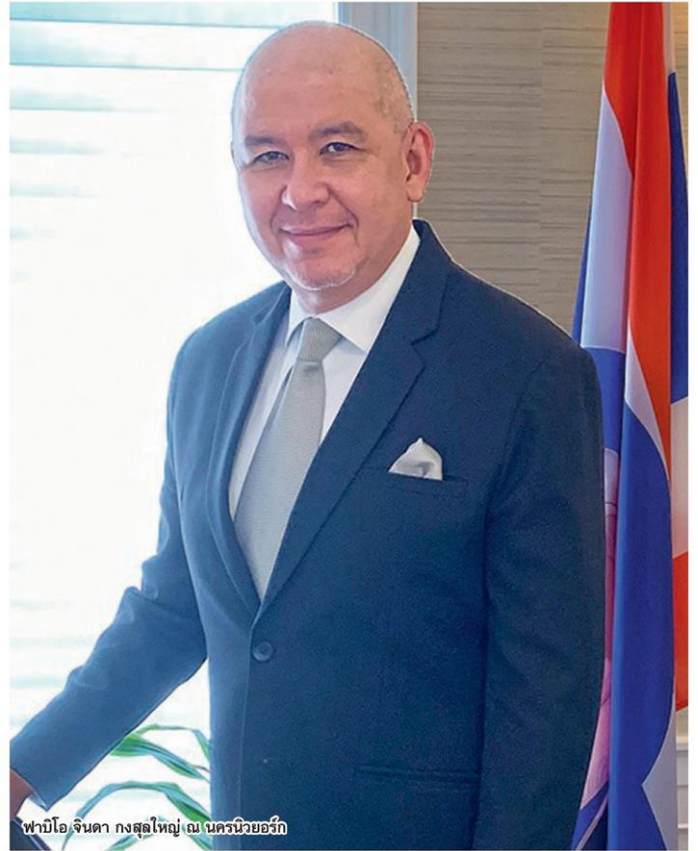
พามิ โอ จินดา กงสุลใหญ่ ณ นครนิวยอร์ก

เหล่านักกลับคืนสู่อ้อมอกพวกเราชาวไทยได้สำเร็จ