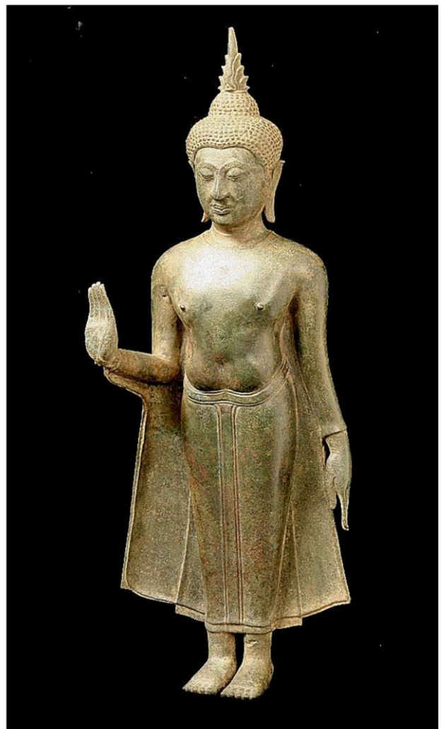
โบราณวัตถุ 3 ชิ้น จากจำนวน 13 ชิ้น (จากซ้าย) พระพุทธรูปศิลปะทวารวดี และพระพุทธรูป 2 องค์ในยุคร่วมสมัยอยุธยา

หลาย ๆ ท่านคงได้ยืมการแถลงข่าวเรื่องการขอคืนวัตถุโบราณของไทยที่มีผู้ครอบครองในสหรัฐ ซึ่งได้มาอย่างไม่ถูกต้อง และประเทศไทยกำลังจะได้รับคืนวัตถุโบราณจำนวนหนึ่งในเร็ววันนี้กันมาแล้ว ซึ่งเบื้องหลังของกระบวนการต่างๆ นั้นมีความซับซ้อน ลำบาก และใช้เวลาและความพยายามอย่างที่ว่าหลายท่านคงคาดไม่ถึง เพราะวัตถุโบราณต่างๆ ส่วนใหญ่อยู่ในความครอบครองของเอกชน หรือนักธุรกิจที่ซื้อต่อๆ กันมาด้วยราคาแพง การจะให้คืนกันง่ายๆ ฟรีๆ ไม่ใช่