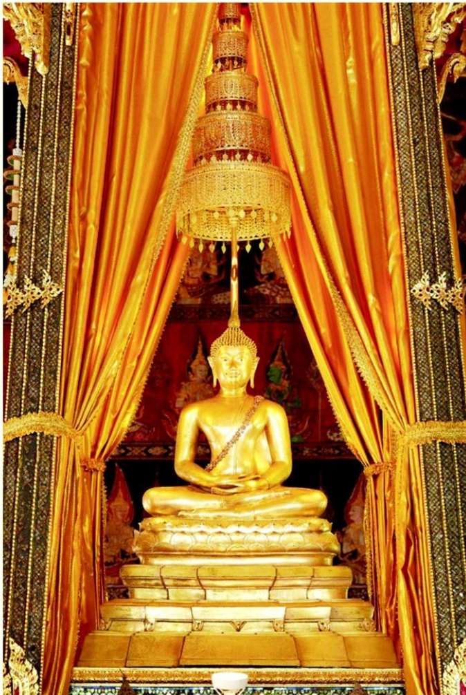
สักการะพระพุทธรสิหิงค้เสริมสิริมงคลวันปีใหม่ไทยท้พิพิธภัณฑท้พระนคร