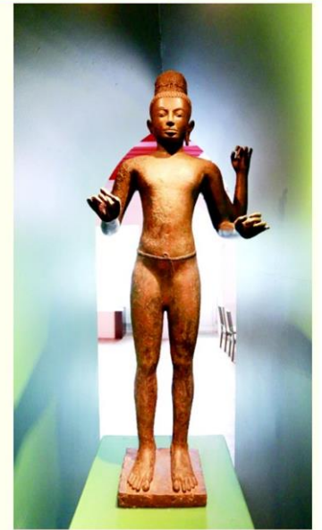
ชมความงามมคิลปะลพบุรีผ่าน ประติมากรรมกลุ่มประโคนชัย