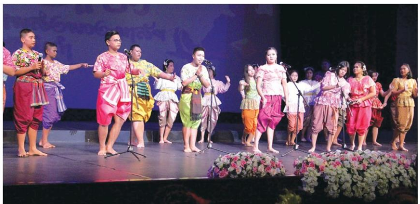
การแสดงเพลงอีแซว