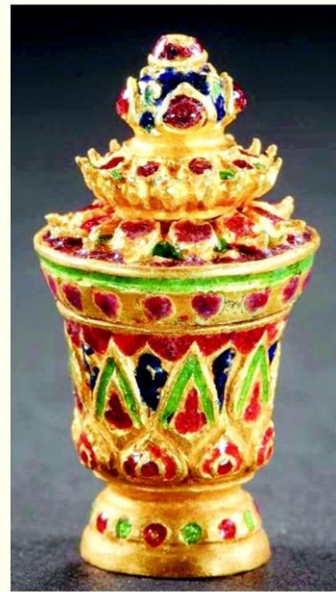
สรงน้้าพระธาดู 23 พระองค้ ประดิษฐานในพระกรณท้