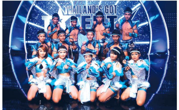
นาฏมวยไทย