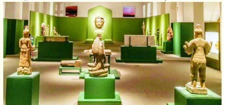
สงกรานต้เปิดนทรศการพิเศษ ใหว้สุดยอดโบราณวัตตุคิลปะลพบุรี ใชมท้ พิพิธภัณฑท้พระนคร

6 ทศกาลสงกรานต้ทุกปีกรงเทพมหานคร จะอัญเชิญพระพุทธรสิหิงค้องค์จำลอง ออกมาจากพระที่นั่งพุทไธสวรรย์ พิพิธภัณฑสถานแห่งชาติ พระนคร ไปประดิษฐาน บนมณฑป ณ สถานที่จัดงานแตกต่างกันไป เปิดใให้ประชาชนร่วมสรงน้้าและสักการบูชา ใเพื่อความเป็นสิริมงคลรับปีใหม่ไทย แต่การแพร่ระบาดของเชื้อไวรัสโควิด-19 ระลอกใหม่จาก คลัสเตอร์สถานบันเทิง ส่งผลใให้ กทม.ยกเลิกสรงน้้าพระพุทธรสิหิงค้ และงดจัดกิจกรรมสงกรานต้ แต่ถึงตอนนี้ยังมีหลายหน่วยงานจัด กิจกรรมอนุรักษ์ สืบสาน ประเพณีสงกรานต้