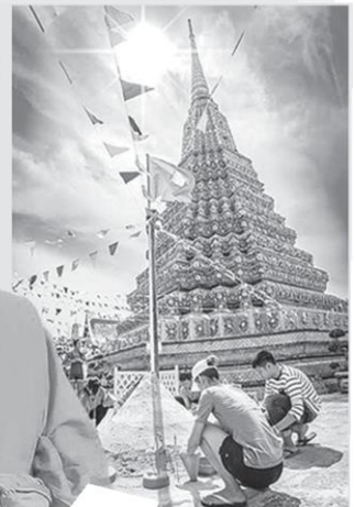
พระราษปริยัตินิ

19 มี.ค.2564 ระบุว่า “ให้วัดทุกวัดพิจารณาจัดศาสนพิธีและส่งเสริม โบราณประเพณีในวัดแบบนิวนอร์มอล เน้นเรื่องสุขภาพกาย สุขภาพจิต และจัดพิธีต่างๆ ให้สอดคล้องกับแนวทางมาตรการของรัฐบาลอย่างเคร่งครัด” สำหรับ แนวปฏิบัติกิจกรรม “สงกรานต์วิถีใหม่ สืบสานวัฒนธรรมไทย” ประกอบด้วย การจัดพิธีรดน้ำดำหัว ขอพรผู้ใหญ่ เพื่อความเป็นสิริมงคล มีองค์ประกอบหลัก คือ น้ำอบน้ำหอม น้ำส้มป่อย เทียนดอกไม้ โดยตักน้ำหอม น้ำปรุง