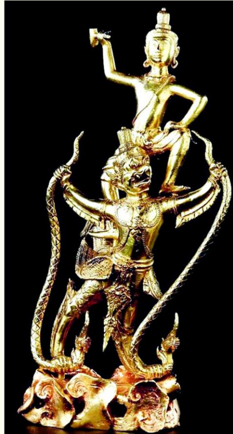
สร้างหน้าพระราหูทรงครุฑ 1 ใน 9 เทวดานพเคราะห์ที่