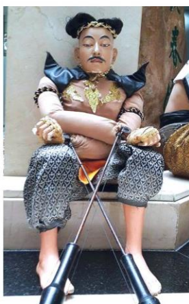
หุ่นละครเล็ก ณ สยาม

เป็นประจำทุกเดือนกับความสนุกสนานที่ ศูนย์การค้า เอ็ม บี เค เซ็นเตอร์ ผนึกหน่วยงานภาครัฐ กลุ่มวัฒนธรรมพื้นบ้าน และสถาบันการศึกษา เดินหน้าสร้างแลนด์มาร์คักหมุด งานดนตรี และการแสดงใจกลางเมืองกับงาน “เทศกาลดนตรี มาร้อง เล่น เต้น กัน” (MBK Center Music & Performance Fest) ชมการแสดงสุดพิเศษในสัปดาห์ที่ 2 และ 4 ของทุกเดือน โดยสำหรับเดือนเมษายนนี้ชวนย้อนวันวานกลับไปใบบรรยากาสงกรานต์แบบไทยๆ กับการแสดงพื้นบ้าน เล่าขานตำนานสงกรานต์ และเล่นที่แห่ง