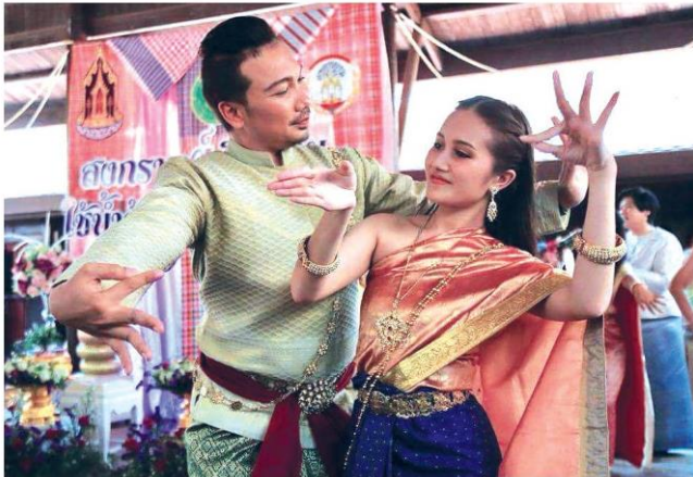
การแสดงเทศกาลดนตรี