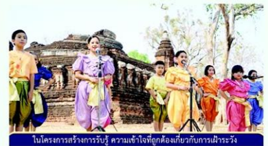
ในโครงการสร้างการรับรู้ ความเข้าใจที่ถูกต้องเกี่ยวกับการเฝ้าระวัง

รู้สึกภูมิใจที่ได้เรียนรู้ร่วมอนุรักษ์สืบสานการแสดงลำตัดและได้ใช้ทักษะนี้ช่วยเผยแพร่ความรู้ด้านต่างๆไปสู่ประชาชน