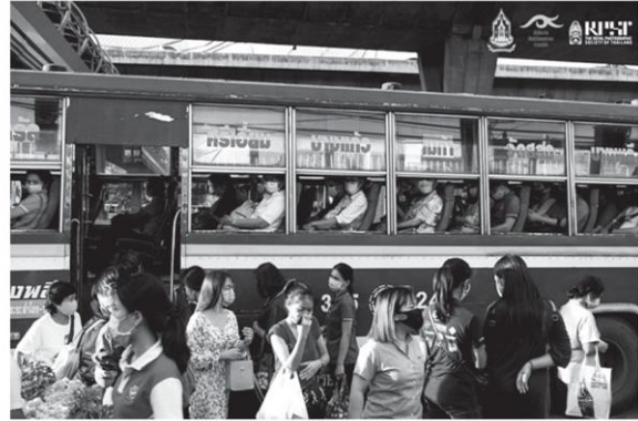
ผลงาน รถเมล์ที่วุ่นวาย นายดลธรรม จงสอนสุข