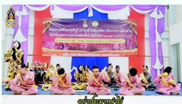
เช่นเรียนจบแล้ว

ถือเป็นตัวอย่างความร่วมมือของภาคของภาครัฐ ภาคเอกชน และภาคประชาชน ในการผ่านพ้นวิกฤตครั้งนี้ไปด้วยกัน