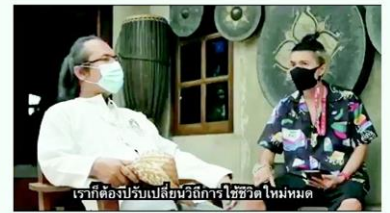
เราต้องปรับเปลี่ยนวิถีการใช้ชีวิตใหม่หมด