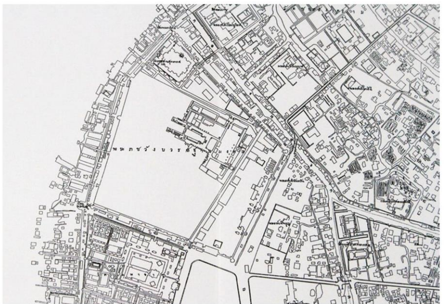
แผนที่ฉบับธงชัยแสดงตำแหน่งวังหน้า สนามหลวงเดิม และวังเจ้านายต่างๆ

แม้แผนที่ “ฉบับนายวอนนายสอน” พ.ศ.2439 จะบันทึกลักษณะกายภาพดังกล่าวไว้เช่นกัน แต่ ก็เทียบกันกว่าจะนำมาใช้ศึกษาในรายละเอียดได้ หรือในส่วนของหนังสือ “ตำนานวังหน้า” ที่แม้จะ