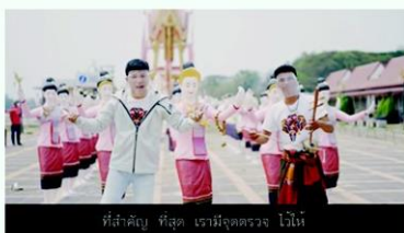
ที่ลำดวน พิษณุ ธานี จตุตถราช วัฒนี