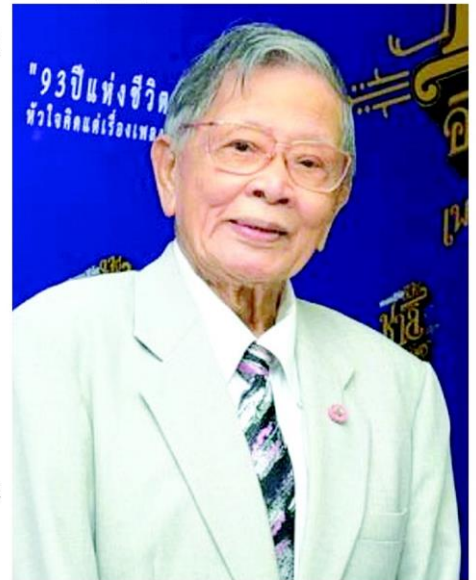
ครูชาลี อินทรวิจิตร

สำหรับประวัติของครูชาลี อินทรวิจิตร ศิลปินแห่งชาติ สาขาศิลปะการแสดง (ผู้ประพันธ์คำร้อง-ผู้กำกับภาพยนตร์) พุทธศักราช 2536 เกิดเมื่อวันที่ 6 กรกฎาคม พุทธศักราช 2465 ที่จังหวัดสมุทรสาคร สำเร็จการศึกษาจากโรงเรียนอำนวยการศิลป์ และโรงเรียนวิศวกรรมรถไฟ ท่านเป็นบุคคลที่สนใจเรื่องเพลงมาแต่เด็ก ทุกครั้งที่มีการจัดงานของวัดต่างๆ จะต้องไปประกวดร้องเพลงทุกครั้ง และมักจะได้รับรางวัลที่ 1 อยู่เป็นประจำ จากนั้นได้เข้าสู่วงการแสดงละคร วงการนักร้อง วงการภาพยนตร์ ซึ่งจากการสั่งสมประสบการณ์ทำให้มีความสามารถโดดเด่นทั้งเรื่องการร้องเพลง การประพันธ์เพลง การกำกับการแสดง ภาพยนตร์ โดยเฉพาะด้านการประพันธ์เพลง มีผลงานสร้างสรรค์เกือบ 1,000 เพลง ผลงานเพลงที่สร้างชื่อเสียงเป็นอมตะจนปัจจุบันมีจำนวนมาก เช่น เพลงสตูดิโอ มหาราชชา แสนแสบ ท่าดลอม สาวนครชัยศรี ทุ่งรวงทอง มนต์รักดอกคำใต้ แม่กลอง ฯลฯ