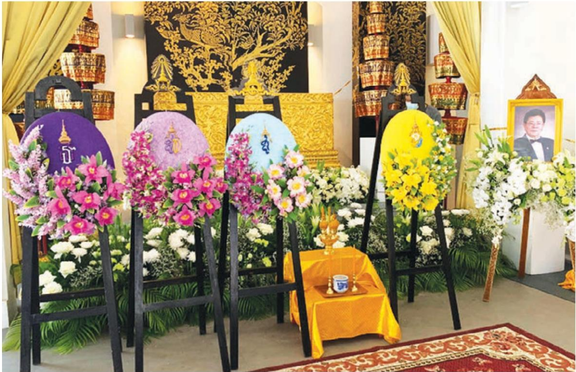
พระบาทสมเด็จพระเจ้าอยู่หัว ทรงพระกรุณาโปรดเกล้าฯ พระราชทานหีบลายสลัประดับมณีประดับมุก เป็นเครื่องเกียรติยศประกอบศพ นายชาลี อินทรวิจิตร ศิลปินแห่งชาติ สาขาศิลปะการแสดง (ผู้ประพันธ์คำร้อง-ผู้กำกับภาพยนตร์) ประจำปีพุทธศักราช 2536 ที่ศาลา 9 วัดธาตุทอง เขตวัฒนา กรุงเทพฯ วานนี้ (5 พ.ค.)