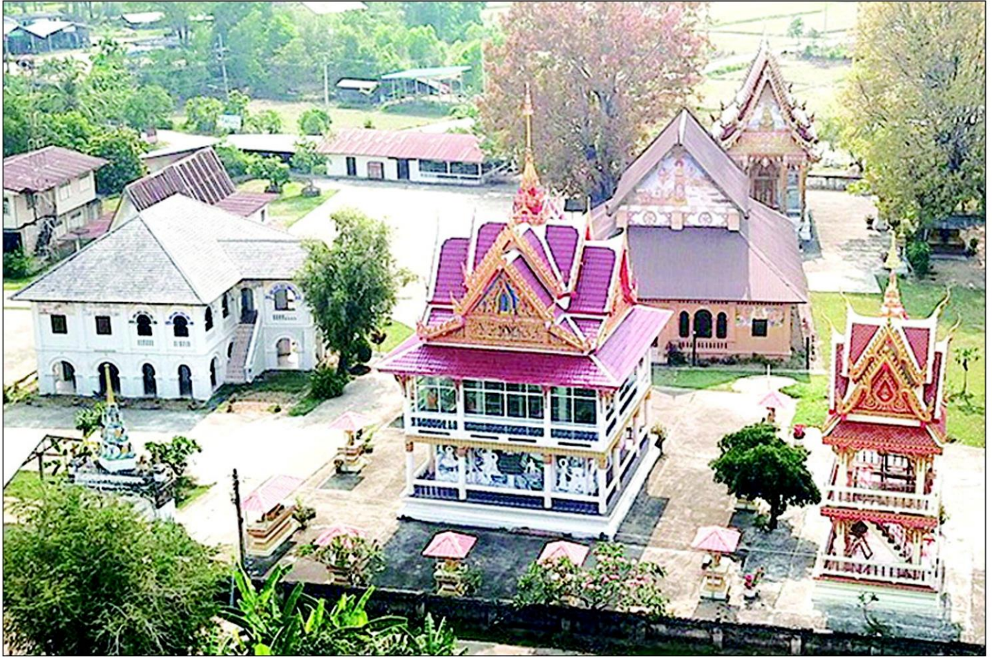
วัดศรีชมชื่น บ้านพิมาน หมู่ 3 ต.พิมาน อ.นาแก จ.นครพนม อายุเก่าแก่กว่า 200 ปี ซึ่งเป็นที่ค้นพบกุฎิพระ ศาลาการเปรียญ สถาปัตยกรรมโบราณสถาน ช่างฉนวนสไตส์ฝรั่งเศส สวยงามวิจิตรตระการตาจากยุคล่าอาณานิคม