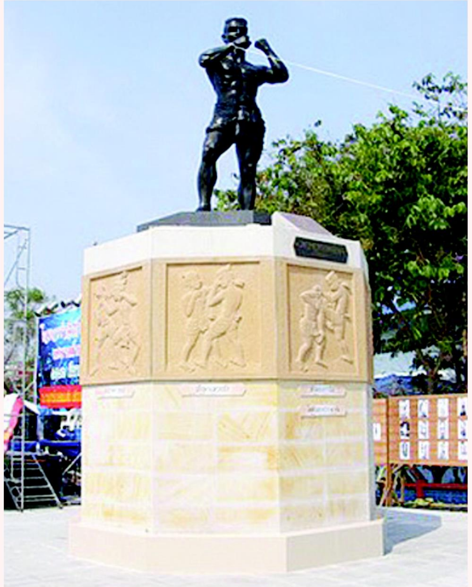
ภาพอนุสาวรีย์นายขนมต้มที่ อ.บางบาล จ.พระนครศรีอยุธยา

ส่วนนายขนมต้ม ถือว่าเป็นยอดนักมวยในตำนานที่คนไทยและคนทั่วโลกไม่