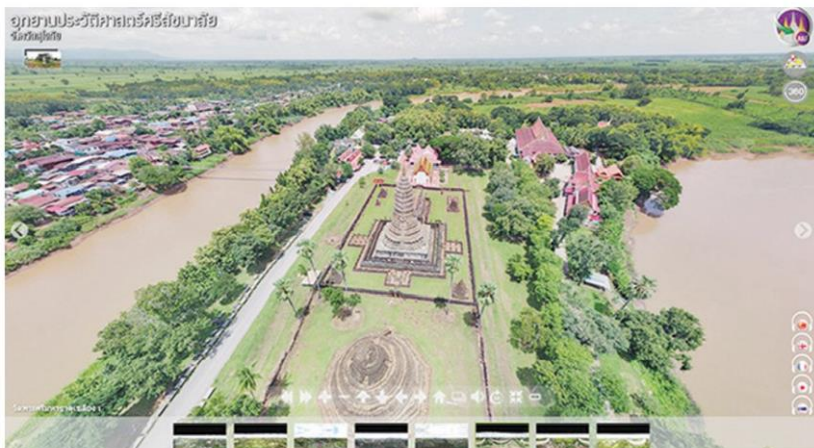
วัดพระศรีรัตนมหาธาตุเมืองเสลียงริมแม่น้ำยม

ราชสิมา ซึ่งเป็นที่ตั้งของ “ปราสาทหินพิมาย” ปราสาทหินที่ใหญ่ที่สุดในประเทศไทย ซึ่งแสดงให้เห็นถึงความเป็นศูนย์กลางและเป็นปากประตูสำคัญจากลุ่มแม่น้ำมูลไปสู่เมืองพระนครของอาณาจักรขอม และบ้านเมืองในเขตลุ่มน้ำเจ้าพระยา