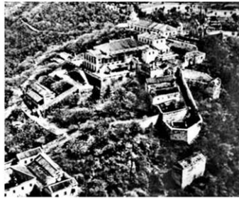
พระราชวังพระนครคีรี ในอดีต