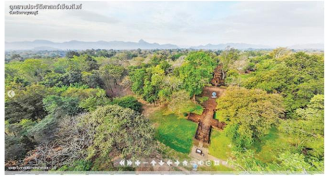
ปราสาทเมืองสิงห์ล้อมรอบด้วยภูเขาสูงแปลกตา