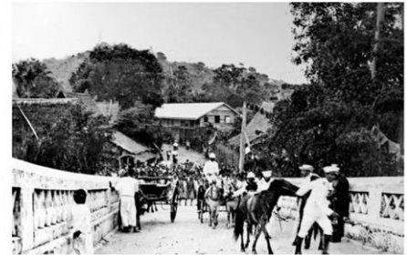
พระบาทสมเด็จพระจุลจอมเกล้าเจ้าอยู่หัว ร.5 เสด็จ ประพาสเมืองเพชรบุรี พ.ศ.2452 ด้านหลังจะเห็น พระนครคีรี (เขาวัง)

ยาวนาน เป็นเมืองที่เคยรุ่งเรืองมาตั้งแต่ สมัยโบราณและเป็นเมืองหน้าด่านที่สำคัญ ของไทยในกลุ่มหัวเมืองฝ่ายตะวันตก ตั้งอยู่บริเวณที่ราบลุ่มริมฝั่งแม่น้ำเพชรบุรี เป็นแหล่งอยู่อาศัยของชุมชนมาแต่สมัย ประวัติศาสตร์ และมีพัฒนาการเข้าสู่ยุค สมัยต่างๆ จากฝั่งตะวันออกของแม่น้ำ เพชรบุรี มีวัดกำแพงแลง และย้ายมายังฝั่ง ตะวันตกซึ่งมีวัดมหาธาตุเป็นศูนย์กลาง สืบเนื่องมาจนถึงสมัยสุโขทัย ออยุธยา เป็นเมือง ทำค้าขายทางเรือที่สำคัญ มีภูมิประเทศ ทั้งเป็นที่สูงติดเทือกเขาและที่ราบชายฝั่ง ทะเล มักเรียกชื่อสั้นๆ ว่า เมืองเพชร ปรากฏชื่อเรียกในเอกสารต่างประเทศ เช่น พิพิริย์ พิพพิล หรือ พิพรี และจากหลักฐาน ไนล์สมัยพระเจ้าซัวยรมันที่ 7 ปรากฏชื่อว่า ครีชัยวัชรปุร อีกด้วย