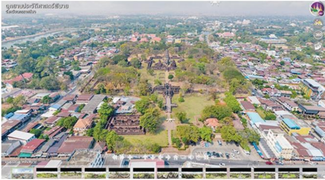
ปราสาทหินพิมายท่ามกลางชุมชน

หัวข้อข่าว: เทียวทิพย์มุมมองใหม่ ชมโบราณสถานมูสูงงามแปลกตา