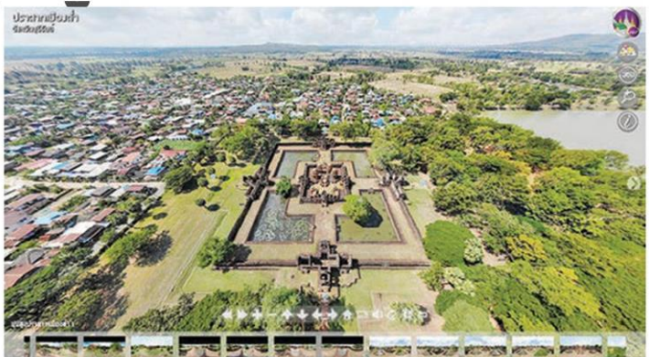
ปราสาทเมืองต่ำที่มีผังปราสาทงดงาม

ศาสนสถาน สะพานโบราณ ย่านการค้าโบราณ รวมทั้ง ร่องรอยชุมชนชาวต่างชาติ โดยมีโบราณสถานไม่ต่ำกว่า 300 แห่ง