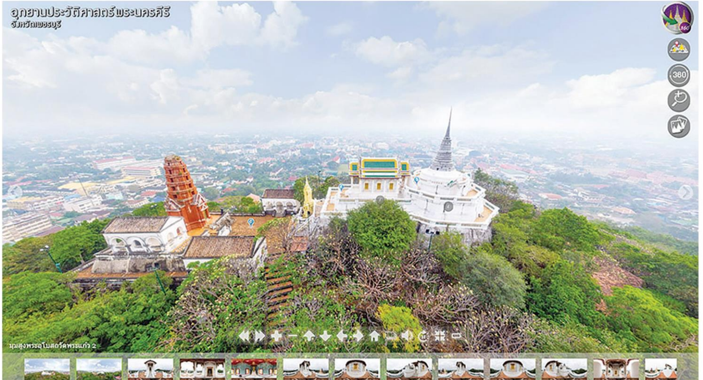
ชมวิวโบราณสถานพระนครคีรีมูสูงจากเว็บของกรมศิลปากร

หัวข้อข่าว: เทียวทิพย์มุมมองใหม่ ชมโบราณสถานมูสูงงามแปลกตา