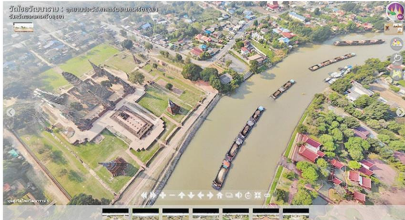
วัดไชยวัฒนารามริมแม่น้ำเจ้าพระยา

หัวข้อข่าว: เทียวทิพย์มุมมองใหม่ ชมโบราณสถานมูสูงงามแปลกตา