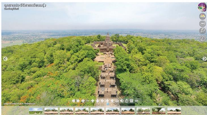
ปราสาทพนมรุ้งบนยอดเขา