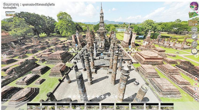
วัดมหาธาตุและเจดีย์รายภายในวัด