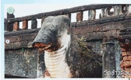
วัฒนธรรมของโลก

ตะลุยกโลกใบใหญ่ สัปดาห์นี้ “ที่มีมังกร” ขอพาไปเที่ยว อุทยานประวัติศาสตร์ศรีสัชนาลัย อ.ศรีสัชนาลัย จ.สุโขทัย อุทยานแห่งนี้ได้รับการยกย่องให้เป็นมรดกทาง