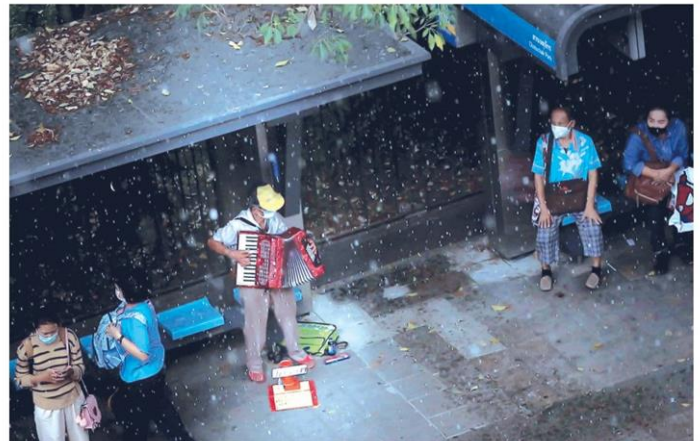
รองชนะเลิศอันดับ 1 ได้แก่ ภาพ Music in the rain

ภายหลังจาก สำนักงานศิลปวัฒนธรรมร่วมสมัย กระทรวงวัฒนธรรม ร่วมกับสมาคมถ่ายภาพแห่งประเทศไทย ในพระบรมราชูปถัมภ์ ได้จัดกิจกรรมประกวดภาพถ่ายภายใต้ "โครงการศิลปินร่วมสมัย สู้ภัยโควิด ด้วยจิตสำนึก #2" ในหัวข้อ "บันทึกคนไทยหัวใจไม่เคยท้อ" ซึ่งเงินรางวัลรวมมูลค่ากว่า 2,019,000 บาท พร้อมโล่รางวัลเกียรติยศ โดยเปิดรับภาพ 14 กุมภาพันธ์-15 มีนาคม 2564 ที่ผ่านมามีผู้สนใจประกวดเข้ามาประกวดมากถึง 1,829 คน