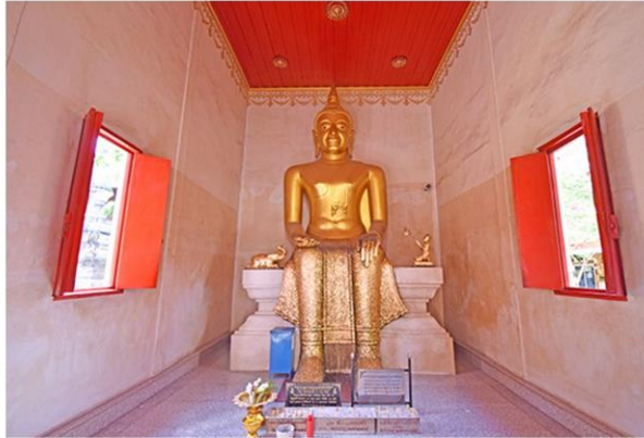
ประดิษฐานพระปางปาลิไลยก์