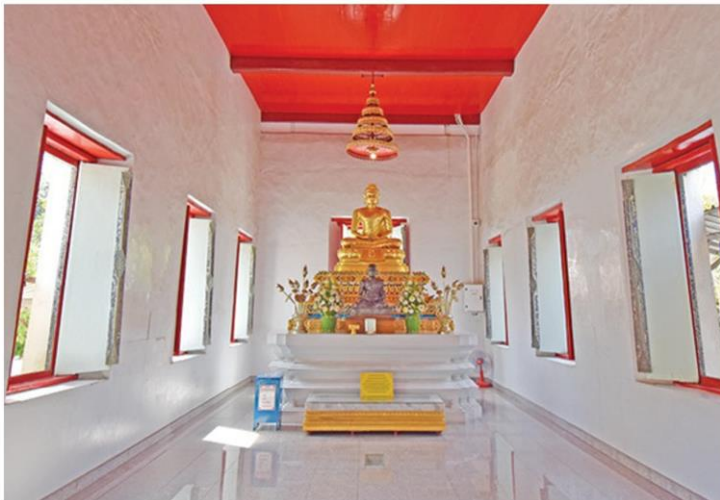
องค์พระประธานภายในอุโบสถ

ได้อุโบสถมีช่องใต้ถุนไว้ให้พุทธศาสนิกชนลอดใต้โบสถ์ โดยมีความเชื่อว่าลอดแล้วขอให้รอดปลอดภัย แล้ววัดลาด ภัยอันตรายทั้งปวง โดยด้านล่างมีช่องมองพระประธาน ส่วนด้านขวามือมีลูกนิมิตโบราณ 9 ลูก หากลูกนิมิตครบทั้ง 9 จะประสบความสำเร็จ ความเจริญ ความสำเร็จ ตามที่ปรารถนา