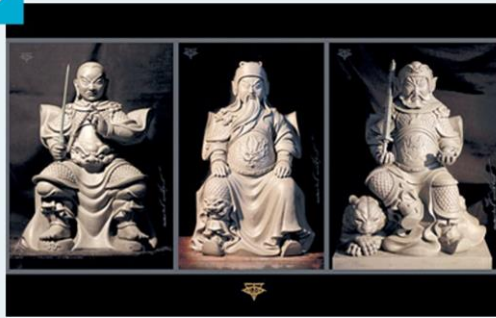
'คิดถึง น้อมนำ ทำตาม' แรบบันดาลใจสร้างงานศิลปะ: >8