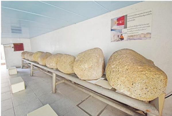
ลูกนิมิตโบราณ 9 ลูก ด้านใต้อุโบสถ