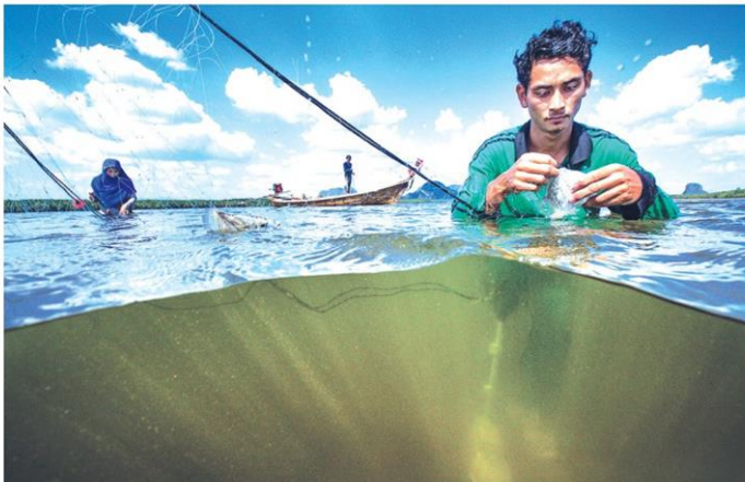
รองชนะเลิศอันดับ 1 ได้แก่ ภาพ ทาปลาในอ่าวพังงา