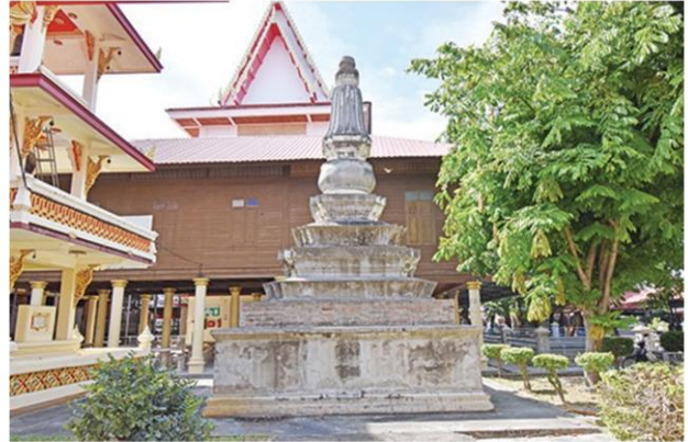
เจดีย์โบราณที่มีอายุกว่า 100 ปี