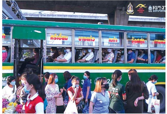
รางวัลชนะเลิศ ภาพ รถเมล์ที่วุ่นวาย