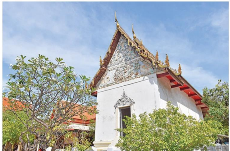
อุโบสถหลังเก่าของวัดป่าประดู่