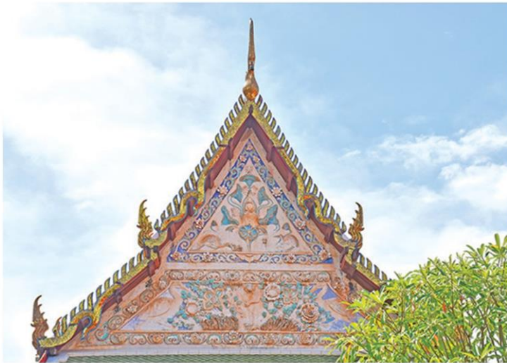
หน้าบันสวยที่สุดในภาคตะวันออกเฉียง