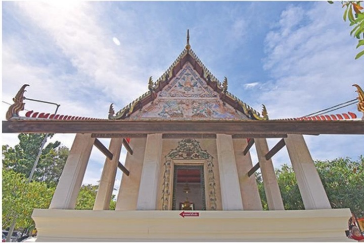
อุโบสถหลังเก่าอายุกว่า 100 ปี