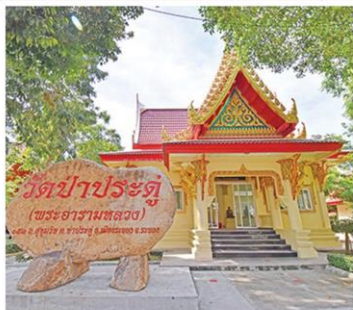
วิหารบูรพาจารย์