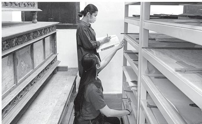
เจ้าหน้าที่พิพิธภัณฑ์สถานแห่งชาติ สมเด็จพระนารายณ์ สํารวจข้อมูลหนังสือกรมศิลปากร และบันทึกข้อมูลลงระบบอิเล็กทรอนิกส์ พร้อมจัดเก็บสิ่งของ และวัสดุอุปกรณ์เครื่องใช้ให้สามารถพร้อมให้บริการประชาชน.