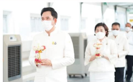
นายอิทธิพล คุณปลื้ม รัฐมนตรีว่าการกระทรวงวัฒนธรรม

นายอิทธิพล คุณปลื้ม รัฐมนตรีว่าการกระทรวงวัฒนธรรม เปิดเผยว่า วันวิสาขบูชาปีนี้ ตรงกับวันที่ ๒๖ พฤษภาคม ๒๕๖๔ ซึ่งโดยปกติกระทรวงวัฒนธรรม โดยกรมการศาสนา ได้ร่วมกับคณะสงฆ์ หน่วยงานภาครัฐและเอกชน จัดกิจกรรมส่งเสริมพระพุทธศาสนา เนื่องในเทศกาลวันวิสาขบูชา แต่เนื่องจากสถานการณ์การแพร่ระบาดของโรคติดเชื้อไวรัสโคโรนา (COVID-19) ในปัจจุบัน ส่งผลให้การจัดกิจกรรมส่งเสริมพระพุทธศาสนา เนื่องในเทศกาลวันวิสาขบูชา พุทธศักราช ๒๕๖๔ มีข้อจำกัด โดยการจัดกิจกรรมต้องปฏิบัติตามมาตรการคำแนะนำของกระทรวงสาธารณสุข เพื่อลดการแพร่ระบาดของโรคติดเชื้อมาก่อน ดังนั้น กระทรวงวัฒนธรรม โดยกรมการศาสนา จึงได้มุ่งเน้นเชิญชวนให้พุทธศาสนิกชนได้เรียนรู้ความสำคัญ