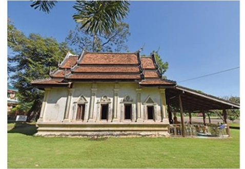
อุโบสถเก่าแก่อายุประมาณ 300 ปี