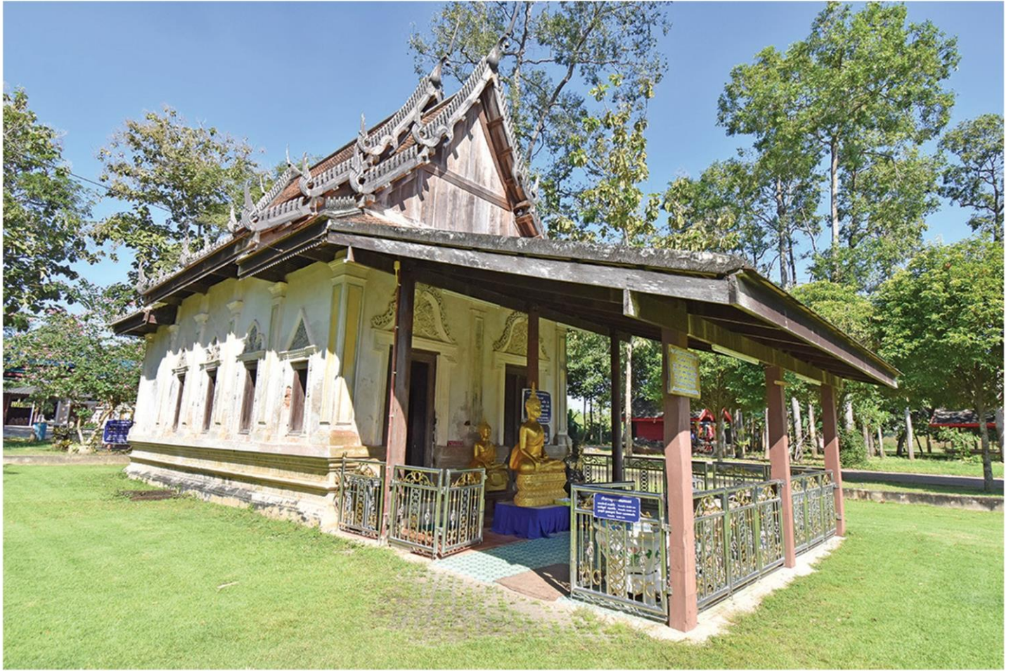
วัดราชบัลลังก์ประดิษฐานาราม หรือ วัดราชบัลลังก์

หัวข้อข่าว: สุขใจเปี่ยมศรัทธา ไหว้พระ 3 วัดเก่า สมัยอยุธยาสุดล้ำค่า จ.ระยอง