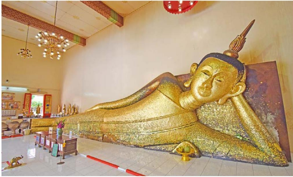
พระพุทธรูปนอนตะแคงซ้าย