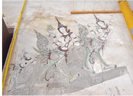
ภาพวาดจิตรกรรมฝาผนังภายในอุโบสถ