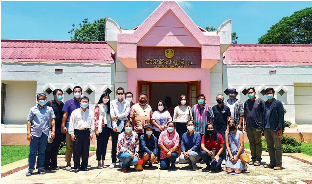
ผู้ร่วมประชุมหารือการจัดการพื้นที่ทางวัฒนธรรมเมืองเก่าพิมาย ระหว่างสำนักศิลปากรที่ 10 เทศบาลตำบลพิมาย นักวิจัยโครงการฟื้นฟูมรดกเมืองพิมาย และภาคีอนุรักษ์เมืองพิมาย