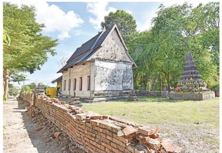
บริเวณด้านหลังอุโบสถ

สองข้างองค์หลวงพ่อ ซึ่งหลวงพ่อชาวองค์นี้คาดว่า มีอายุกว่า 500 ปี อันเป็นที่เคารพสักการบูชาของชาว ระยอง