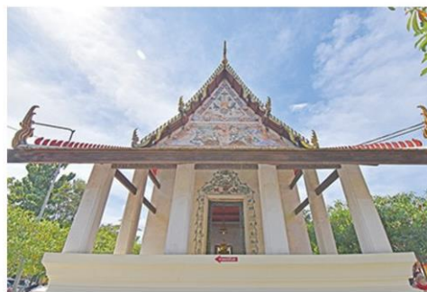
อุโบสถของวัดป่าประดู่

น้อยๆ จึงมีชื่อเรียกหมู่บ้านนี้ว่า “บ้านทะเลน้อย” ปัจจุบันก็ยังกันดารน้ำจืดอยู่ ชาวบ้านต้องอาศัยเก็บน้ำฝนไว้บริโภค เพราะน้ำในบ่อที่ขุดไว้ใช้มีรสกร่อยใช้ดื่มกินไม่ได้