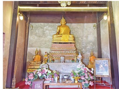
ภายในประดิษฐานพระพุทธรูปเก่าแก่