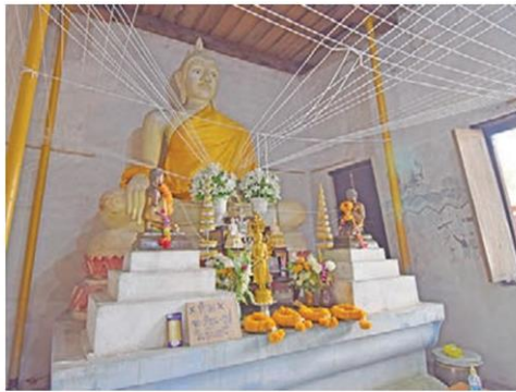
หลวงพ่อขาว พระพุทธรูปปูนปั้นปางมารวิชัย