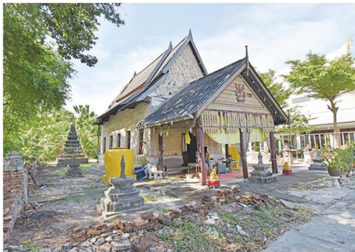
วัดโชด (ทิมชาราม) วัดเก่าแก่ของจังหวัดระยอง