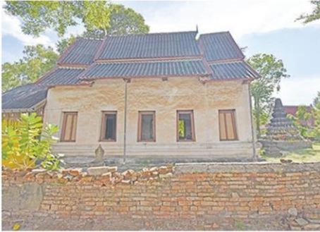
โดยรอบอุโบสถมีกำแพงแก้วล้อมรอบ

หัวข้อข่าว: สุขใจเปี่ยมศรัทธา ไหว้พระ 3 วัดเก่า สมัยอยุธยาสุดล้ำค่า จ.ระยอง