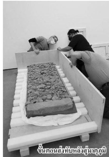
ขั้นตอนส่งทับหลังสู่มาตุภูมิ

ตรวจสอบสภาพทับหลัง พร้อมบันทึกข้อมูลในเบื้องต้น ก่อนมีพิธีบวงสรวงต้อนรับทับหลัง 2 รายการ โดยมีพระมหาราชครูพิธีศรีวิสุทธิคุณ ประธานพระครูพราหมณ์ เป็นประธานบวงสรวง และมีการแสดงระบำโบราณคดี ชุดลพบุรี ด้วย