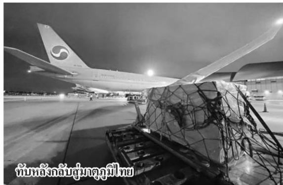
ทับหลังกลับสู่มรดกภูมิไทย

สถานกงสุลใหญ่ได้รายงานกระทรวง การต่างประเทศและกรมสารนิเทศ ซึ่ง ประสานงานกับกรมศิลปากร กระทรวง วัฒนธรรม เพื่อขอข้อมูลการศึกษาทาง วิชาการพร้อมหลักฐานที่เกี่ยวข้อง เช่น รายงานการสำรวจของกรมศิลปากร ตัวอย่างเอกสารอนุญาตในการส่งออก โบราณวัตถุ เป็นต้น เพื่อใช้ในการสืบสวน