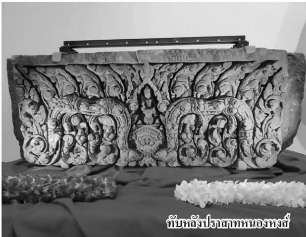
ทับหลังปราสาทหนองหงส์

ต่อมาเมื่อวันที่ 25 เม.ย.2564 สำนักงานสืบสวนเพื่อความมั่นคงแห่งมาตุภูมิหรือ