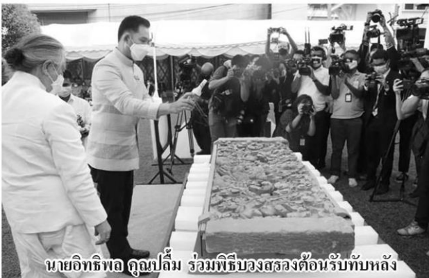
นายอิทธิพล คุณปลื้ม ร่วมพิธีบวงสรวงต้อนรับทับหลัง