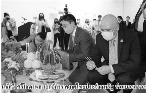
มนต์วิ ศรีโสภาพล เอกอัครราชทูตไทยประจำสหรัฐ ร่วมบวงสรวง

หัวข้อข่าว: ทับหลังหนองหงส์-เขาโล้น จากสหรัฐอเมริกาเข้าสู่แผ่นดินไทย