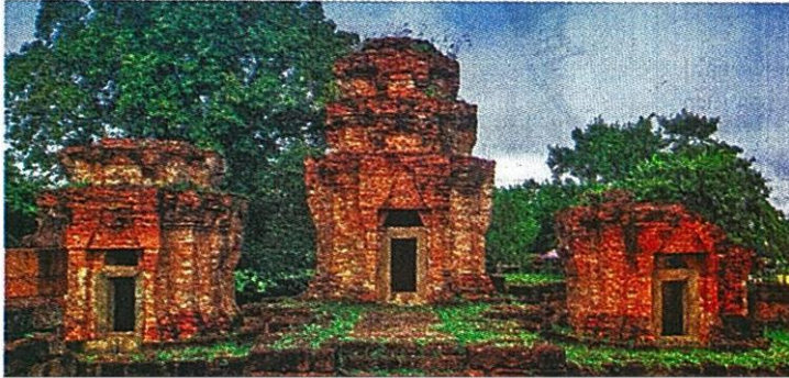
ปราสาทหนองหงส์