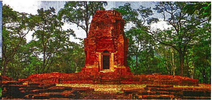
ปราสาทเขาล้าน

16-17 ซึ่งอยู่ในยุคเดียวกันกับนครวัด-นครธม ที่มีชื่อเสียงโด่งดังและเป็นที่รู้จักทั่วโลก และร่วมสมัยกับปราสาทเมืองต่ำ-ปราสาทน้อย ปราสาทพนมรุ้ง ปราสาทโคกปราสาทเหนือ ใน จ.บุรีรัมย์