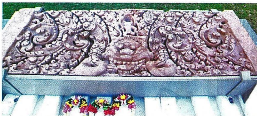
ทับหลังปราสาทเขาล้าน ในวันพิธีบวงสรวงต้อนรับ

ทับหลังปราสาทเขาล้าน เป็นโบราณวัตถุสำคัญของ "ปราสาทเขาล้าน" ที่ตั้งอยู่ภายในบริเวณวัดปราสาทเขาล้าน บ้านเจริญสุข ตำบลทัพราช อำเภอตาพระยา จังหวัดสระแก้ว