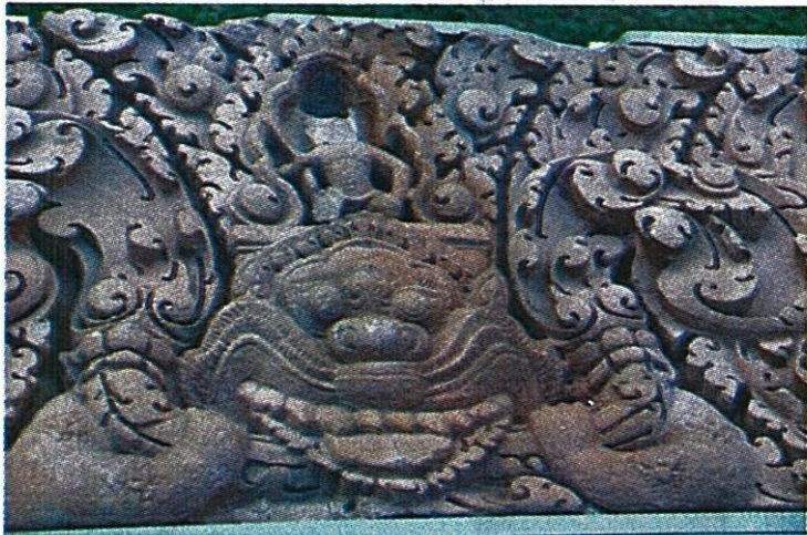
ทับหลังปราสาทเขาโล้น