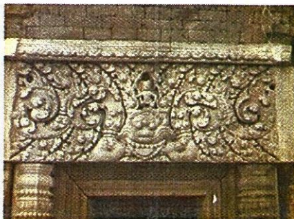
ทับหลังปราสาทเขาโล้น

“...ปราสาทเขาโล้นเป็นประสาทหลังเดียว ก่อด้วยอิฐ ทับหลังสลักเป็นรูปเกี้ยวรูปขอมอยู่ตรงกลาง มีริมฝีปากล่างและเส้นอกมาเป็นแผ่นสามเหลี่ยม มีเทวดาประทับนั่งชันเข่าอยู่ข้างบน อย่างไรก็ตามก่อนพวงมาลัยนั้นไม่ได้ออกมาจากปาก แต่อยู่ใต้ลิ้น และก่อนปลายของพวงมาลัยก็ขมวดเป็นวงโค้งสลับกันเพียงข้างละ 2 วงเท่านั้น เหตุนี้จึงอาจอยู่ในระหว่าง พ.ศ. 1700-1750 แทนที่จะอยู่ระหว่าง พ.ศ. 1600-1650 อย่างไรก็ตาม เสาอิงกรอบประตูและกรอบประตูหินทรายก็ดูอาจจะเก่าแก่กว่าระยะนี้ อายุของปราสาทแห่งนี้ยังไม่แน่นอนนัก มีจารึกสลักอยู่บนกรอบประตูด้านใต้และด้านเหนือไปถึง พ.ศ.1559 แต่เสาอิงประตูและกรอบประตูหินทรายเหล่านี้อาจจะนำมาจากปราสาทหลังอื่นที่เก่าแก่กว่านี้ได้...”