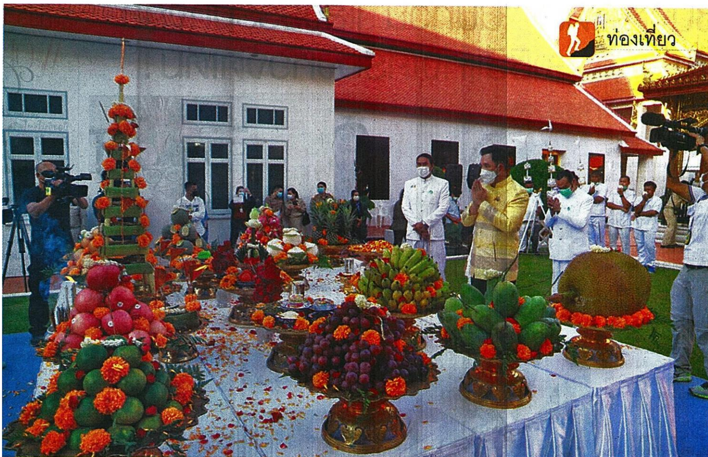
นายอิทธิพล คุณปลื้ม รัฐมนตรีว่าการกระทรวงวัฒนธรรม เป็นประธานในพิธี