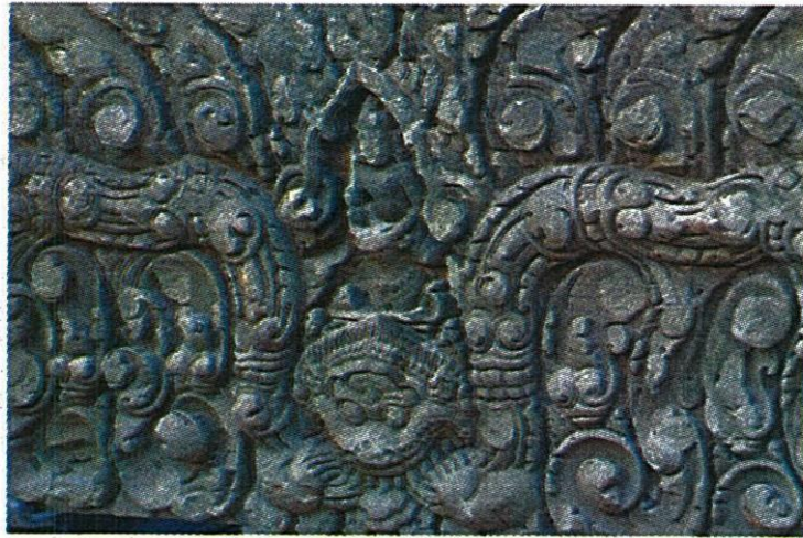
ทับหลังปราสาทหนองหงส์