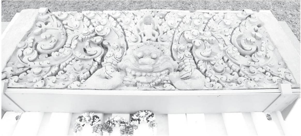
ทับหลังภาพเทวดาประทับนั่งในซุ้มเหนือเศียรเกียรติมุข (หน้ากาล) แวดล้อมด้วยลายพันธุ์พฤกษา ปราสาทเขาโล้น บ้านเจริญสุข ต.ทัพราช อ.ตาพระยา จ.สระแก้ว