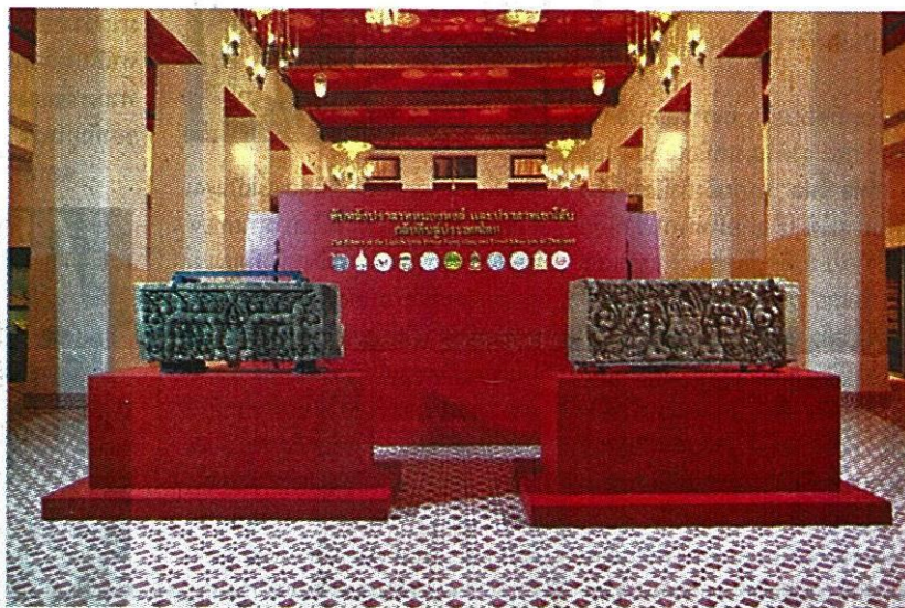
การจัดแสดงนิทรรศการของทับหลังทั้งสอง ณ พระที่นั่งอิศราวินิจฉัย พิพิธภัณฑ์สถานแห่งชาติพระนคร