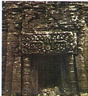
ทับหลังปราสาทหนองหงส์