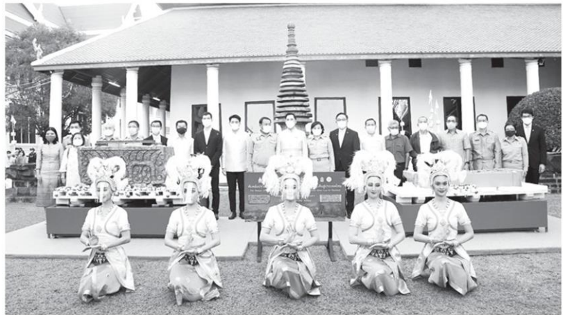
ด้านหลัง คณะกรรมการติดตามโบราณวัตถุของไทยในต่างประเทศกลับคืนสู่ประเทศไทย

“ ในครั้งนี้นับเป็นความร่วมมืออันสำคัญยิ่งระหว่างประเทศไทยและสหรัฐอเมริกา ทั้งภาครัฐและภาคประชาชนแสดงถึงความสัมพันธ์และมิตรภาพอันดีและยาวนานระหว่างทั้งสองประเทศ ”