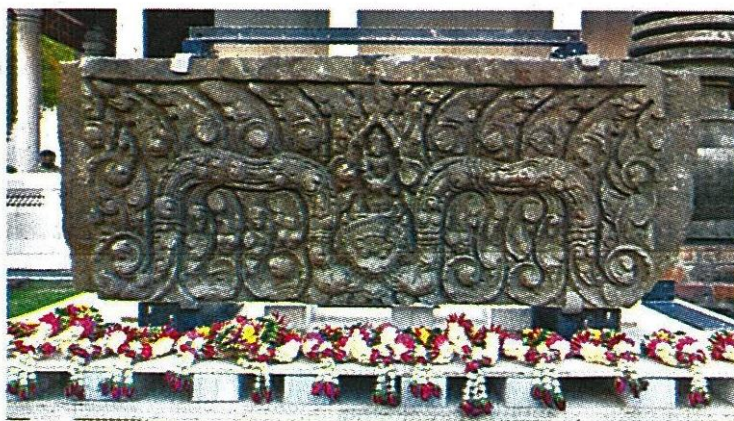
ทับหลังปราสาทหนองหงส์ ในวันพิธีบวงสรวงต้อนรับ