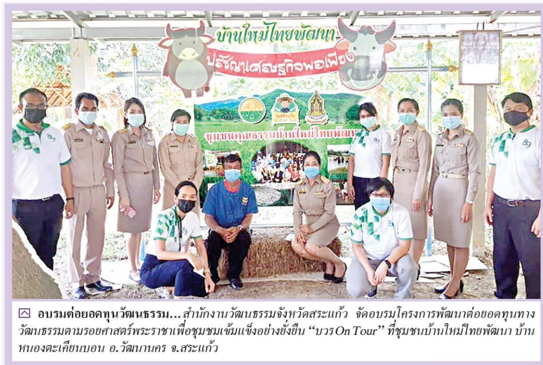
☑ อบรมต่อยอดทุนวัฒนธรรม... สำนักงานวัฒนธรรมจังหวัดสระแก้ว จัดอบรมโครงการพัฒนาต่อยอดทุนทางวัฒนธรรมตามรอยศาสตร์พระราชาทเพื่อชุมชนเข้มแข็งอย่างยั่งยืน “บวร On Tour” ที่ชุมชนบ้านใหม่ไทยพัฒนา บ้านหนองตะเคียนบอน อ.วัฒนานคร จ.สระแก้ว