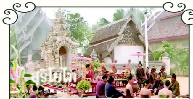
สุริโยทัย ปี พ.ศ. 2544 ไทยโพสต์ทำข่าวในเครือไทยโพสต์