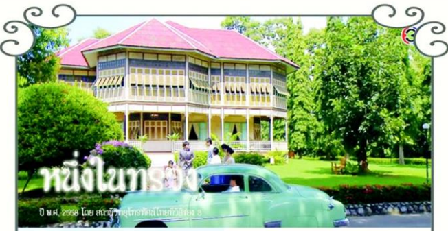
เชียงใหม่แกรนด์ ปี พ.ศ. 2558 ไทยโพสต์ทำข่าวในเครือไทยโพสต์