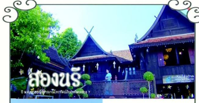
สองนรี ปี พ.ศ. 2540 ไทยโพสต์ทำข่าวในเครือไทยโพสต์