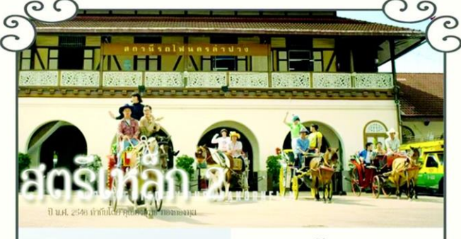
สตรียเหล็ก ปี พ.ศ. 2540 ไทยโพสต์ทำข่าวในเครือไทยโพสต์